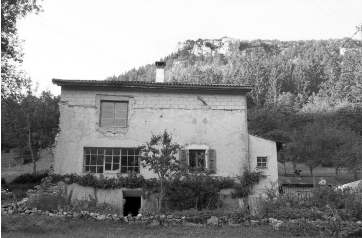
Façade latérale gauche.