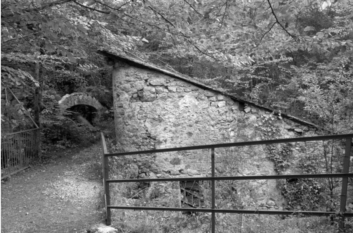
Site de la cascade : bâtiment d'eau.