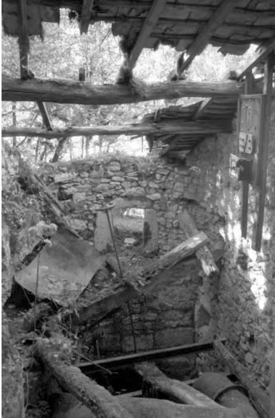
Site de la cascade : intérieur du bâtiment d'eau.