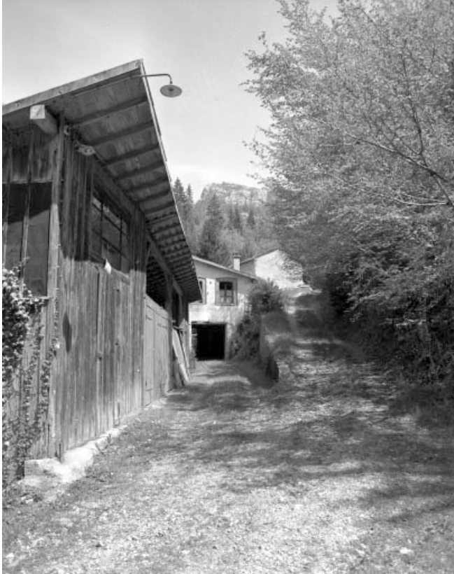
Remise d'automobile et passage couvert.