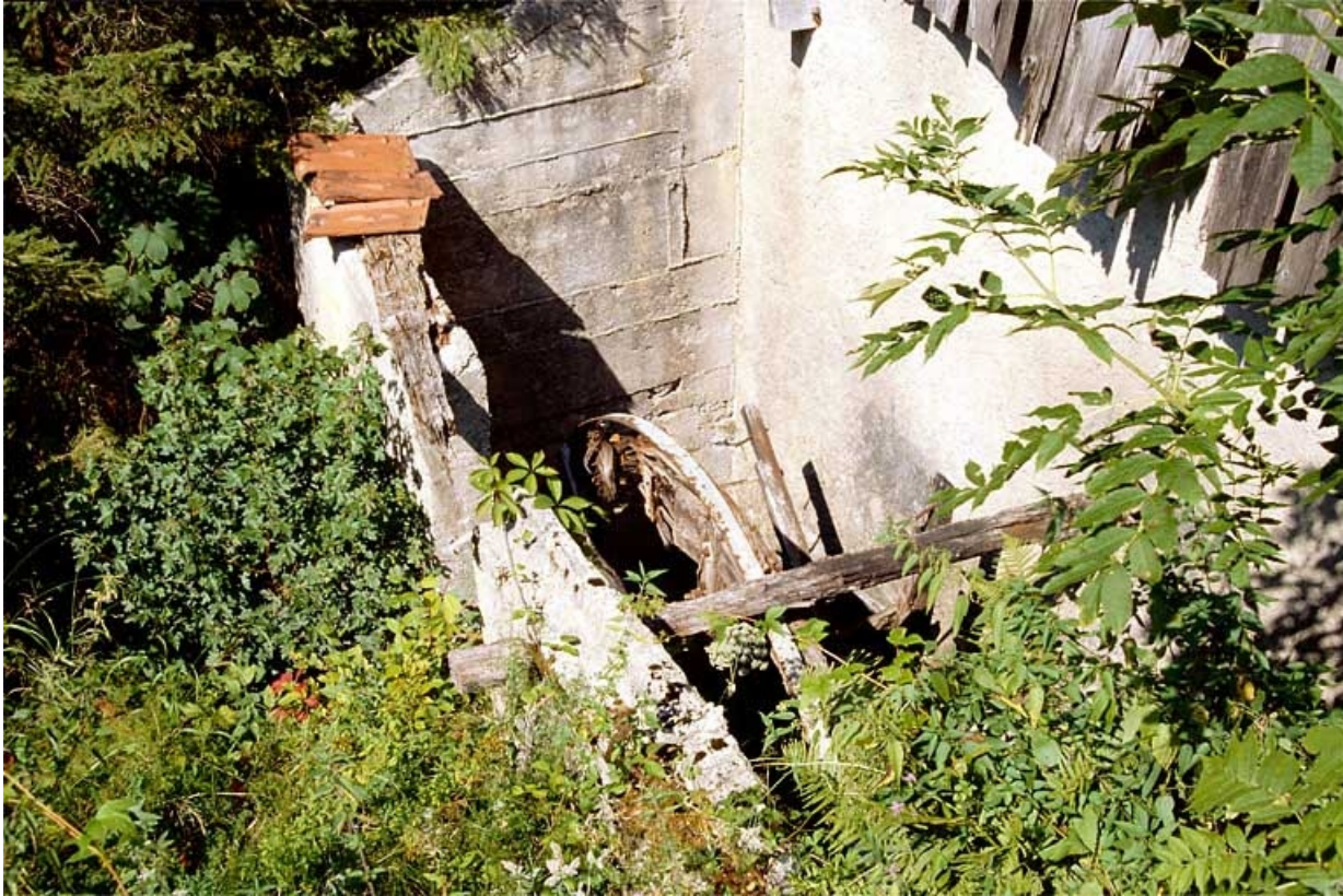
Vestige de la roue en dessus.