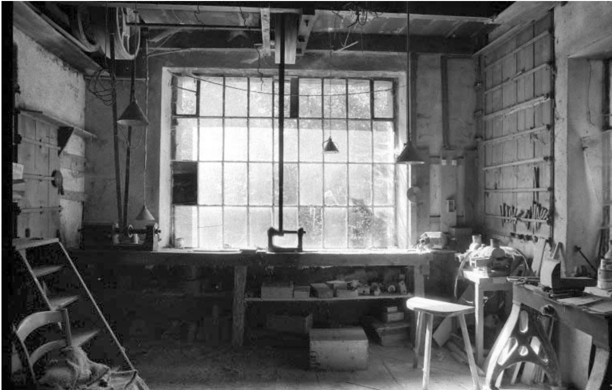
Intérieur d'un atelier de fabrication (bâtiment E).