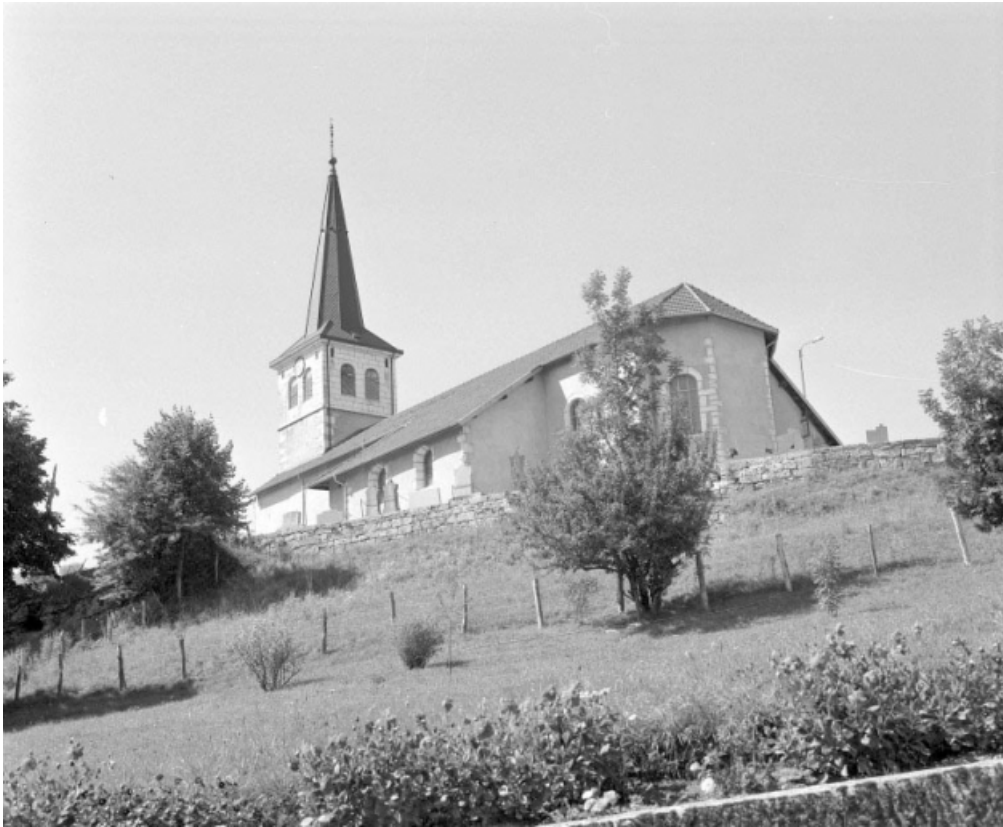
Extérieur : vue générale depuis le sud-est.