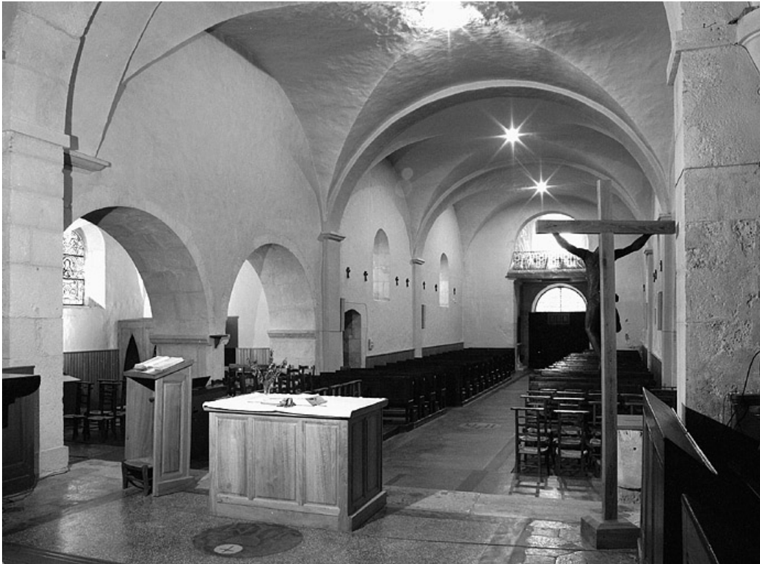
L'élévation sud du vaisseau central, vue depuis le chœur. 39, Viry