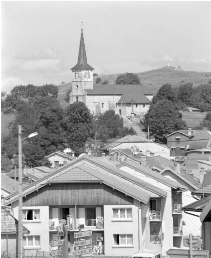
Vue de situation depuis le sud-ouest.