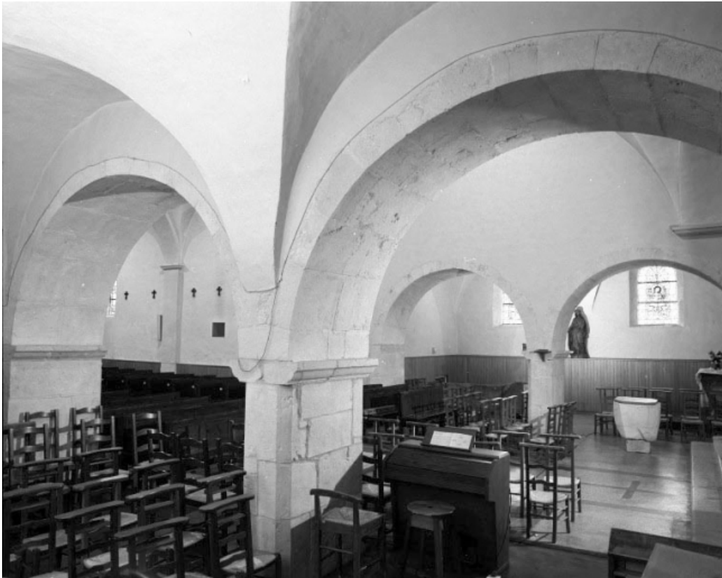
Le vaisseau central, vu depuis la chapelle latérale sud. 39, Viry