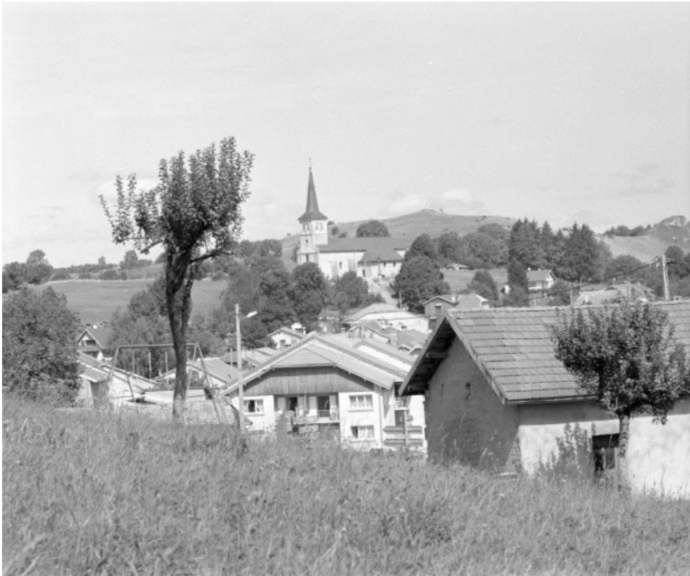
Vue de situation depuis le sud.