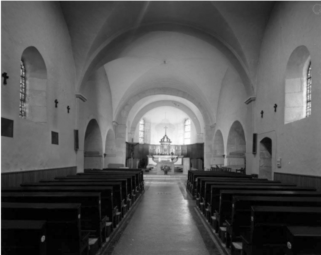
La nef et le chœur, vus depuis l'entrée.