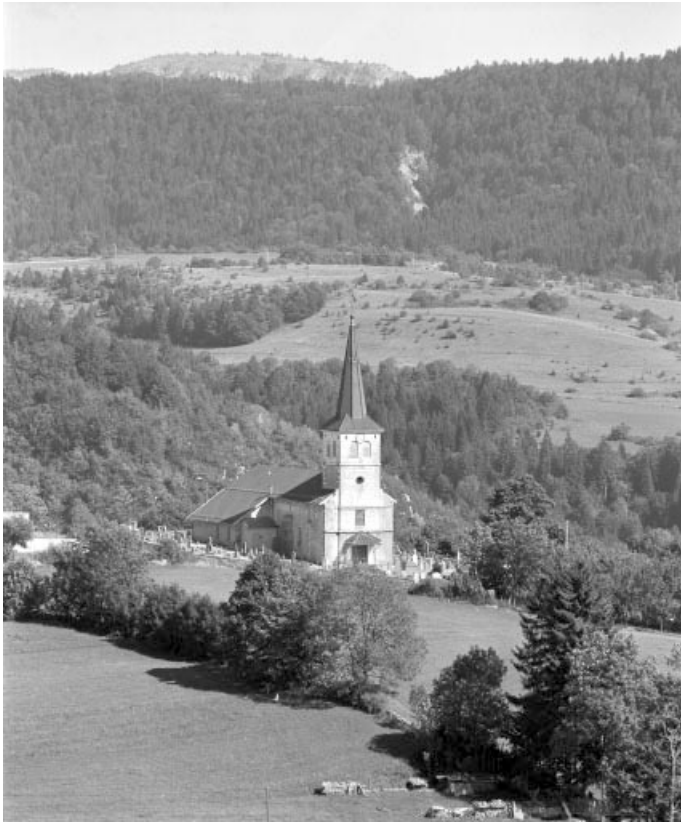
Vue de situation depuis le nord-ouest.