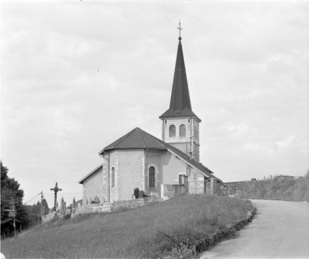
Extérieur : l'abside.