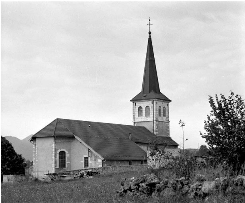
Extérieur : vue générale depuis le nord-est.