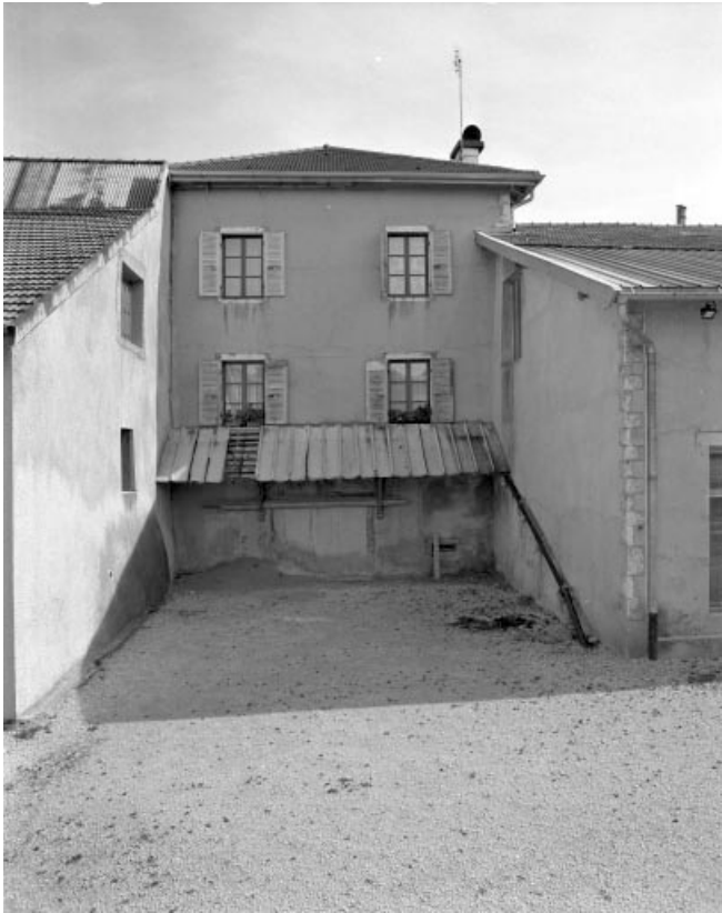
Façade postérieure du corps latéral.