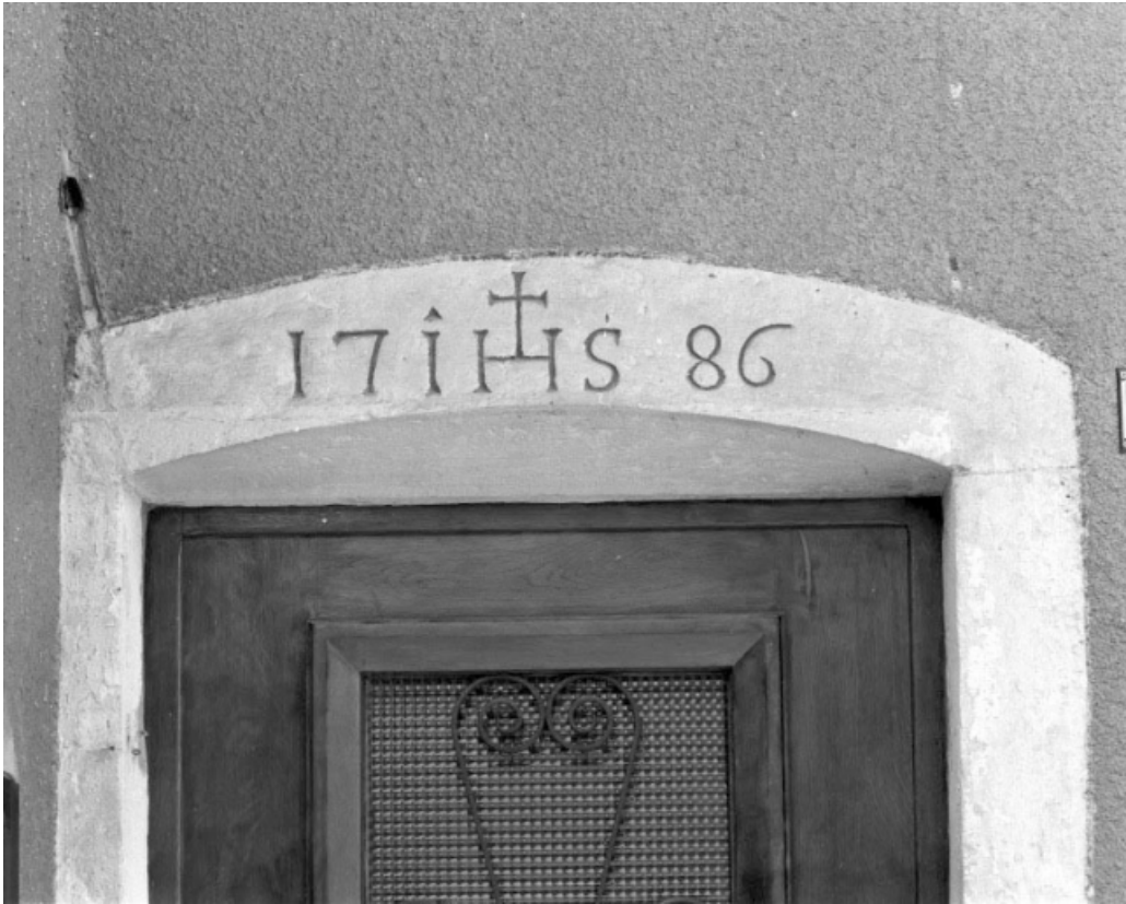
Linteau de la porte du rez-de-chaussée.