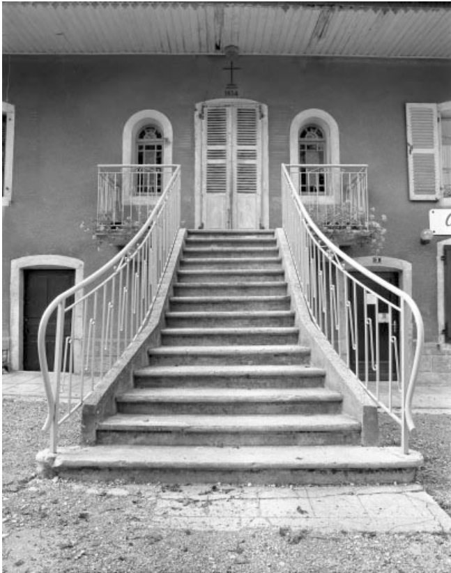
Escalier d'accès à la chapelle.