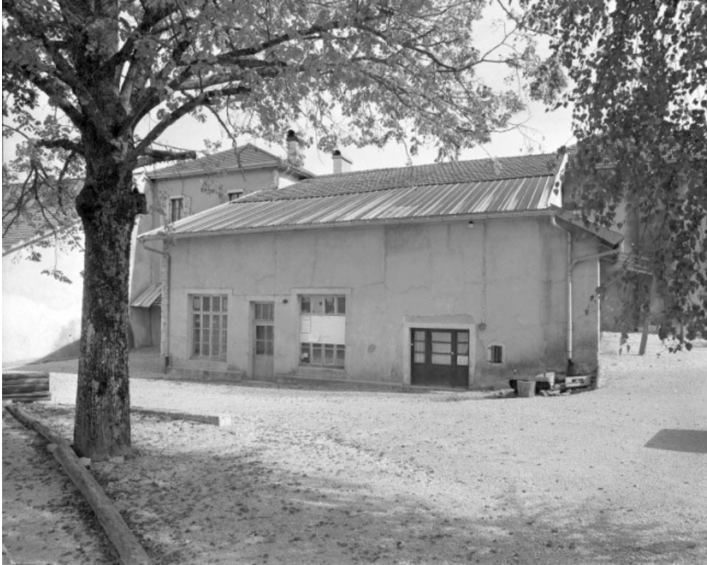
Façade postérieure du corps central.