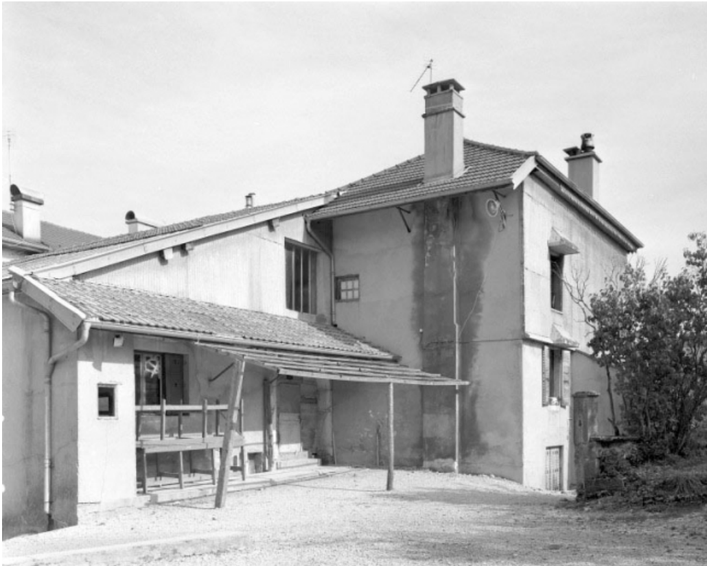
Côté droit du bâtiment.