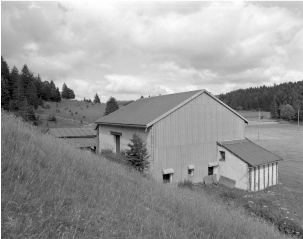
Face gauche recouverte d'un essentage de tôle et façade postérieure.

39, Les Moussières, lieudit : les Platières