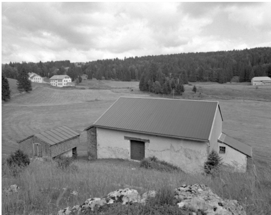
Façade postérieure avec resserre sur la gauche.

39, Les Moussières, lieudit : les Platières