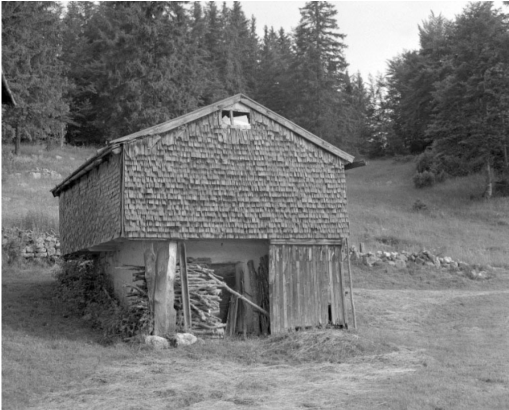
La resserre avec un accès en soubassement.

39, Les Moussières, lieudit : les Platières