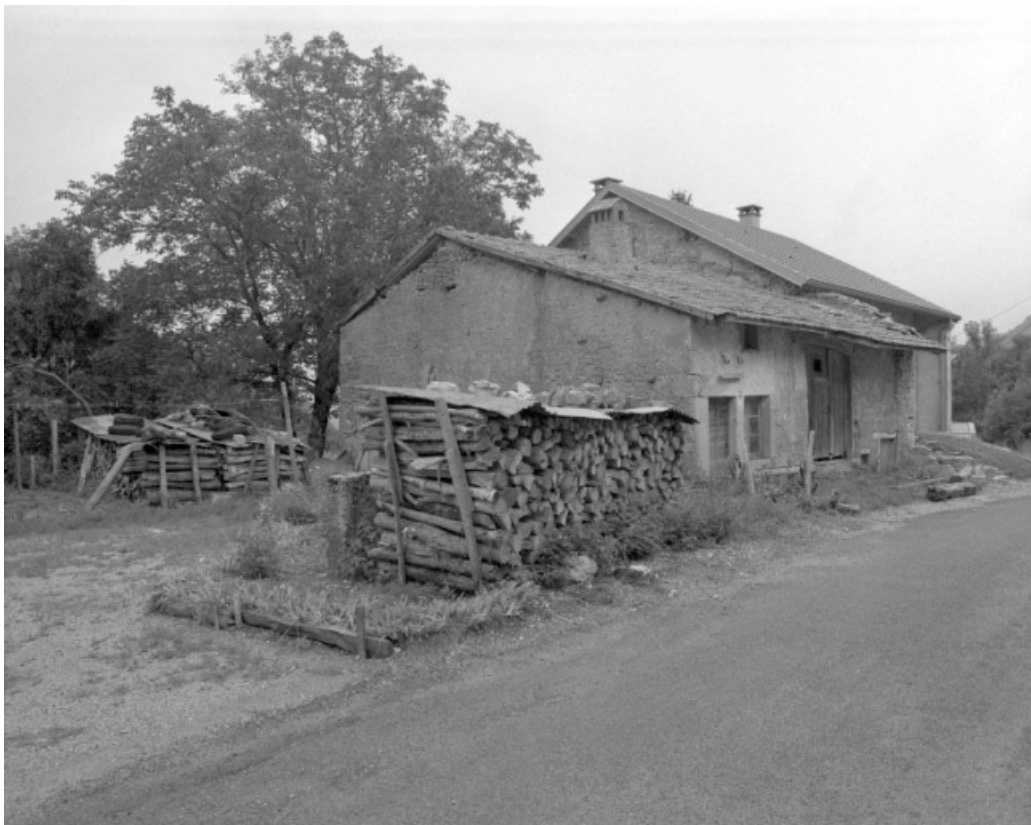
Façade antérieure et face gauche.