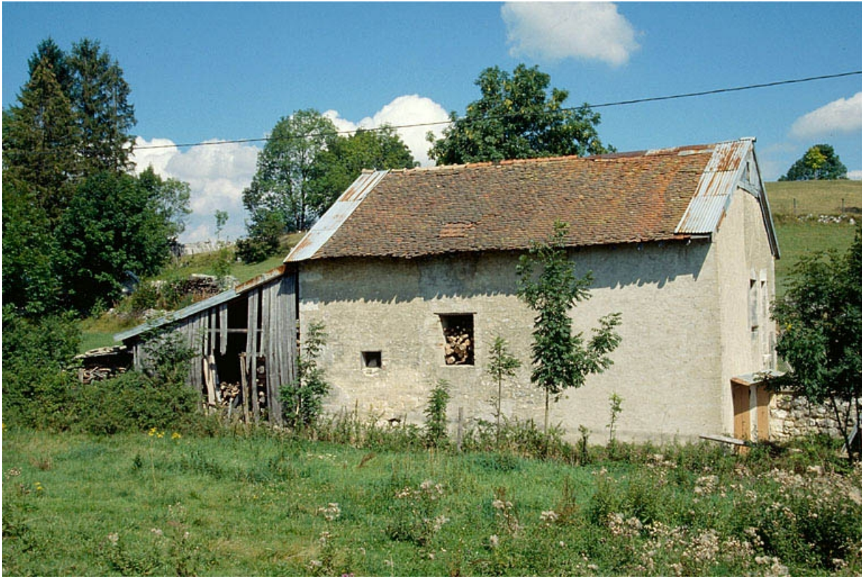
L'ancien chalet de fromagerie de Viry.