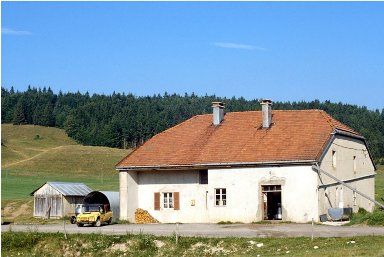
La fromagerie de Bellecombe, à Boulème, installée dans une ancienne ferme.