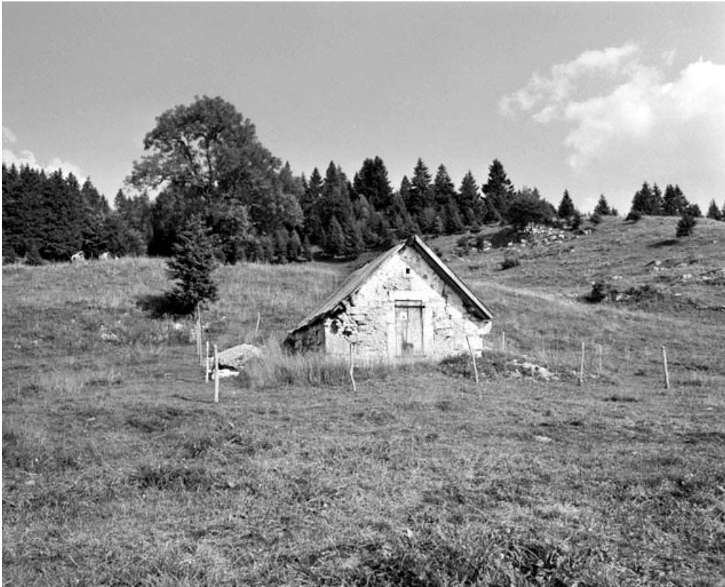
La Pesse : grenier fort situé au lieu-dit Le Pas Rouge.