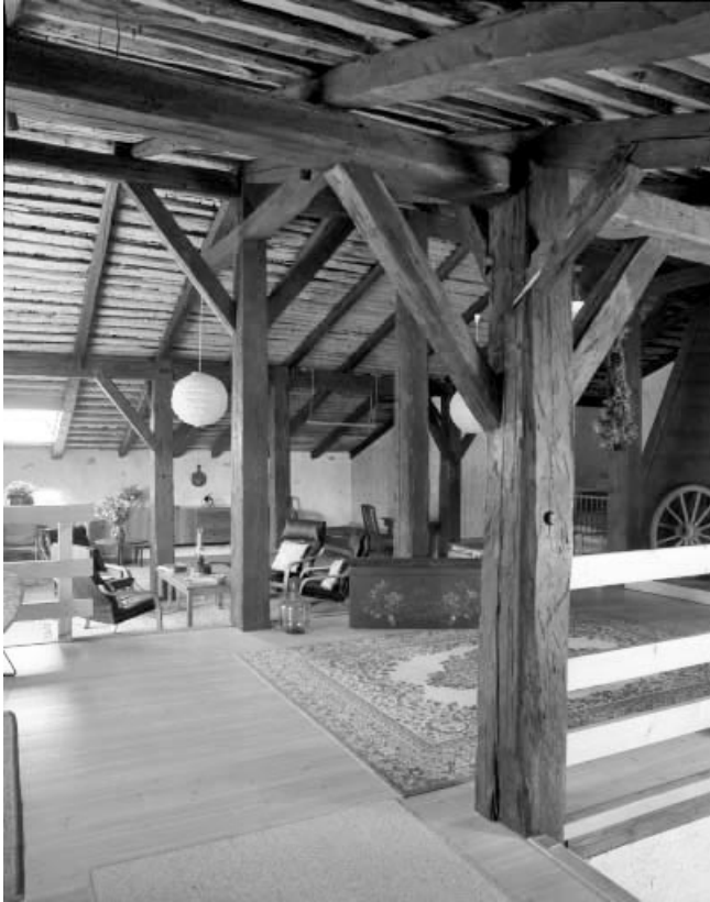
Les Moussières, ferme : grange haute et charpente sur poteaux.