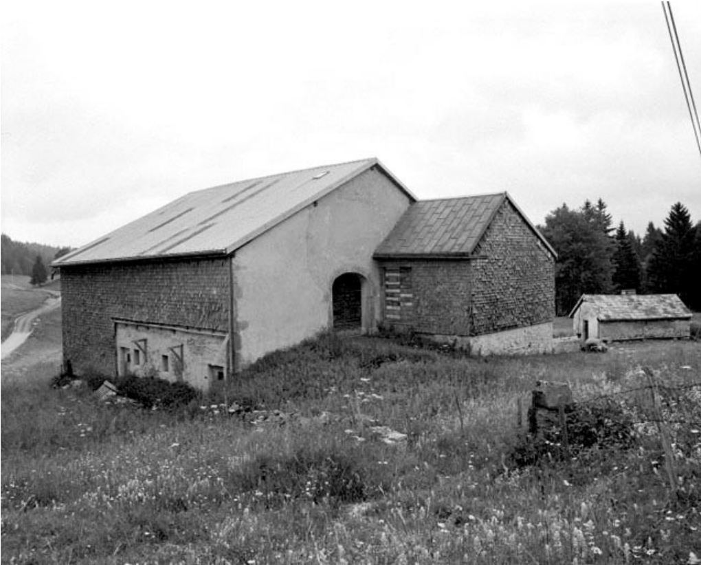
Bellecombe, ferme située au lieu-dit Les Grosses Coupes : extension sur la face latérale d'une ferme.