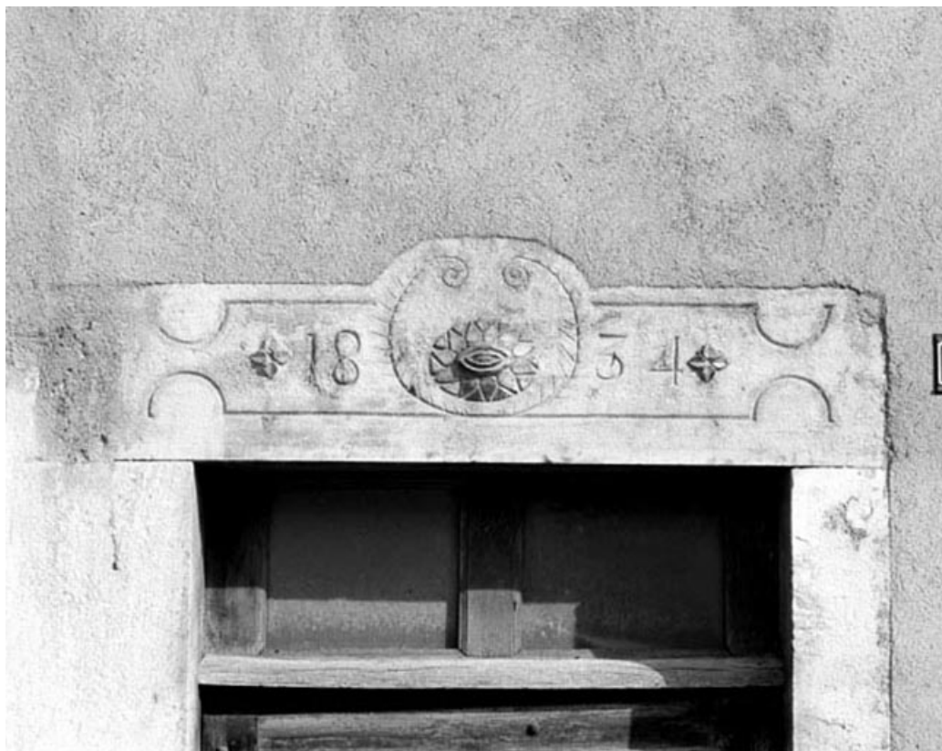
Viry, ferme : linteau décoré et portant la date 1834.