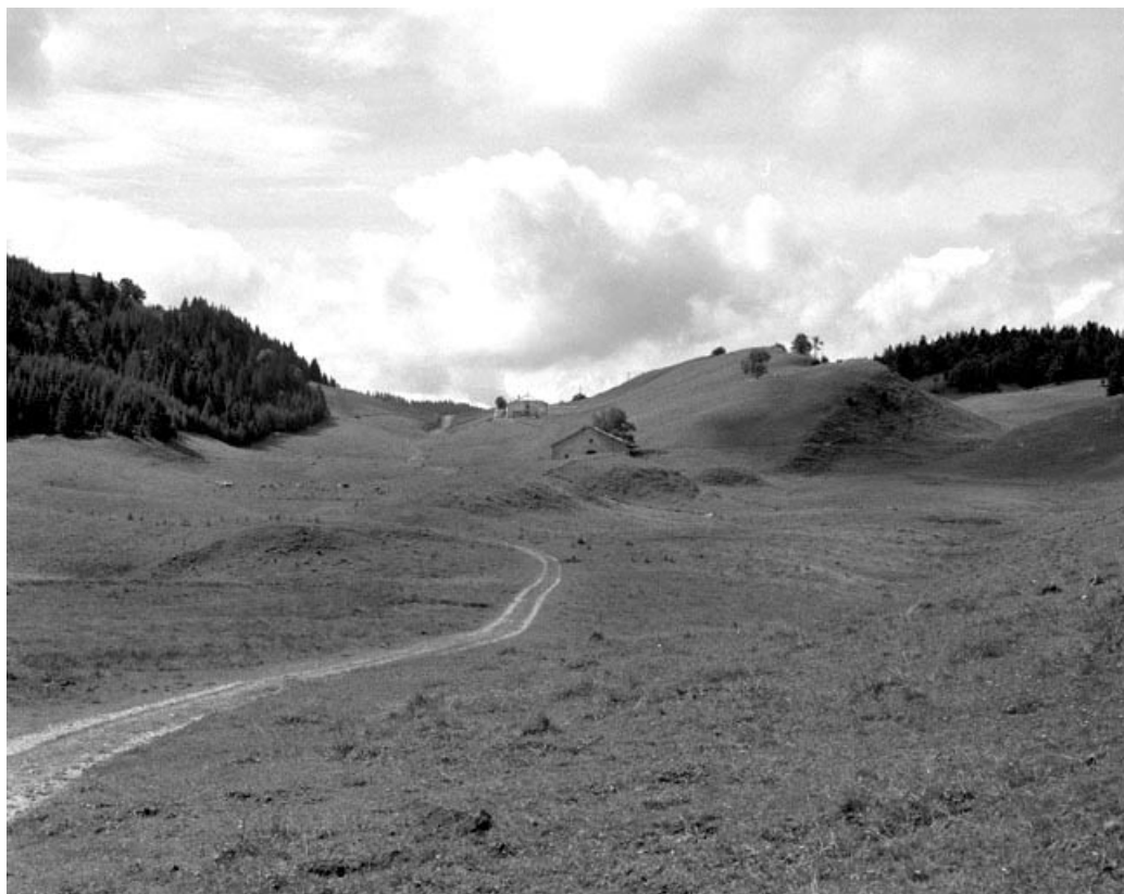
La Pesse : combe de Malatrait.