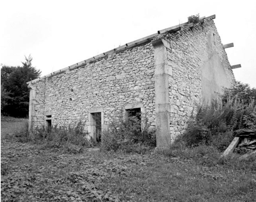
Les Bouchoux, ferme située au lieu-dit Sur Beau Regard : appareillage peu soigné de moellons.