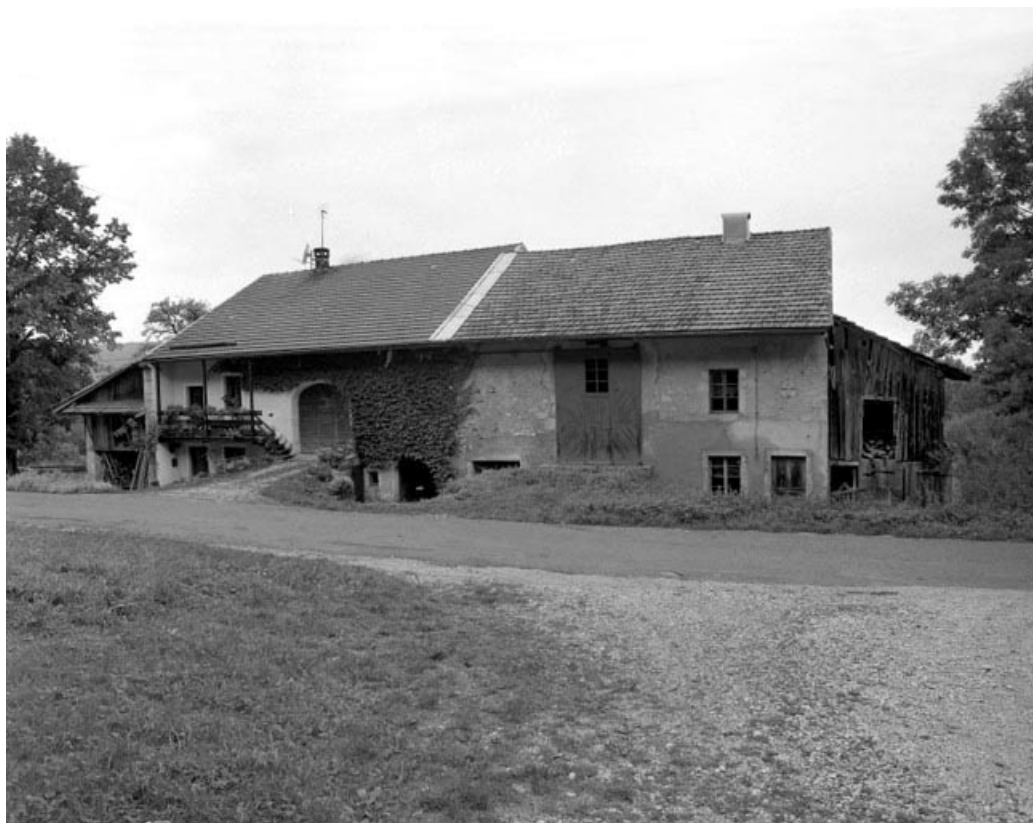
Ferme présentant les accès au logis, à l'étable et à la grange haute sur la façade antérieure.