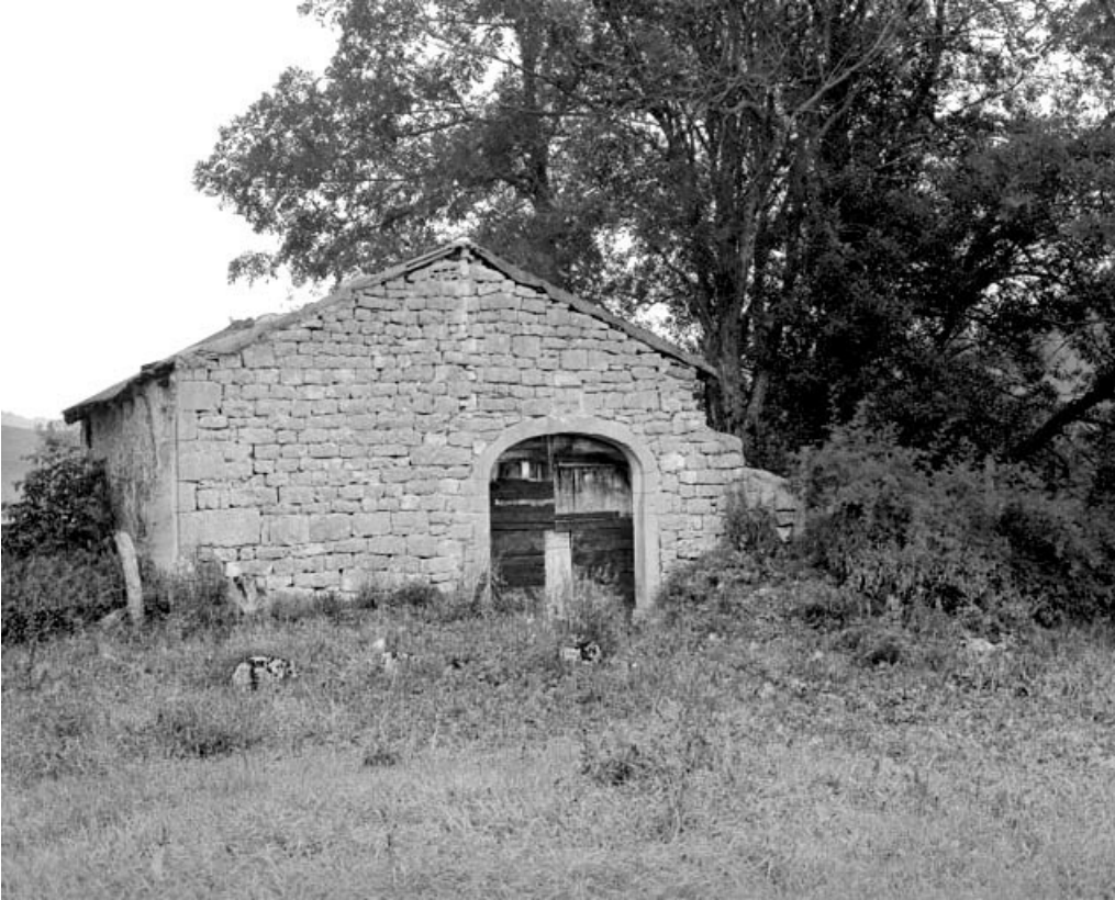
Les Bouchoux, ferme située au lieu-dit La Combe de Léary : pignon d'une ancienne ferme avec appareillage soigné.