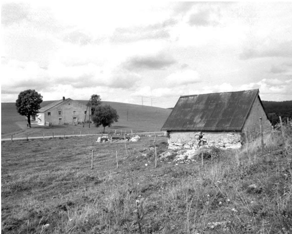
La Pesse, ferme située au lieu-dit Le Pas Rouge : ferme et son grenier fort au premier plan.