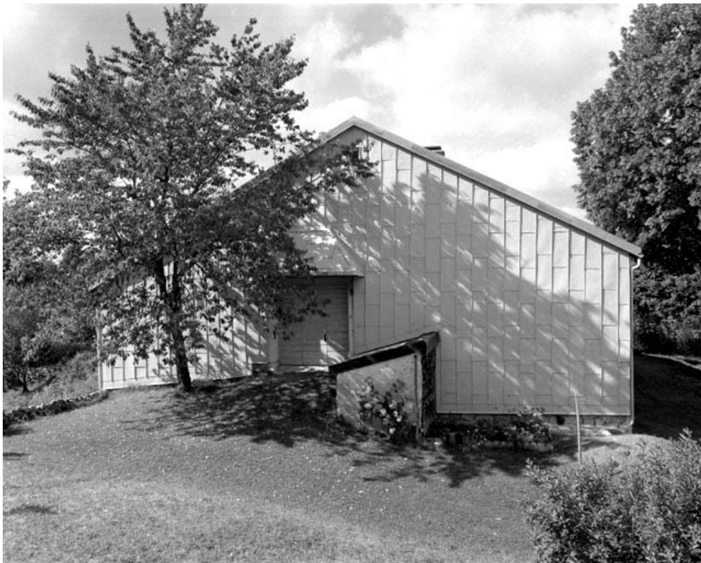
La Pesse, ferme située au lieu-dit Sur les Couronnes : facade gauche recouverte d'un essentage de zinc.