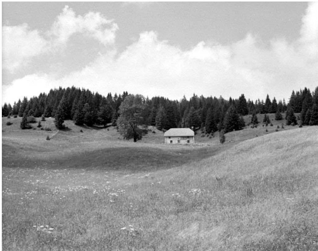
Bellecombe, ferme de la Tissote : vue dans le paysage d'une ferme des hauts plateaux.