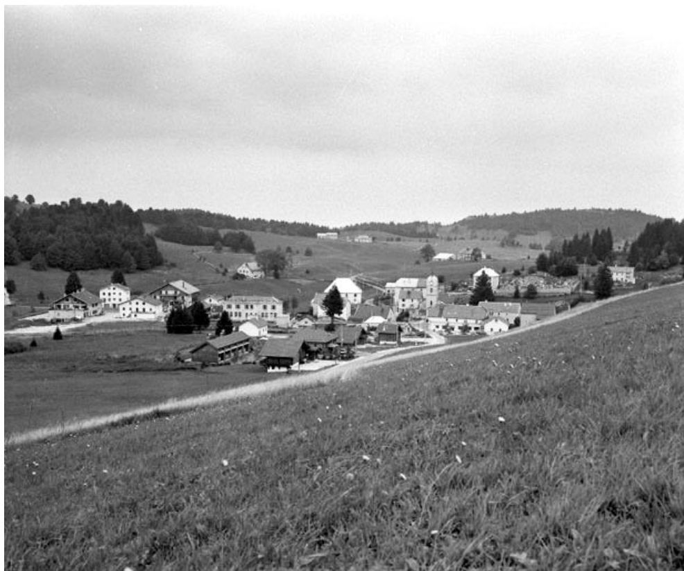
Vue générale du village de la Pesse.