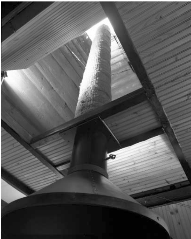
Les Moussières, ferme : intérieur du conduit de la cheminée en bois, un nouveau conduit isolé a été ajouté pour la cheminée actuelle.