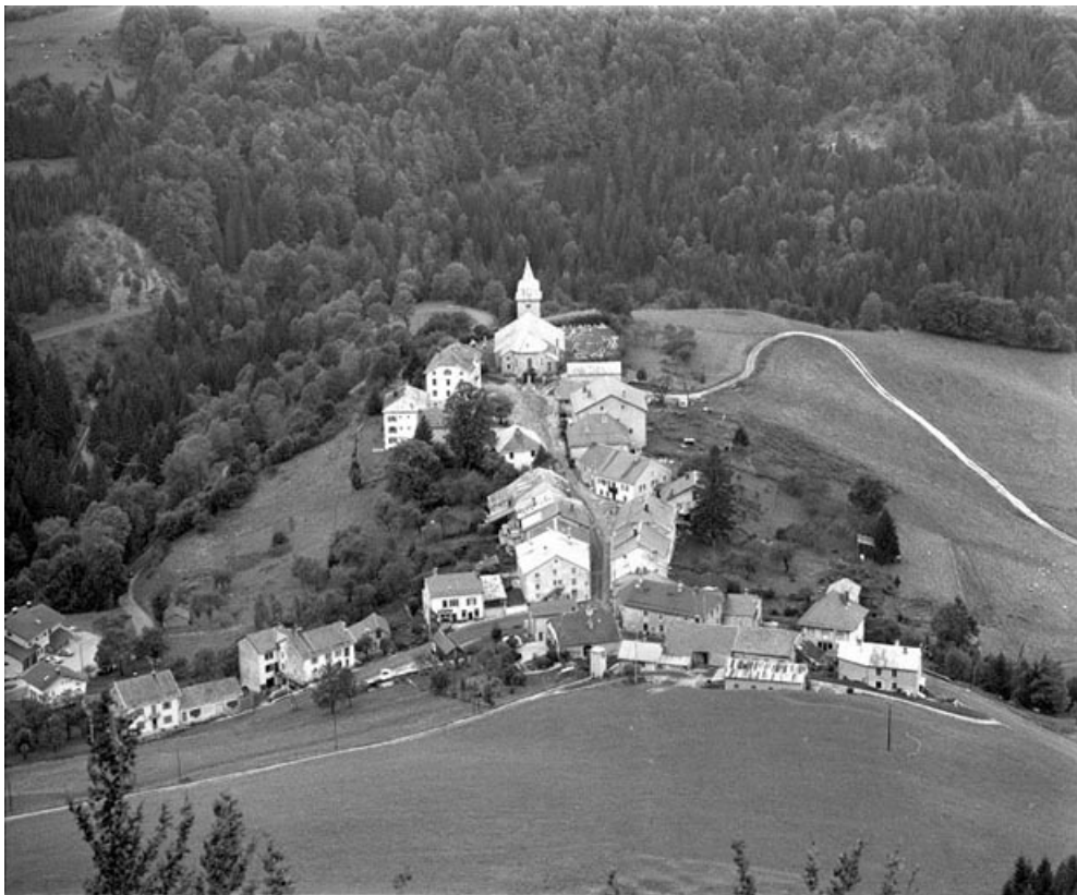
Le village des Bouchoux depuis la croix des Couloirs.