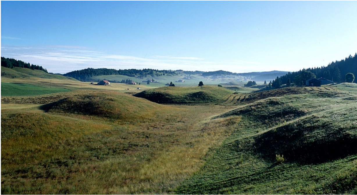
Paysage de combes.