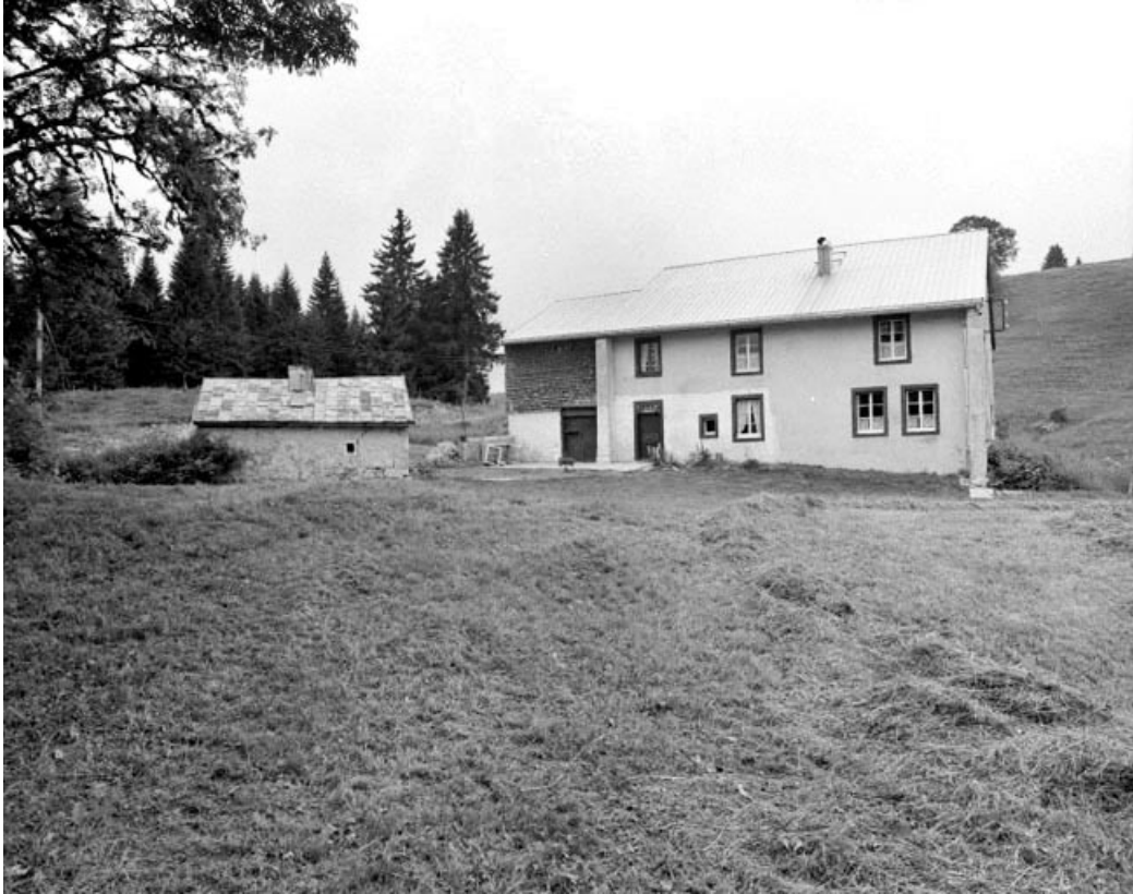
Bellecombe, ferme située au lieu-dit Les Grosses Coupes : ferme à coches symétriques et fournil, façade antérieure.