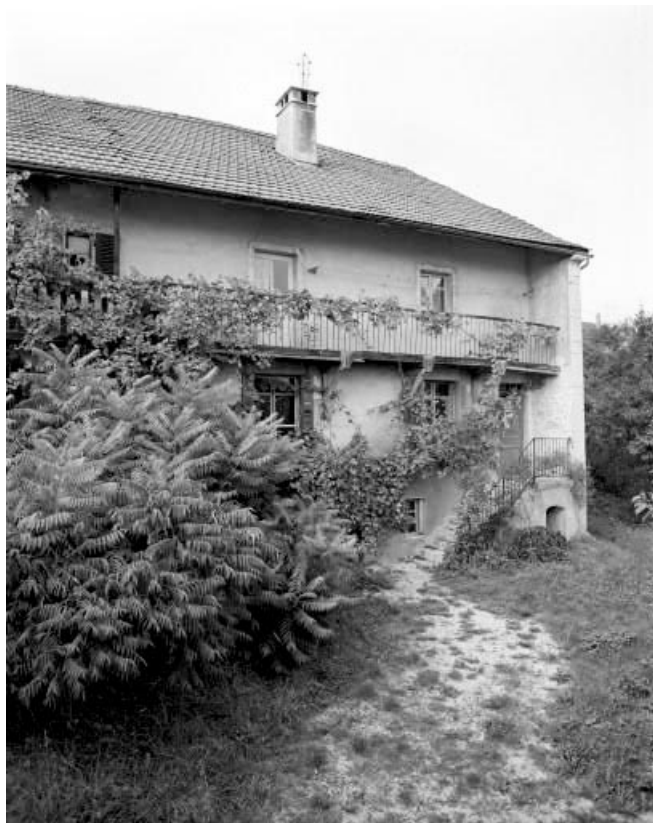
Rogna, ferme avec balcon entre coches.