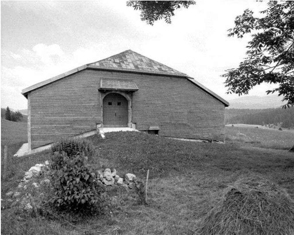
Bellecombe, ferme : pignon avec essentage de tavaillons et grange haute.