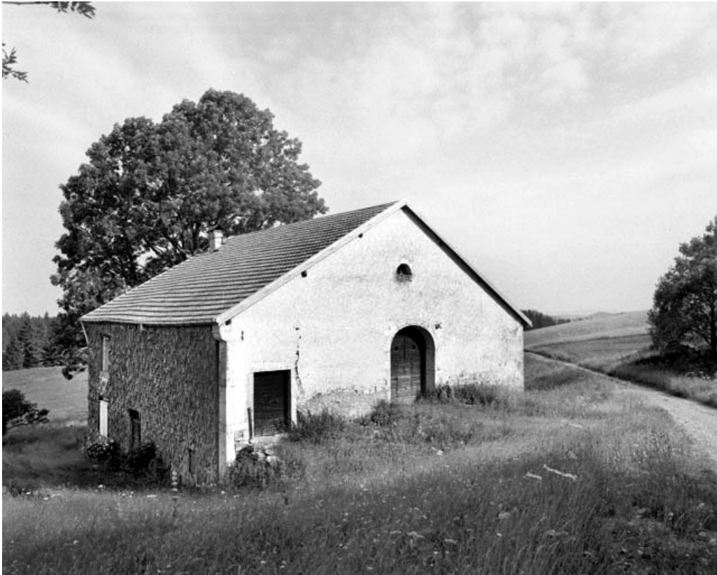
La Pesse, ferme située au lieu-dit Le Reculet : accès à la grange haute par le terrain naturel.