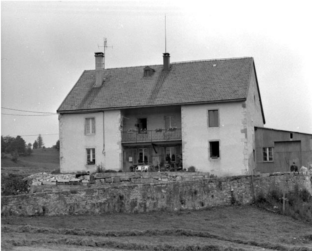
Bellecombe, ferme située au lieu-dit Le Cernois : façade antérieure d'une ferme à galerie centrale.