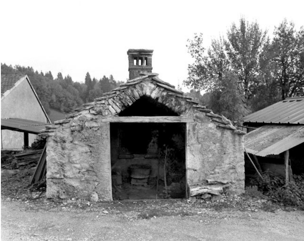
Viry, ferme située au lieu-dit Sièges : façade antérieure du fournil.