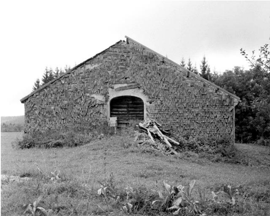
Les Bouchoux, ferme située au lieu-dit Sur Beau Regard : face gauche d'une ferme couverte d'un essentage de tavaillons.