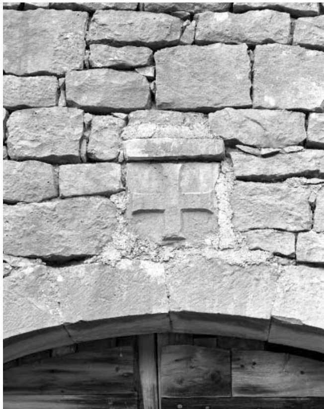
Les Bouchoux, ferme située au lieu-dit La Combe de Léary : écusson situé au-dessus de la porte cochère.