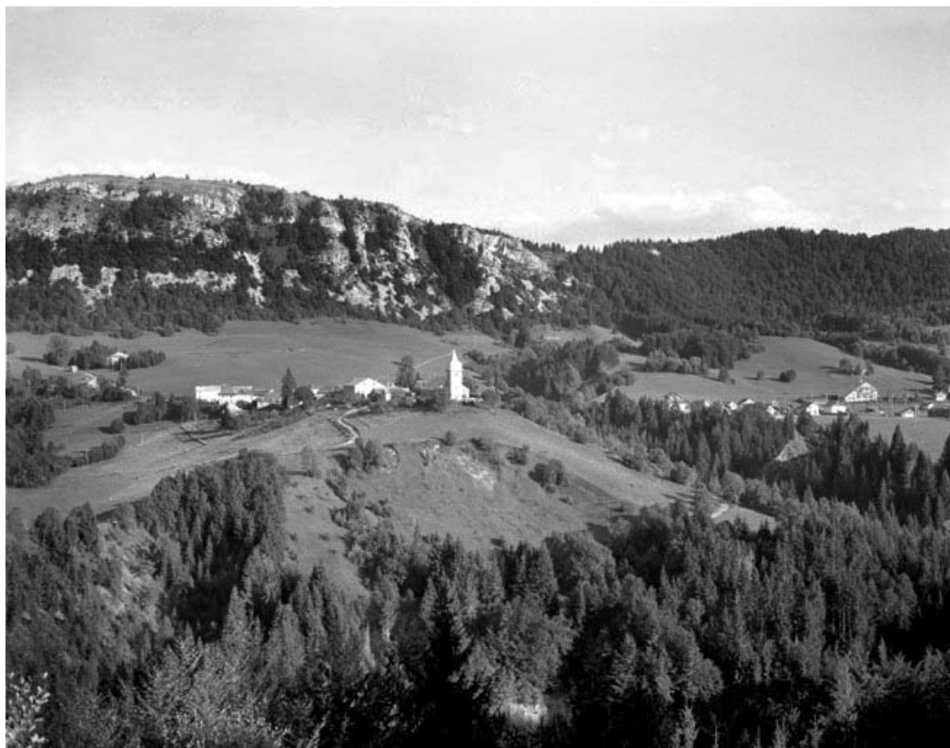
Le village des Bouchoux.