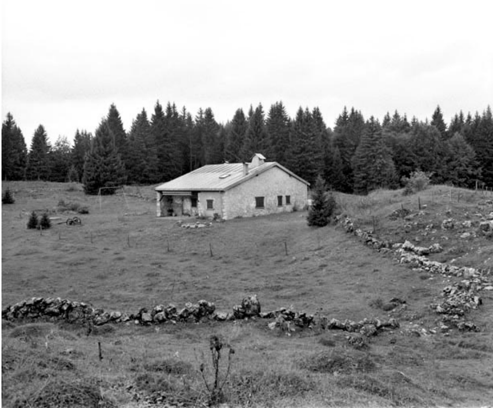
Les Moussières, ferme située au lieu-dit Montechoux : ferme appelée «loge», vue d'ensemble.