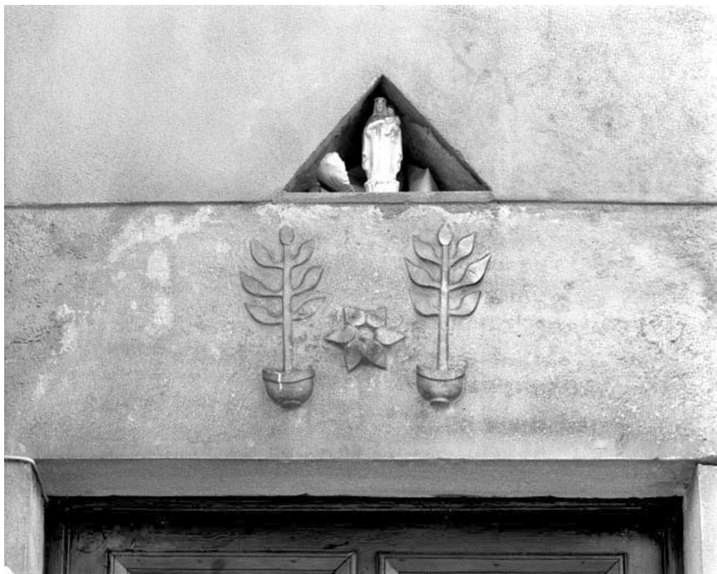
Viry, ferme : linteau décoré.