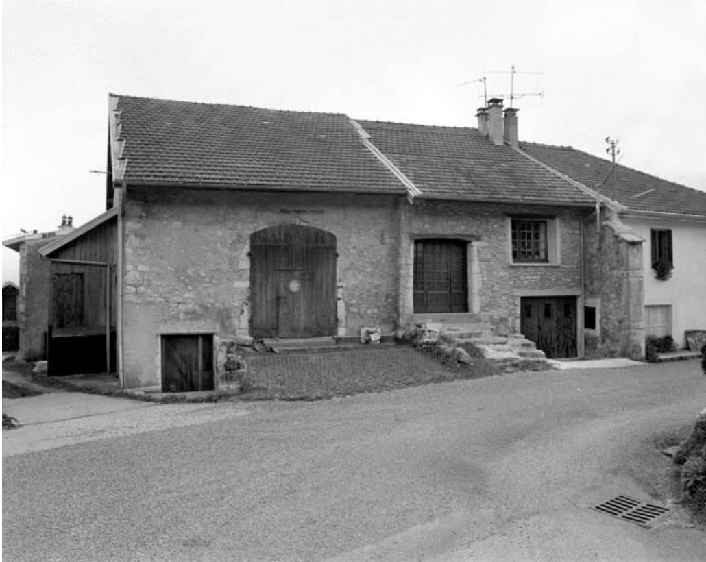
Rogna, ferme : accès à l'étable et à la grange sur la façade postérieure.