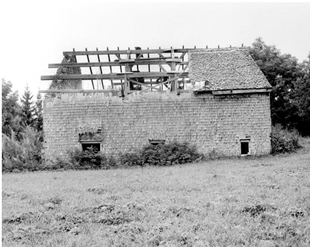
Les Bouchoux, ferme : vestiges de couverture en tavillons.