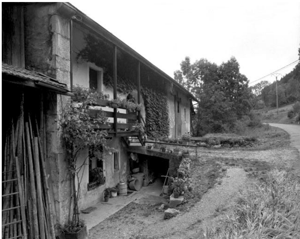
Larrivoire, ferme située au lieu-dit Samiat : pont de grange.