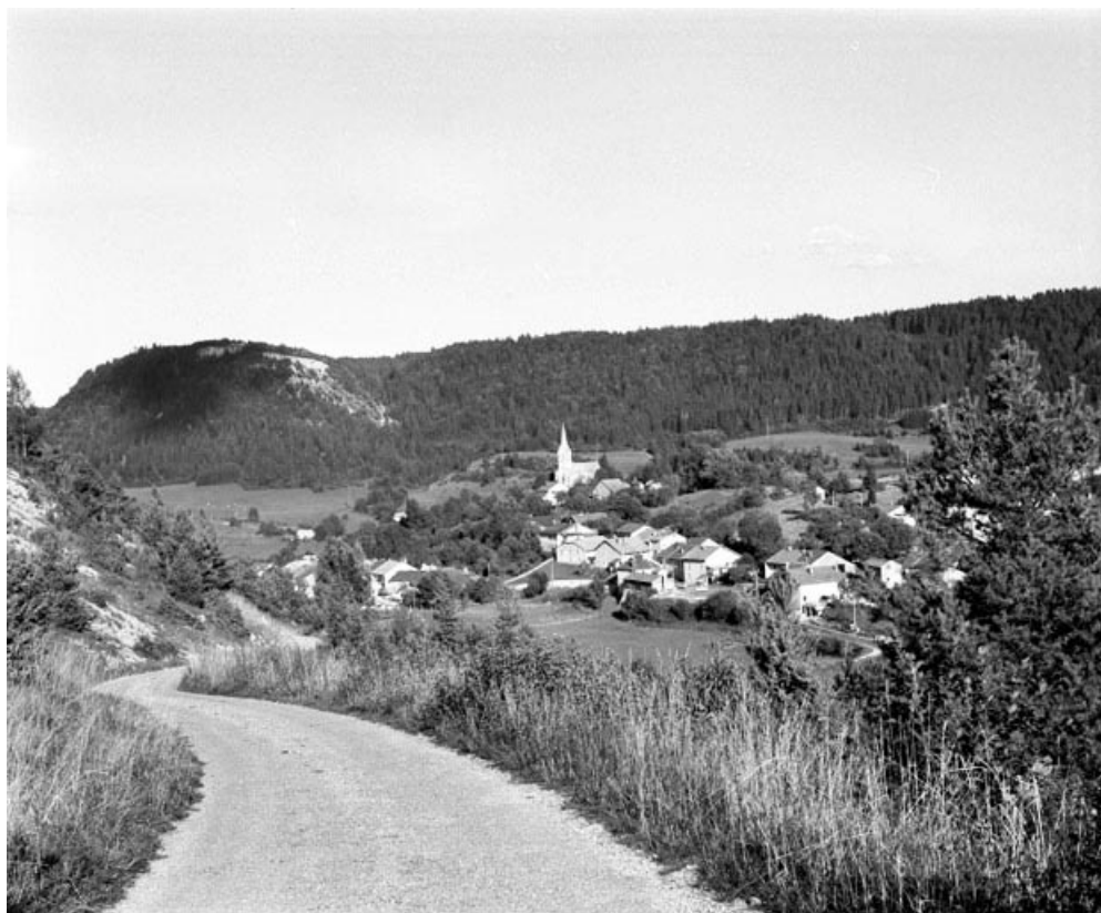
Vue générale du village de Choux.