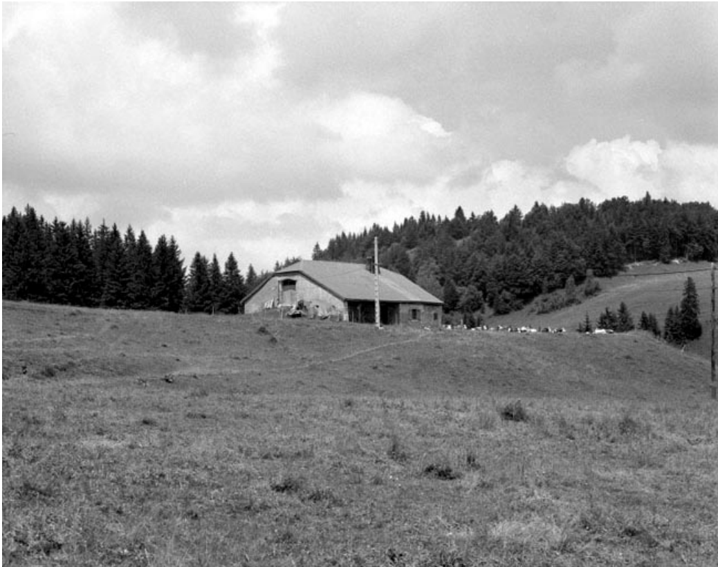
Bellecombe, ferme de la Lugonne : vue générale d'une ferme en rez-de-chaussée.