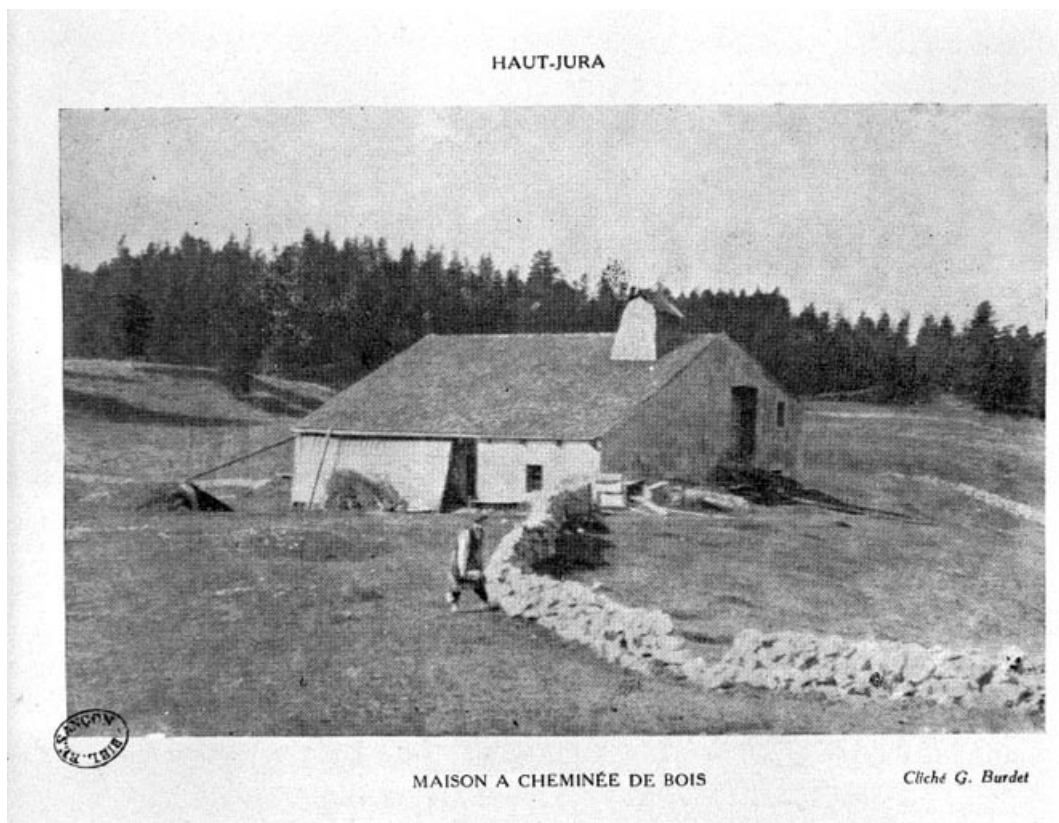
Les Bouchoux : maison à cheminée en bois.

Photographie, s.d. [1925]. - Dans : " Un coin du Haut-Jura : les Bouchoux, la Pesse " / Gustave Burdet, Morez : impr. A. Roussel, 1925.