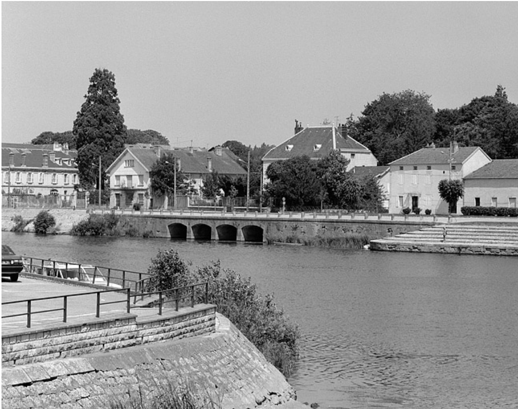
Vue d'ensemble éloignée de trois quarts droit.