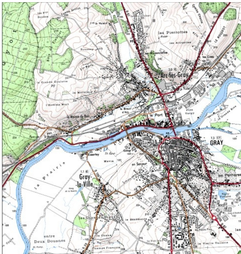
Carte de localisation. Carte topographique au 1:25000, I.G.N., Gray, 3222 E. SCAN 25 70, Gray, 12 quai Villeneuve