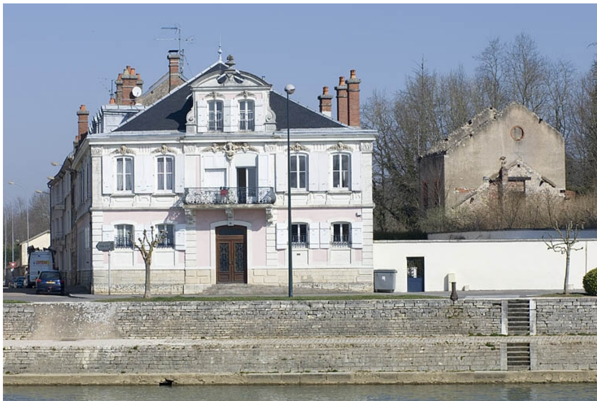
Vue d'ensemble depuis la rive gauche de la Saône.