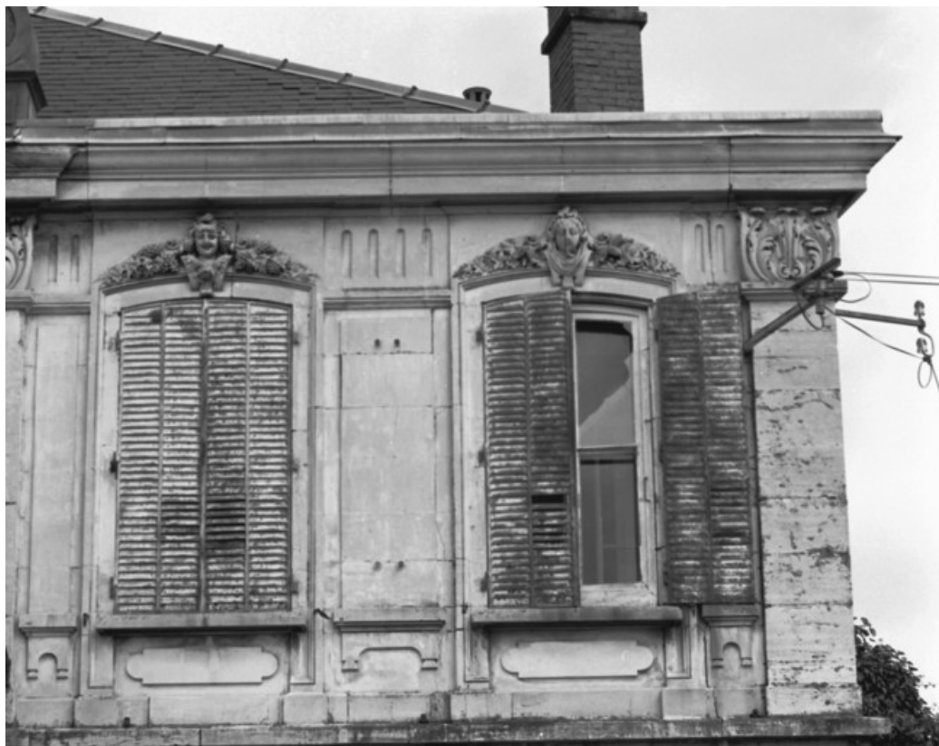
Façade antérieure de l'habitation. Détail des baies droites de l'étage en 1988. 70, Gray, 12 quai Villeneuve