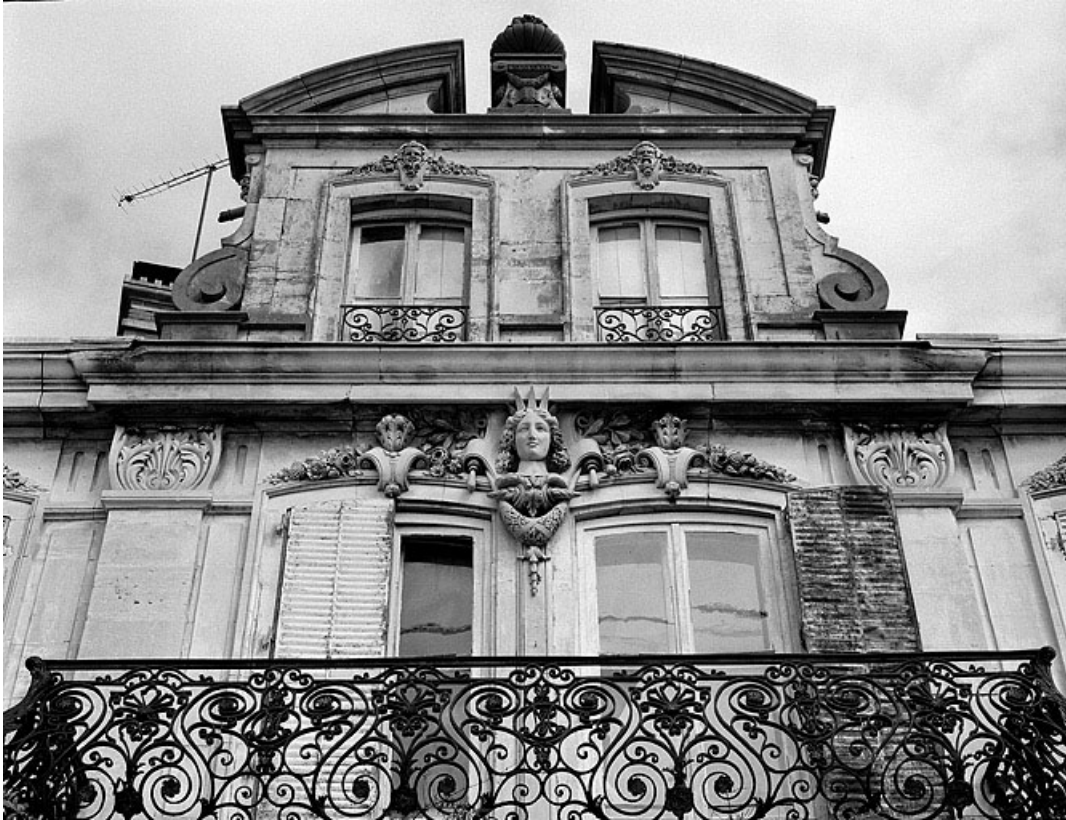
Façade antérieure de l'habitation. Détail du premier étage et du couronnement en 1988. 70, Gray, 12 quai Villeneuve