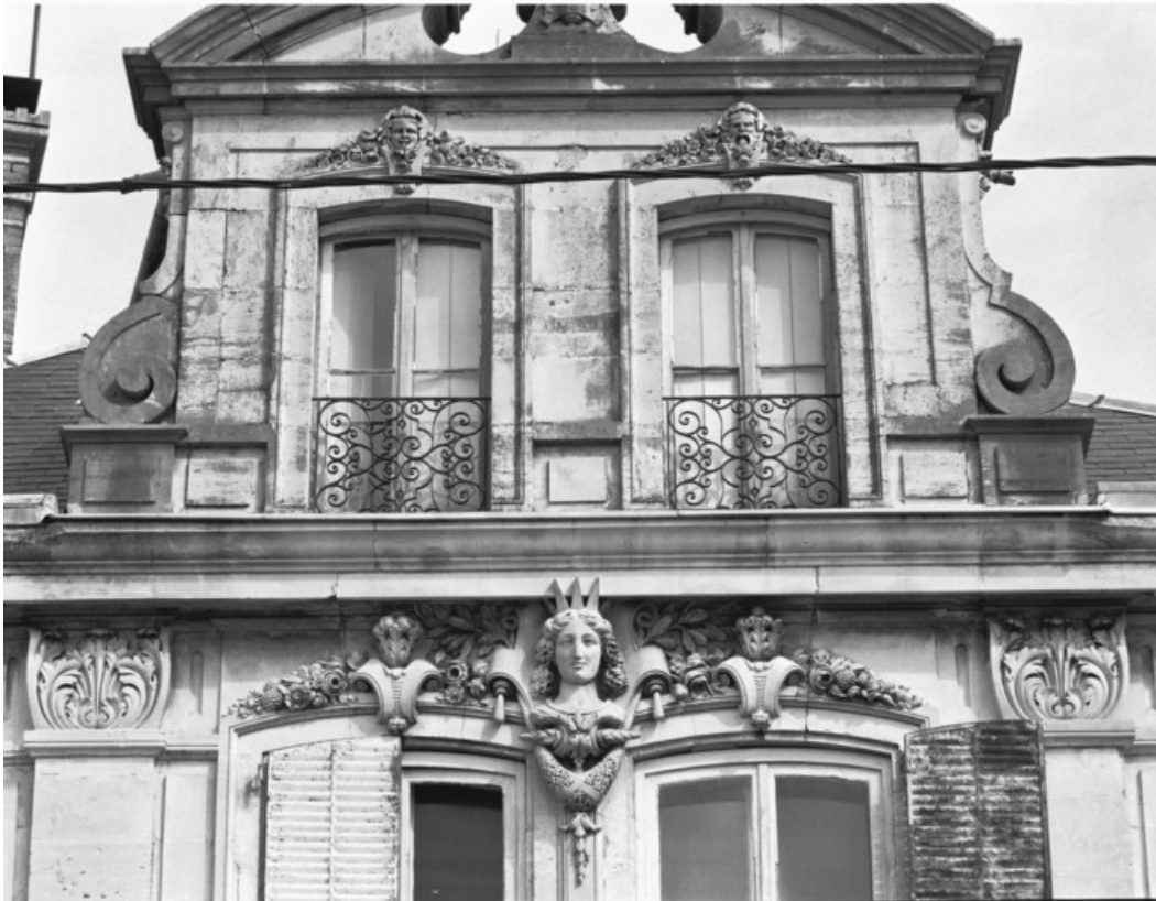
Façade antérieure de l'habitation. Détail du couronnement en 1988.