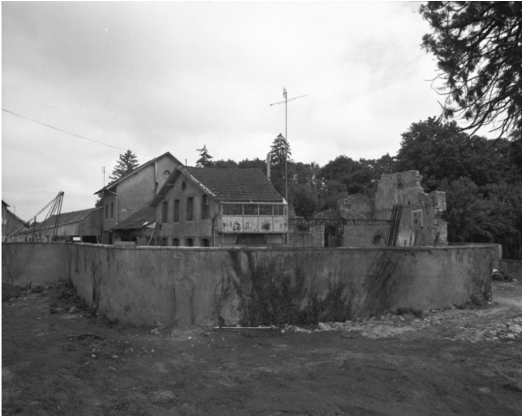
Vestiges de l'atelier de fabrication en 1988.