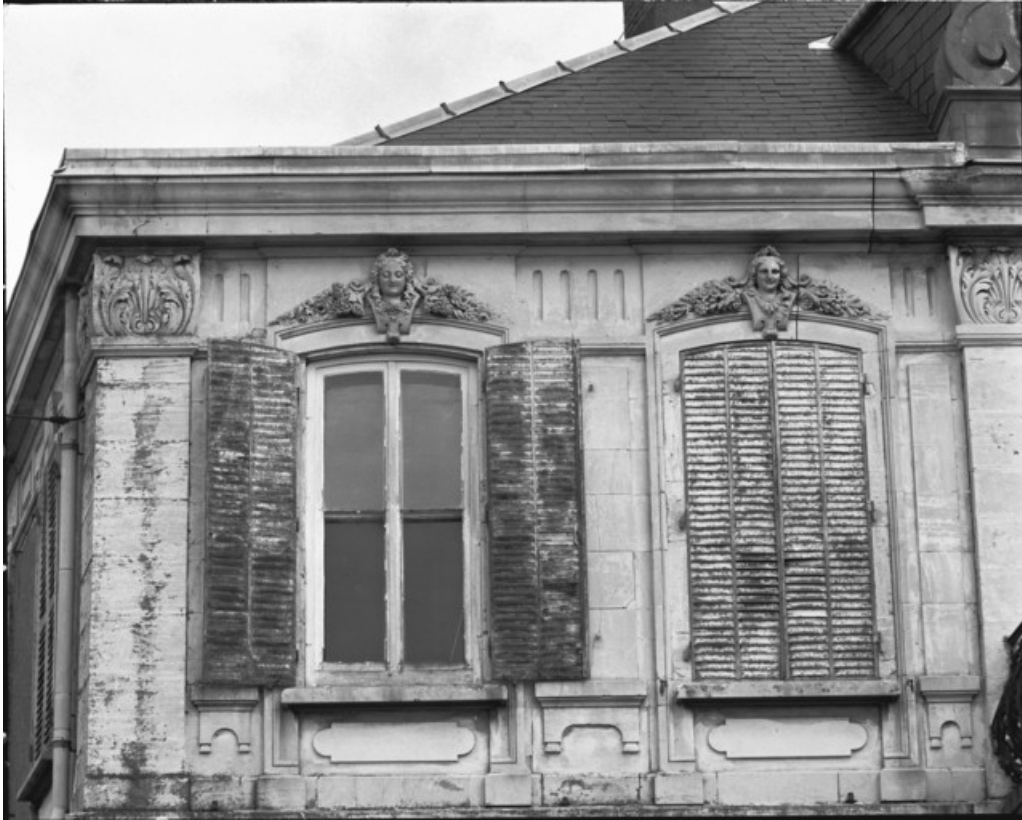
Façade antérieure de l'habitation. Détail des baies gauches de l'étage en 1988.