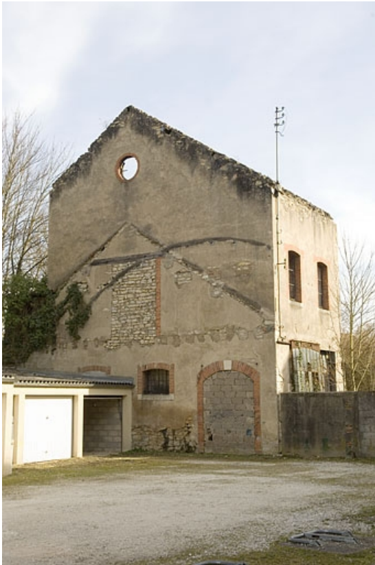
Vestiges de l'atelier de fabrication.