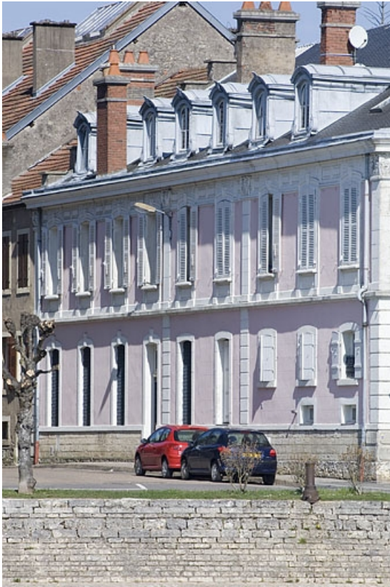
Façade ouest du logement patronal.