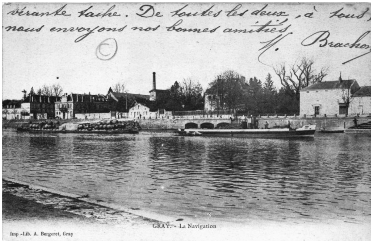
Gray.- La navigation [le quai Villeneuve depuis le quai Mavia].