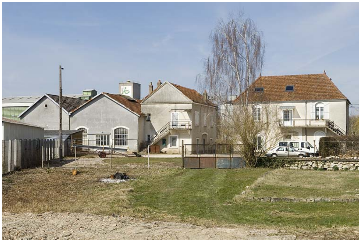
Vue rapprochée depuis le sud.