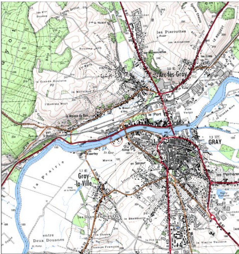
Carte de localisation. Carte topographique au 1:25000, I.G.N., Gray, 3222 E. SCAN 25, Licence n°2008CISE29-68. 70, Gray, 29 quai Mavia