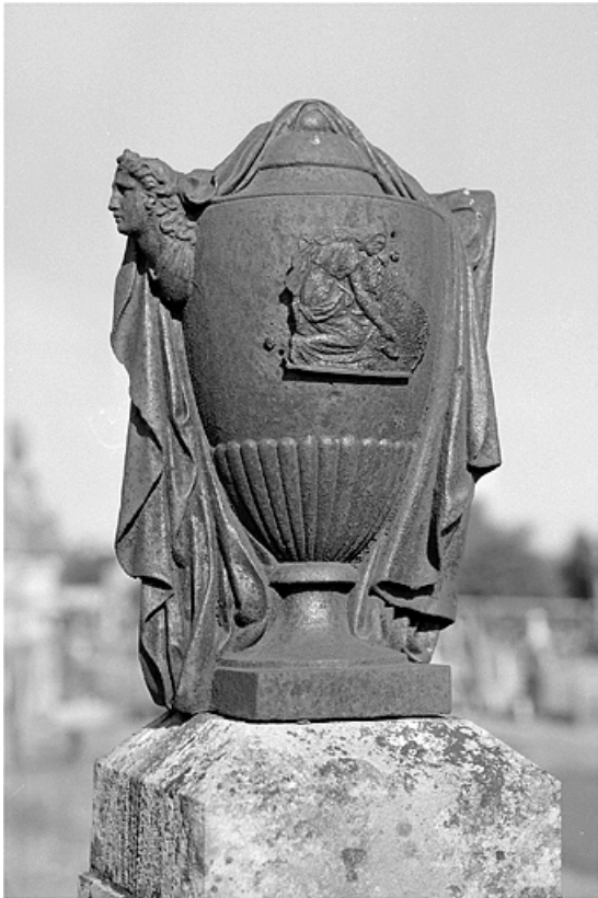
Tombeau de Stéphane-Eugène Roland, maître de forges : détail de l'urne voilée. 70, Gray avenue Jean Jaurès