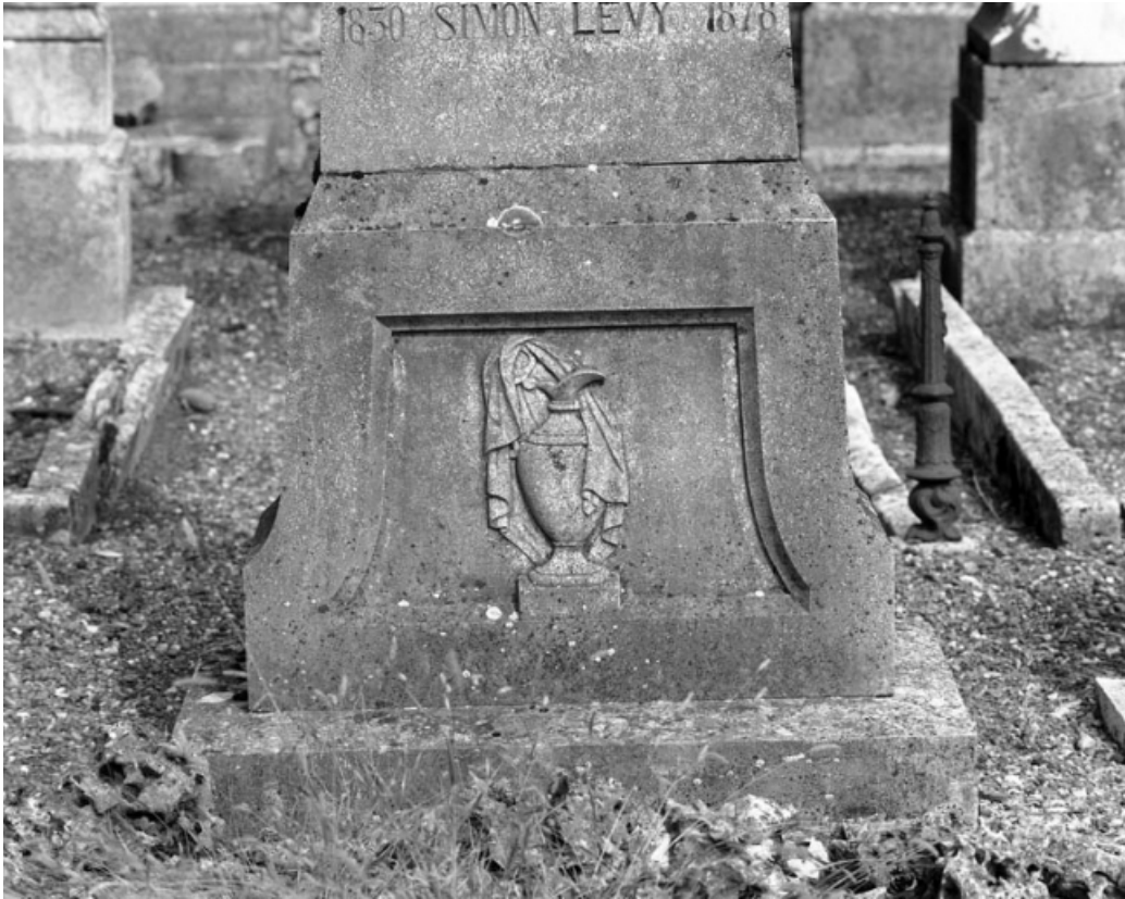
Détail de la base de la stèle.