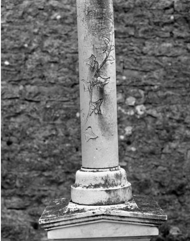
Détail de la base de la colonne brisée.