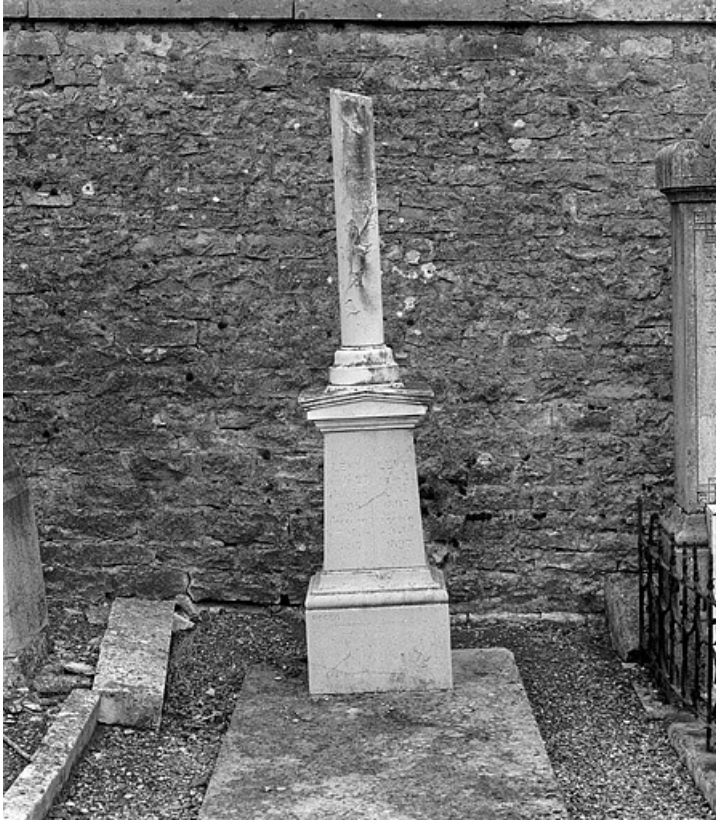
Vue d'ensemble, de face.