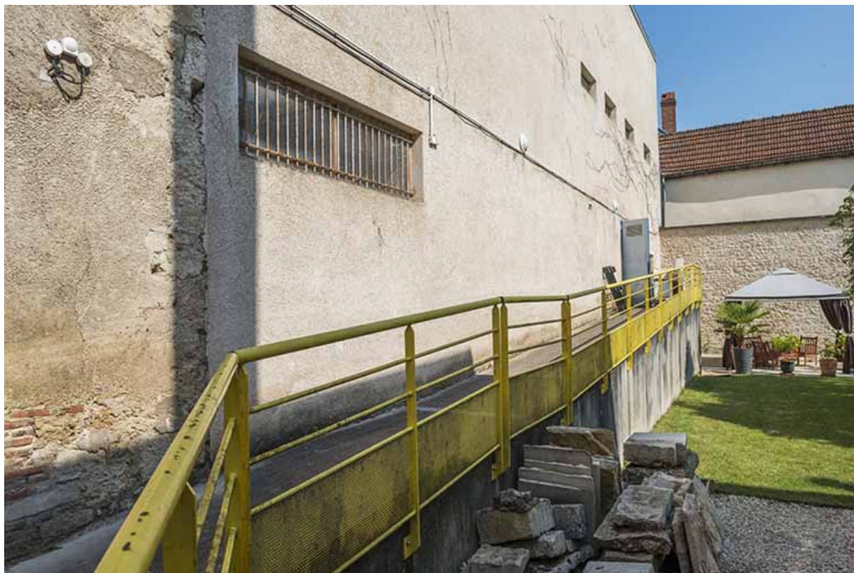
Façade est et organe de circulation extérieure de la cantine.