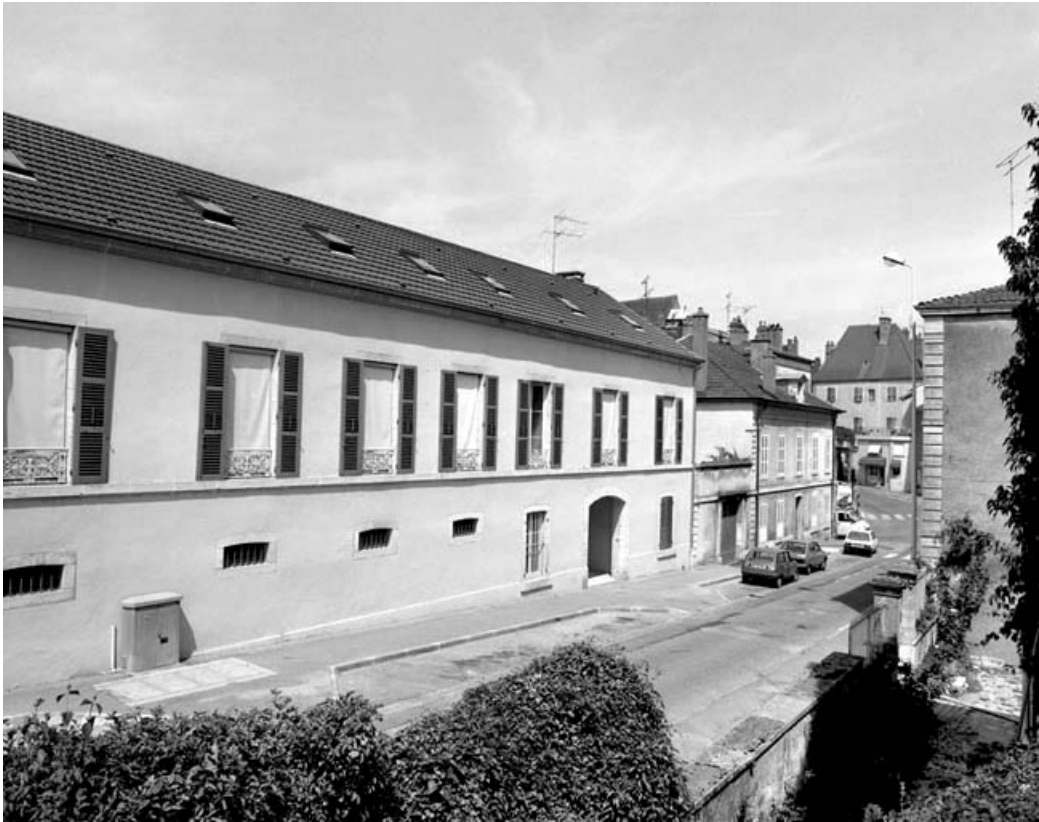
Façade antérieure de trois quarts gauche.