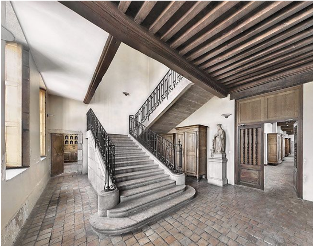
Escalier de l'aile gauche.

21, Seurre, 14 Grande rue du Faubourg-Saint-Georges