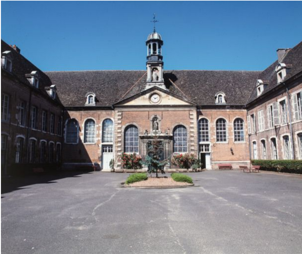
Façade du corps central.

21, Seurre, 14 Grande rue du Faubourg-Saint-Georges