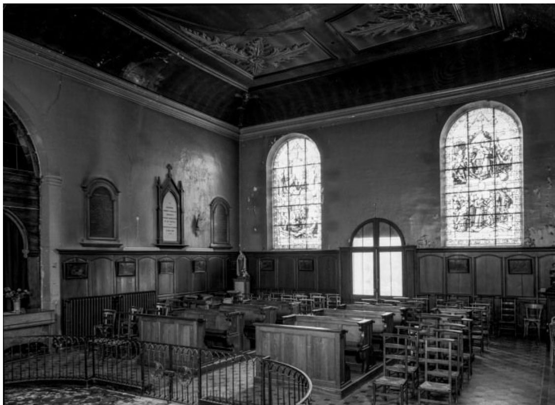
Chapelle, vue prise depuis l'angle postérieur gauche 21, Seurre, 14 Grande rue du Faubourg-Saint-Georges