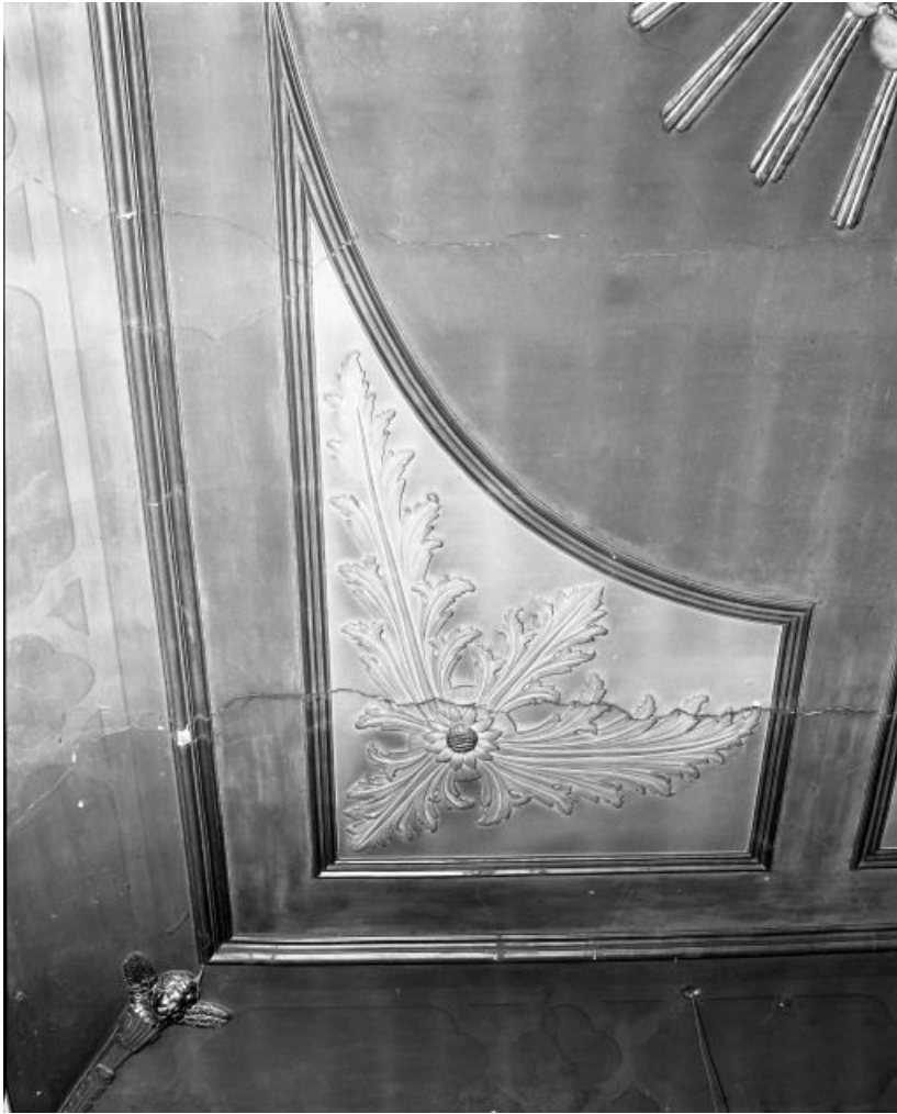
Chapelle, plafond, détail d'un écoinçon

21, Seurre, 14 Grande rue du Faubourg-Saint-Georges