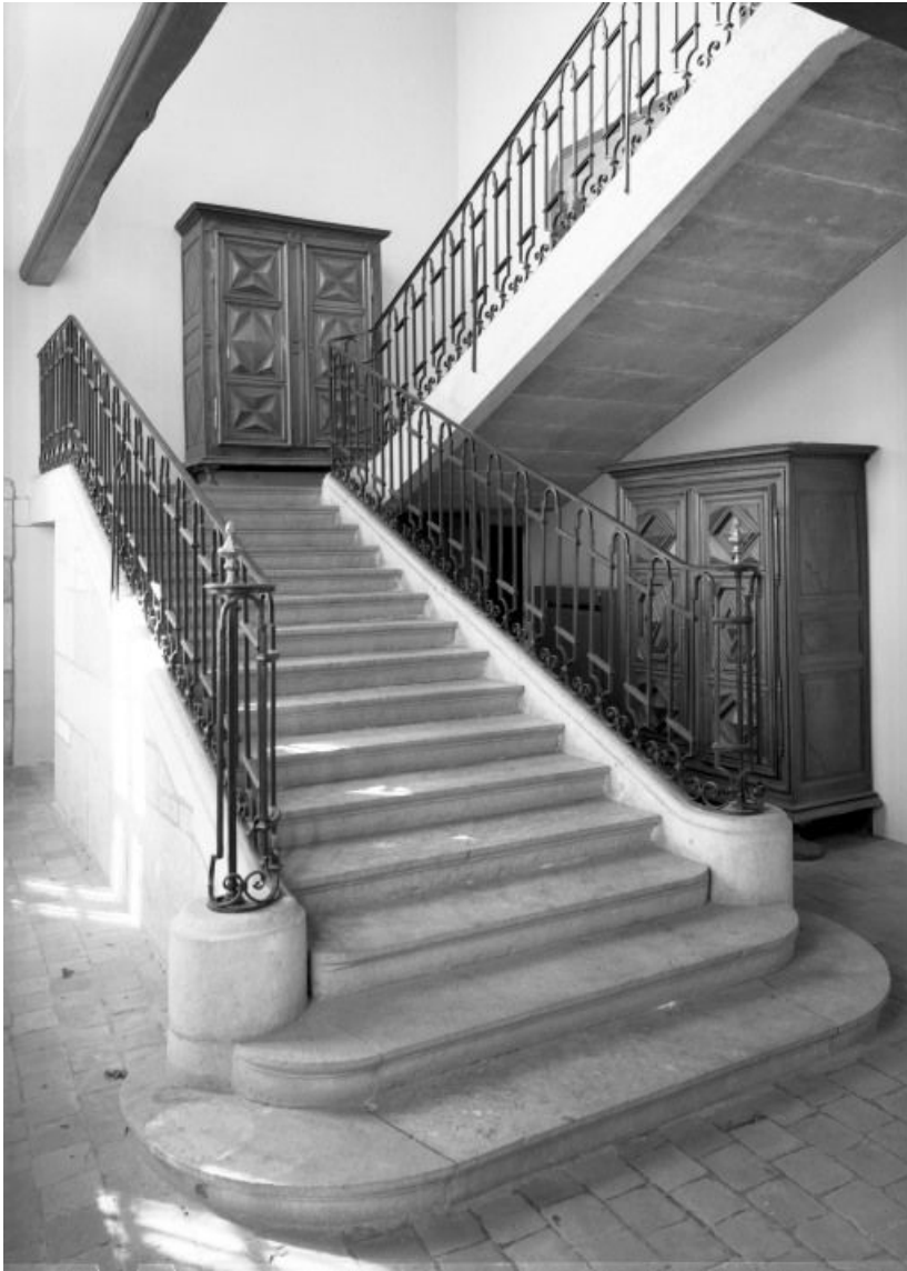
Aile gauche, escalier d'accès à l'étage

21, Seurre, 14 Grande rue du Faubourg-Saint-Georges