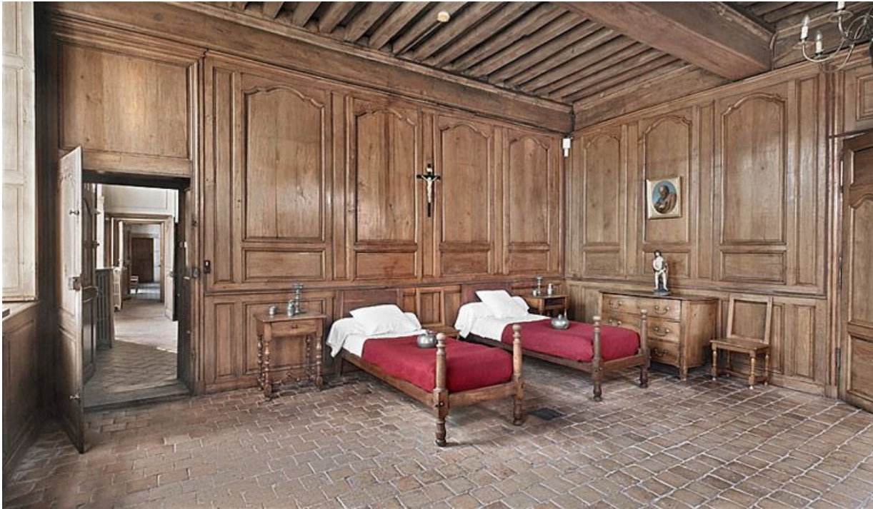
Aile gauche, rez-de-chaussée : infirmerie des soeurs.

21, Seurre, 14 Grande rue du Faubourg-Saint-Georges