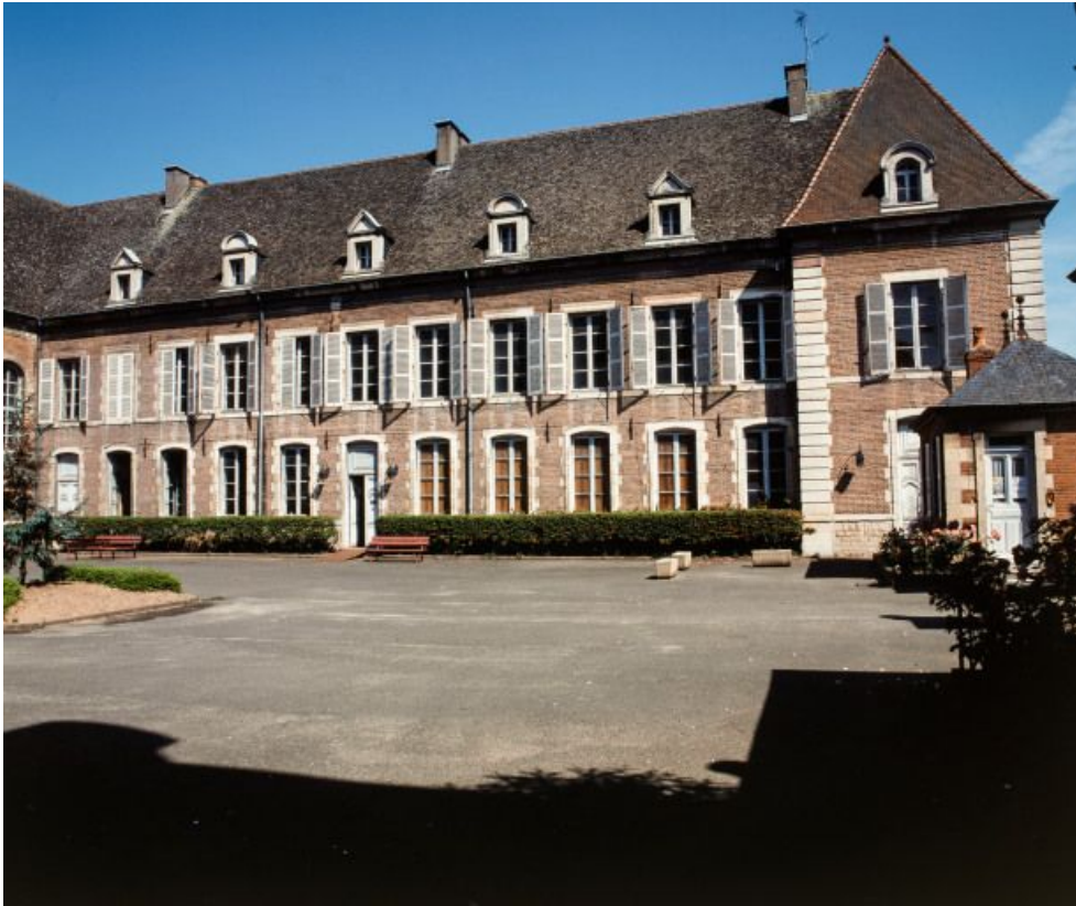
Aile droite, façade antérieure.

21, Seurre, 14 Grande rue du Faubourg-Saint-Georges