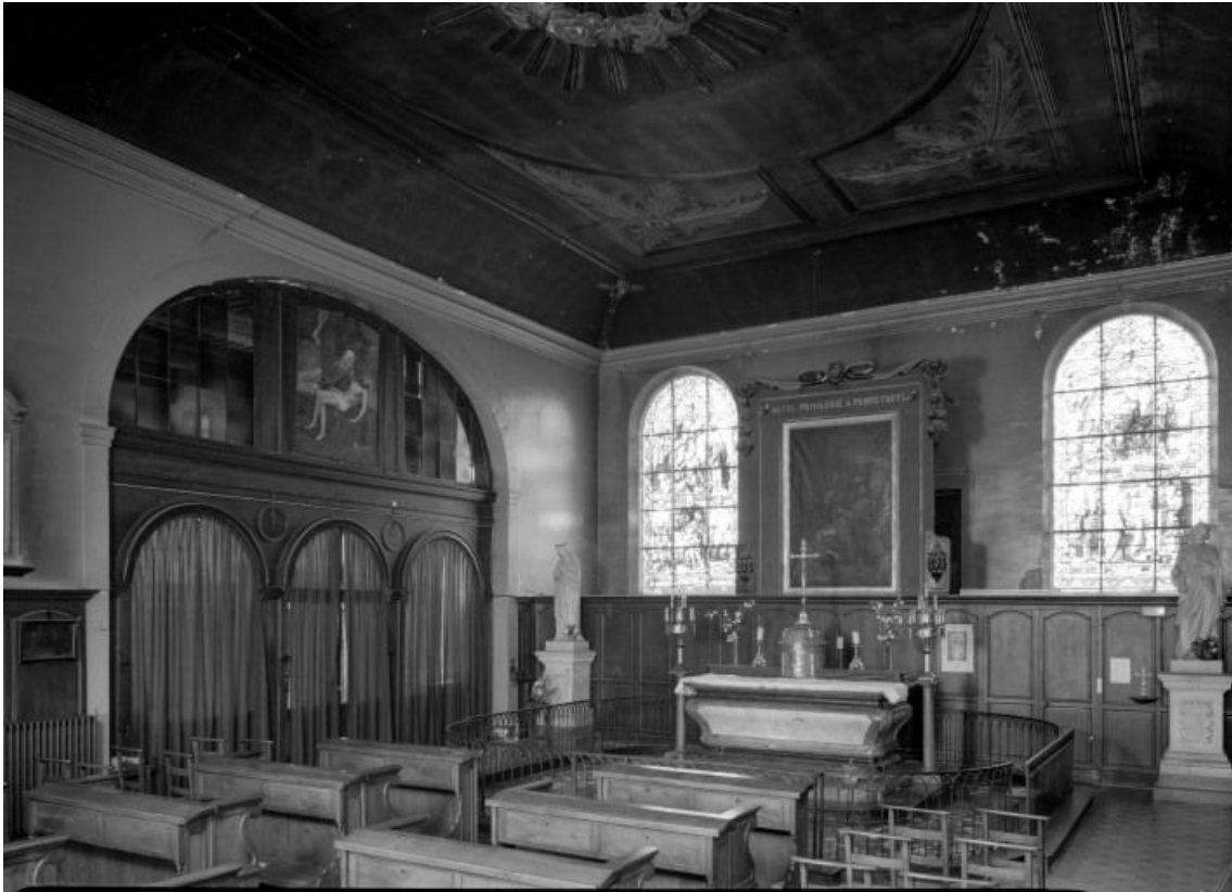
Chapelle, vue prise depuis l'angle antérieur droit

21, Seurre, 14 Grande rue du Faubourg-Saint-Georges