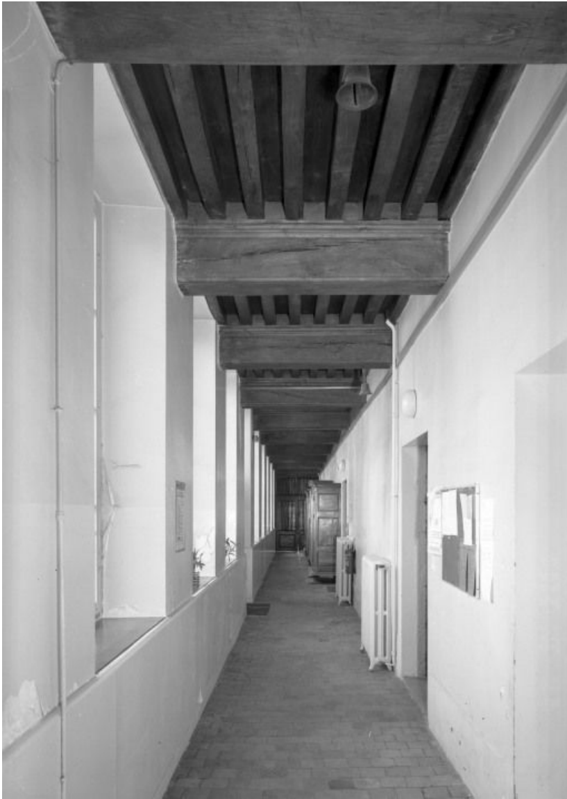
Aile gauche, couloir du rez-de-chaussée, vue prise de l'entrée 21, Seurre, 14 Grande rue du Faubourg-Saint-Georges