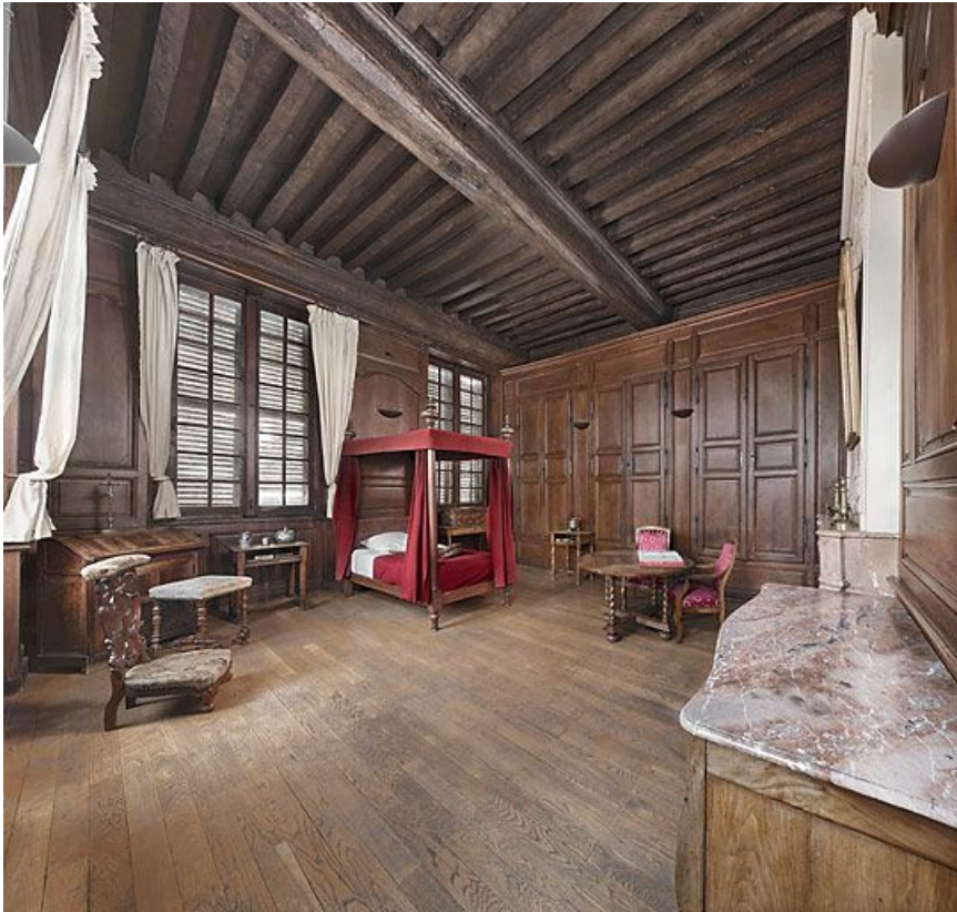
Aile gauche : chambre à l'étage

21, Seurre, 14 Grande rue du Faubourg-Saint-Georges