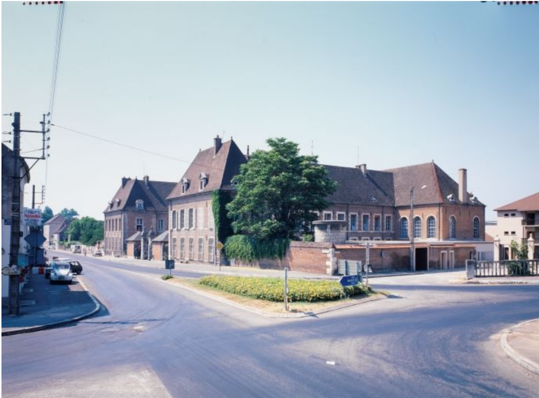
Vue d'ensemble prise du nord-est

21, Seurre, 14 Grande rue du Faubourg-Saint-Georges