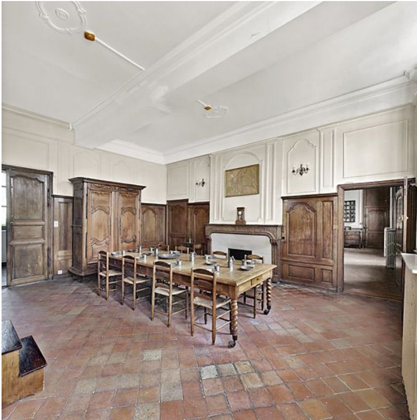
Réfectoire des sœurs.

21, Seurre, 14 Grande rue du Faubourg-Saint-Georges