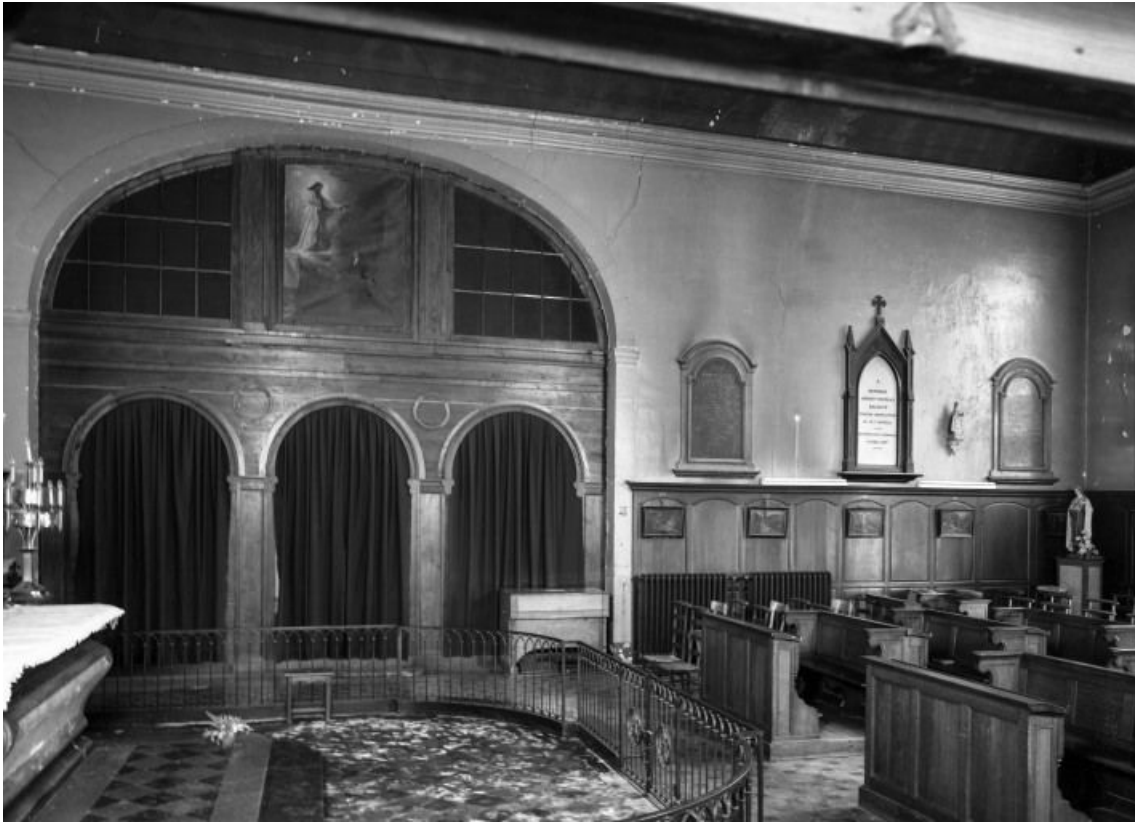
Chapelle, mur droit

21, Seurre, 14 Grande rue du Faubourg-Saint-Georges