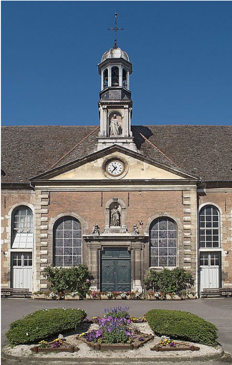
Façade de la chapelle.

21, Seurre, 14 Grande rue du Faubourg-Saint-Georges