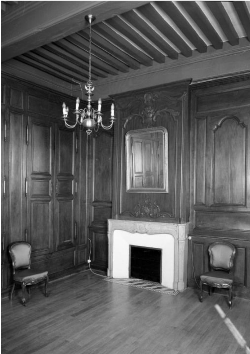
Aile gauche, étage, salle de repos

21, Seurre, 14 Grande rue du Faubourg-Saint-Georges