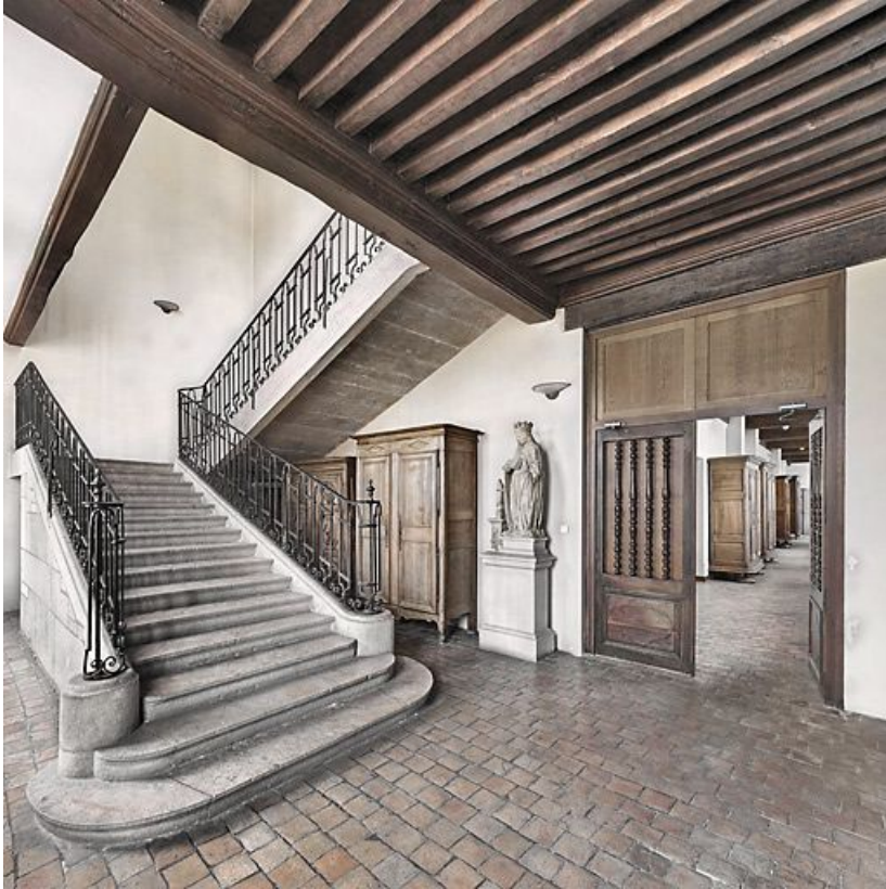
Escalier de l'aile gauche.

21, Seurre, 14 Grande rue du Faubourg-Saint-Georges