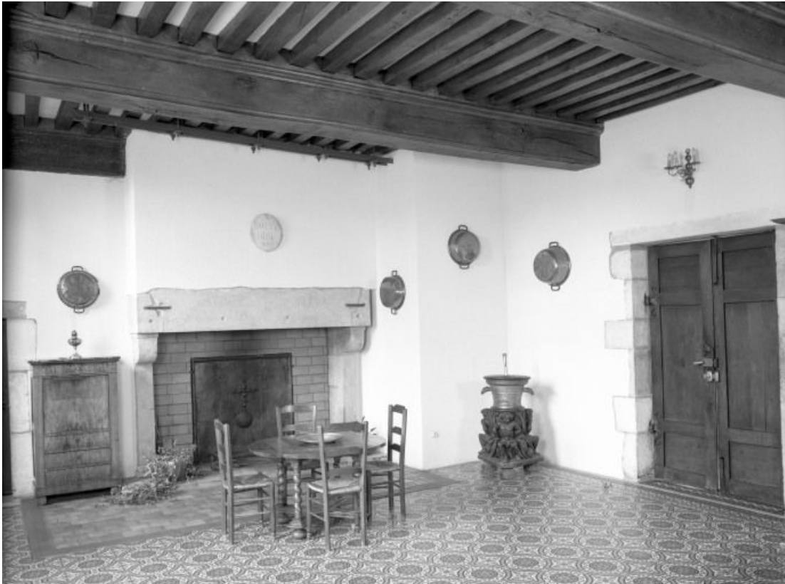
Aile gauche, rez-de-chaussée, salle du mortier, vue prise de l'angle antérieur gauche 21, Seurre, 14 Grande rue du Faubourg-Saint-Georges