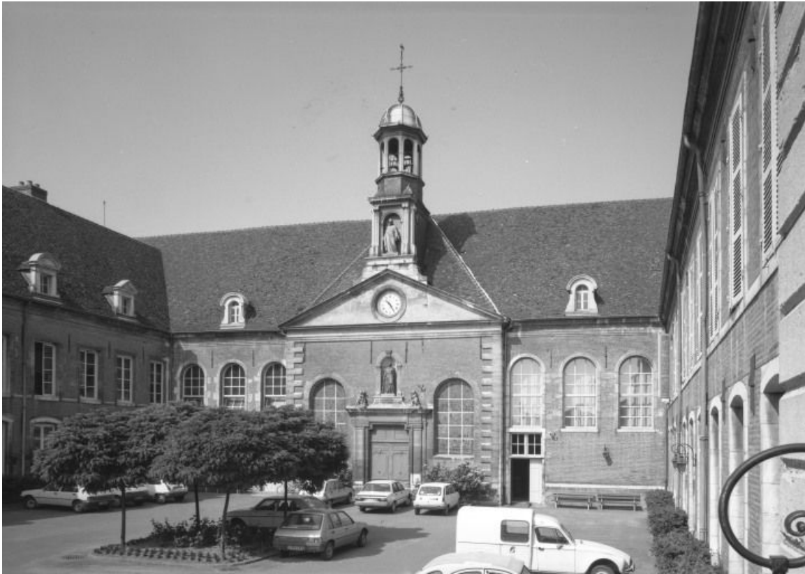
Aile ouest vue depuis la cour

21, Seurre, 14 Grande rue du Faubourg-Saint-Georges