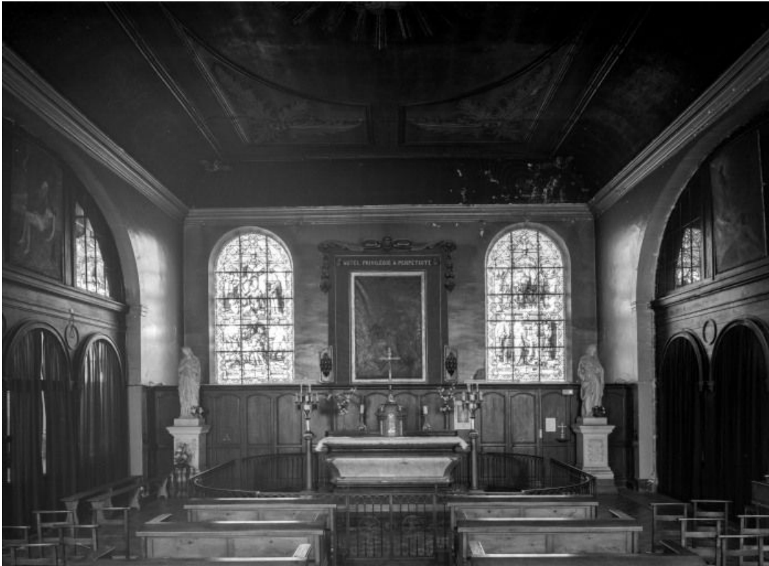
Chapelle, vue prise depuis l'entrée.

21, Seurre, 14 Grande rue du Faubourg-Saint-Georges