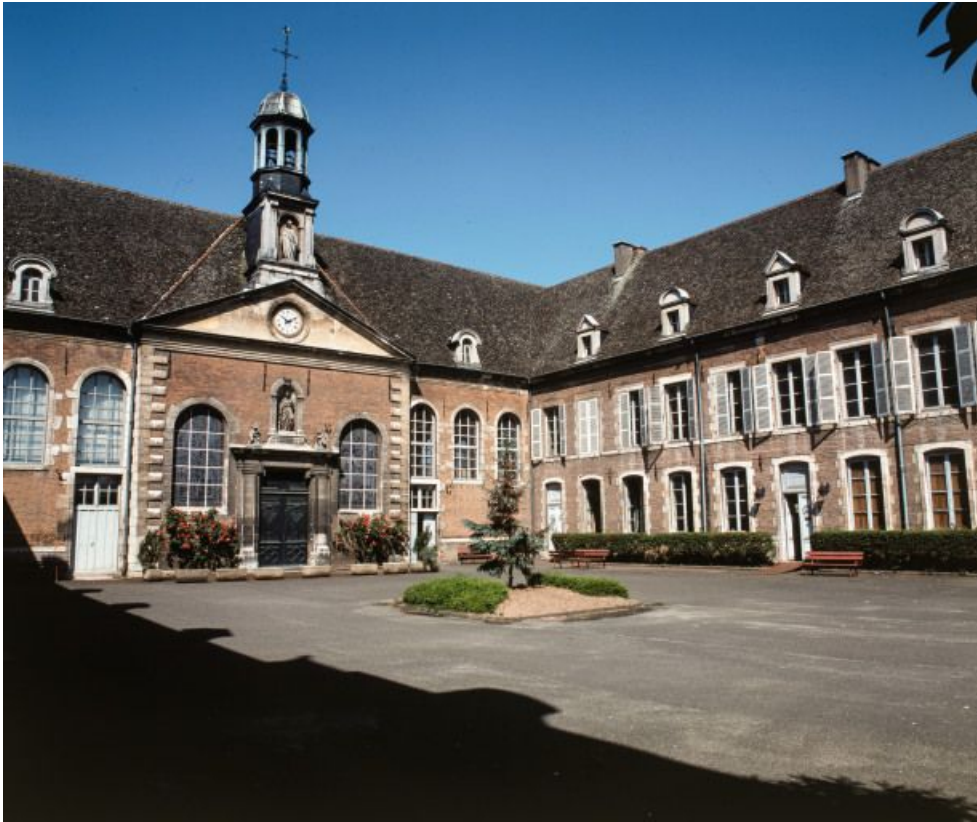
Corps central et aile droite.

21, Seurre, 14 Grande rue du Faubourg-Saint-Georges