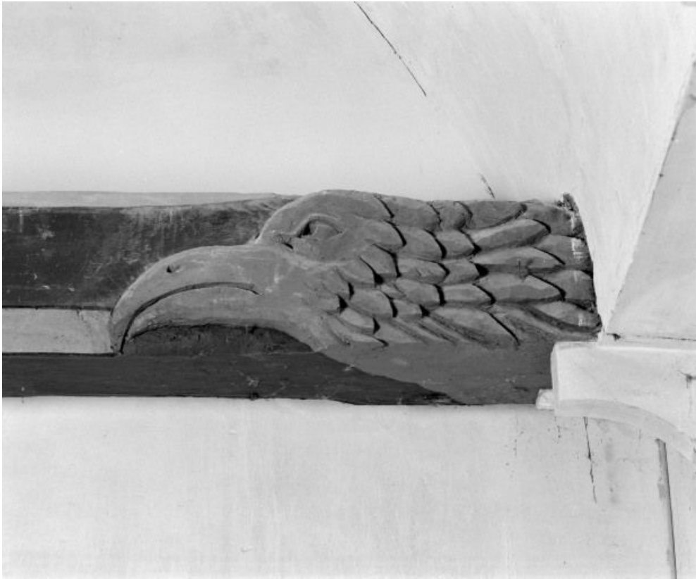
Charpente de la nef, détail du 1er entrain 21, Bagnot