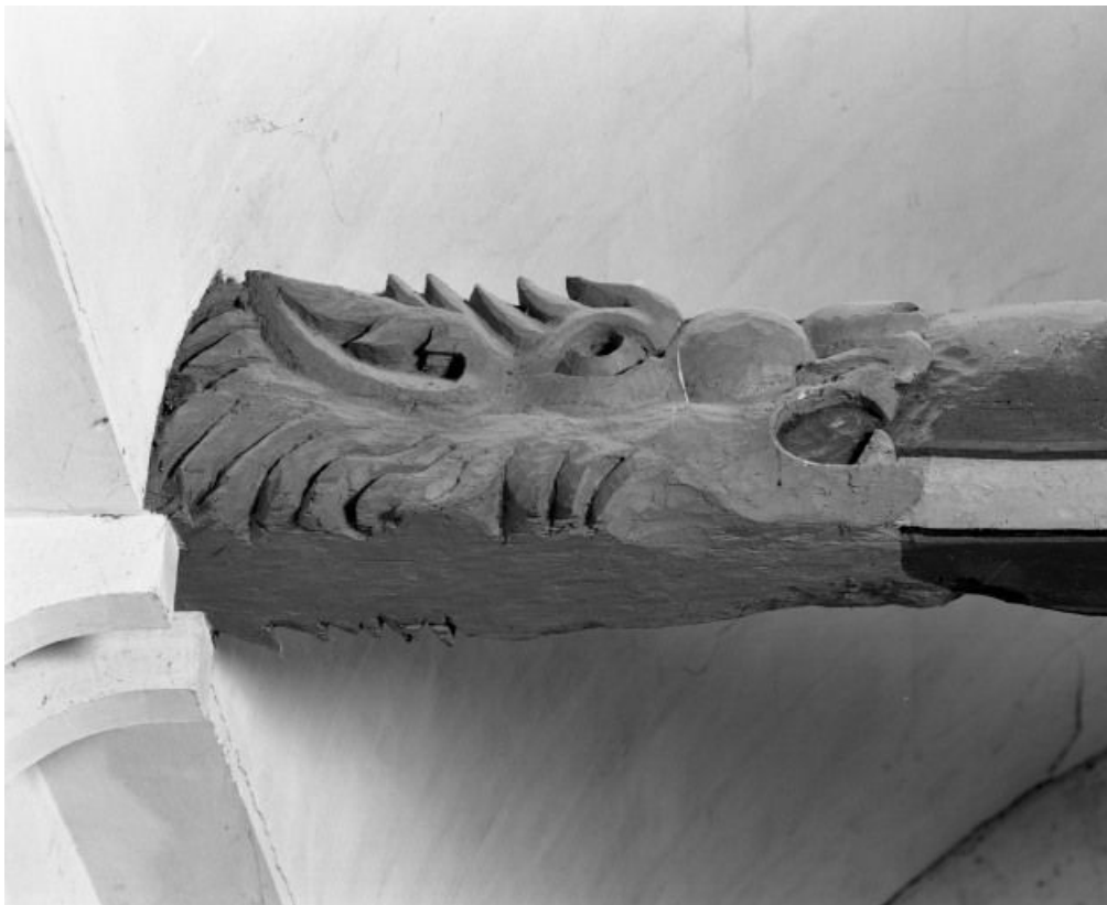
Charpente de la nef, détail du 4e entrain, avers 21, Bagnot