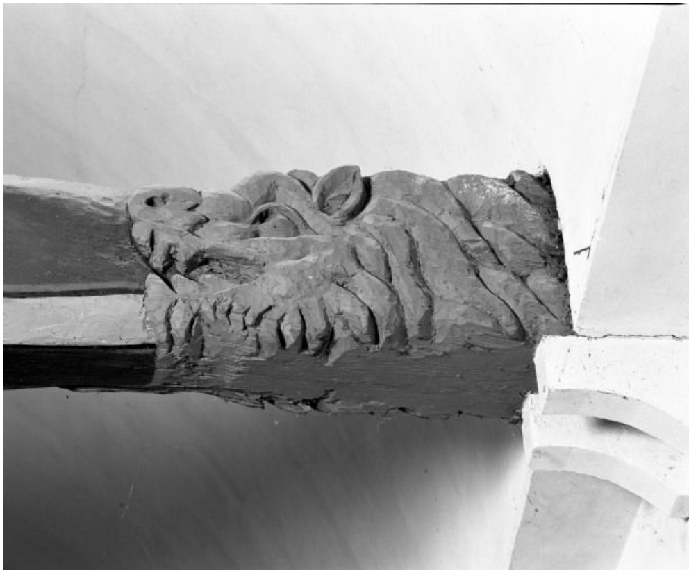
Charpente de la nef, détail du 3e entrain, revers 21, Bagnot