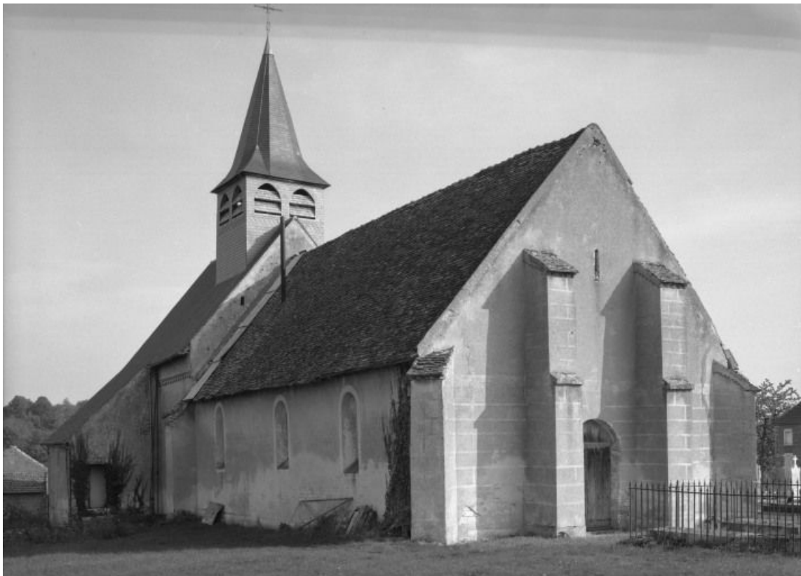
Elévations antérieure et gauche