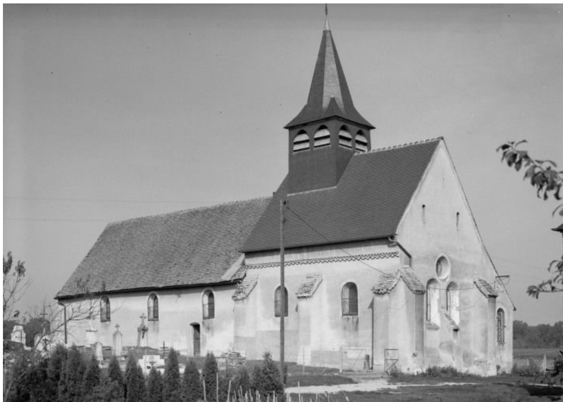
Elévation droite et chevet