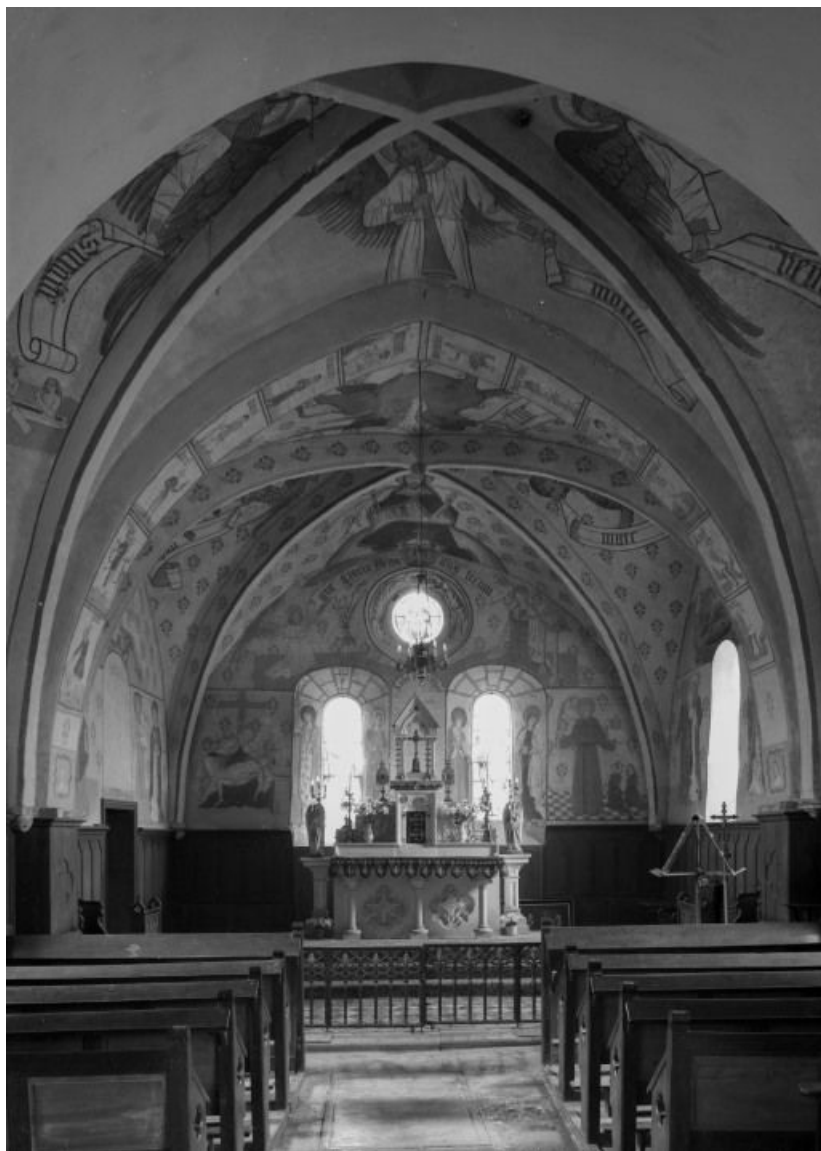
Vue générale du chœur