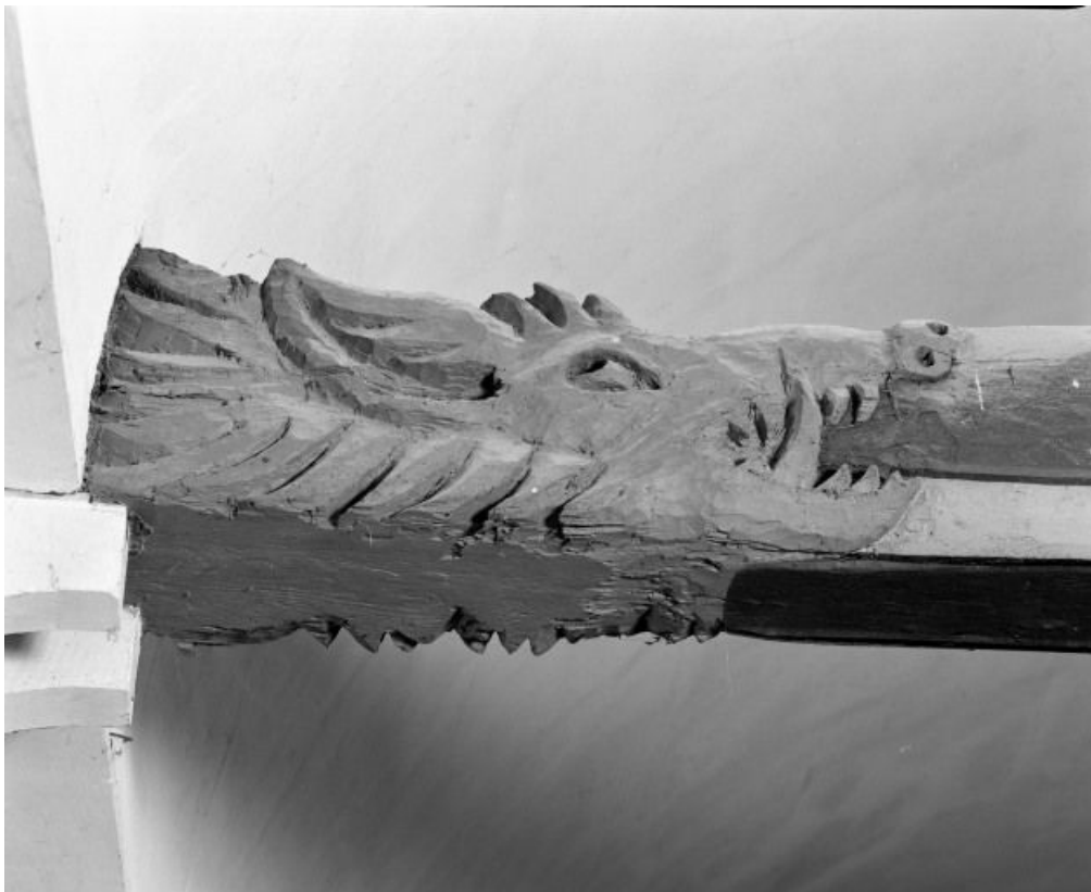
Charpente de la nef, détail du 3e entrain, avers 21, Bagnot