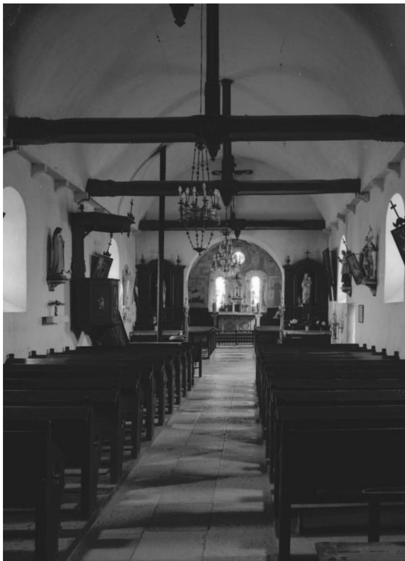
Vue intérieure prise de l'entrée