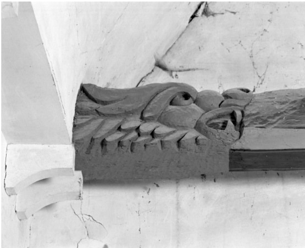
Charpente de la nef, détail du 5e entrain 21, Bagnot