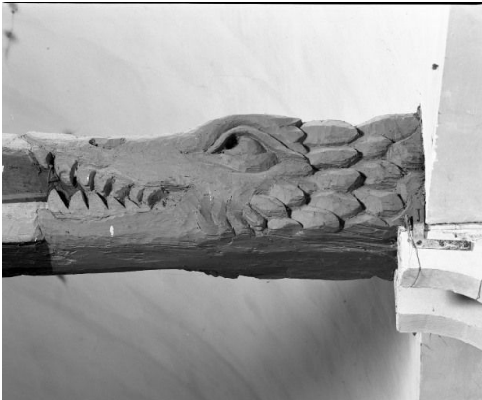
Charpente de la nef, détail du 2e entrain, revers 21, Bagnot