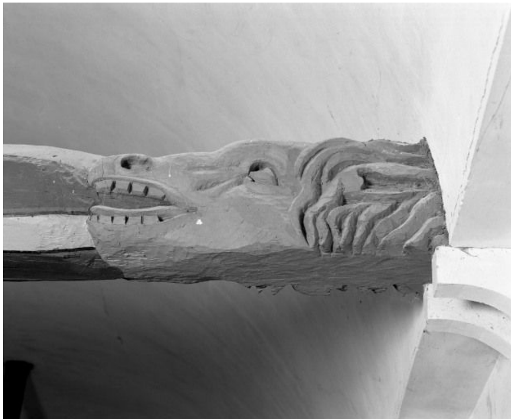
Charpente de la nef, détail du 4e entrain, revers