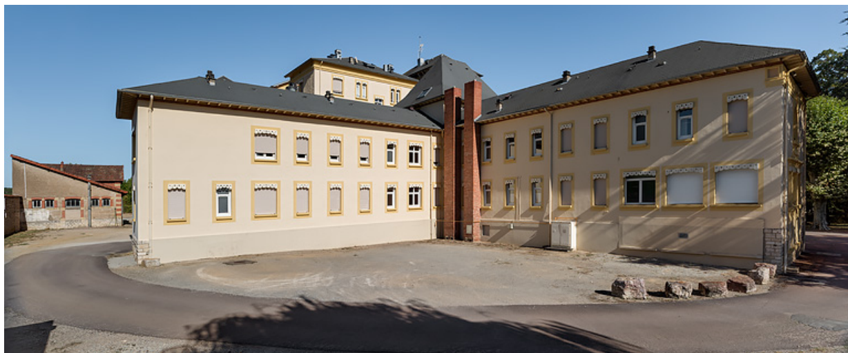
Bâtiment des bains, élévation postérieure, vue depuis l'ouest.