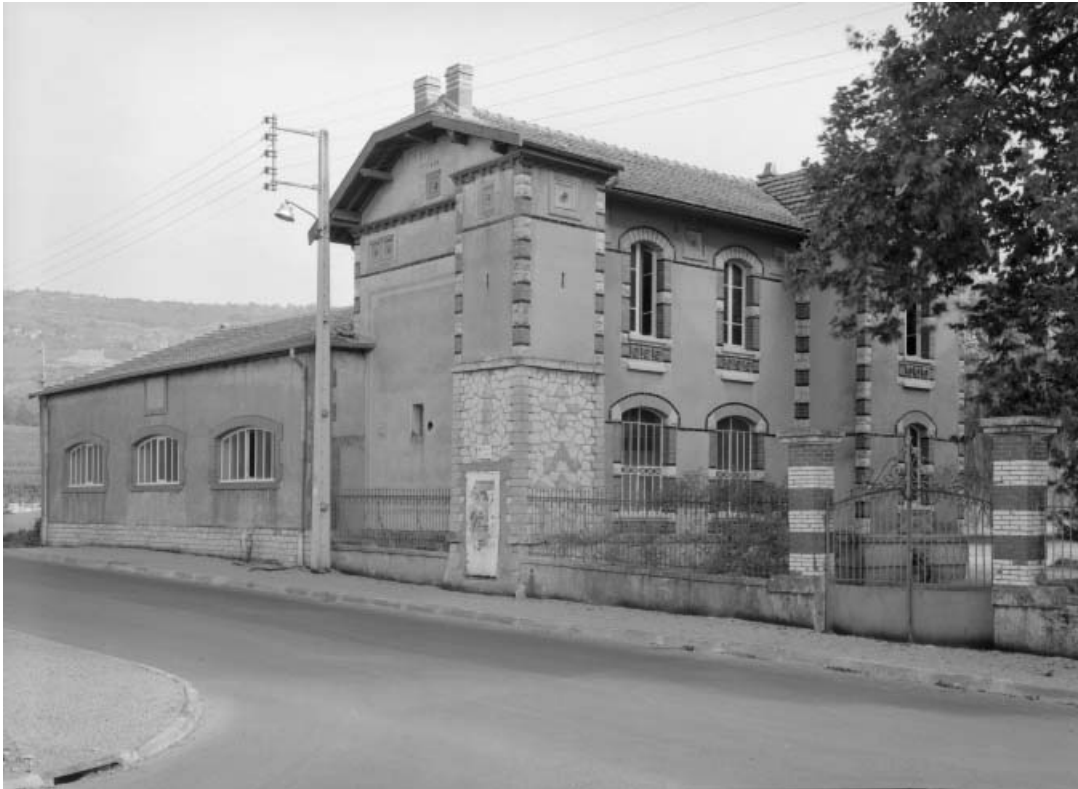
Bâtiment de la source Carnot.