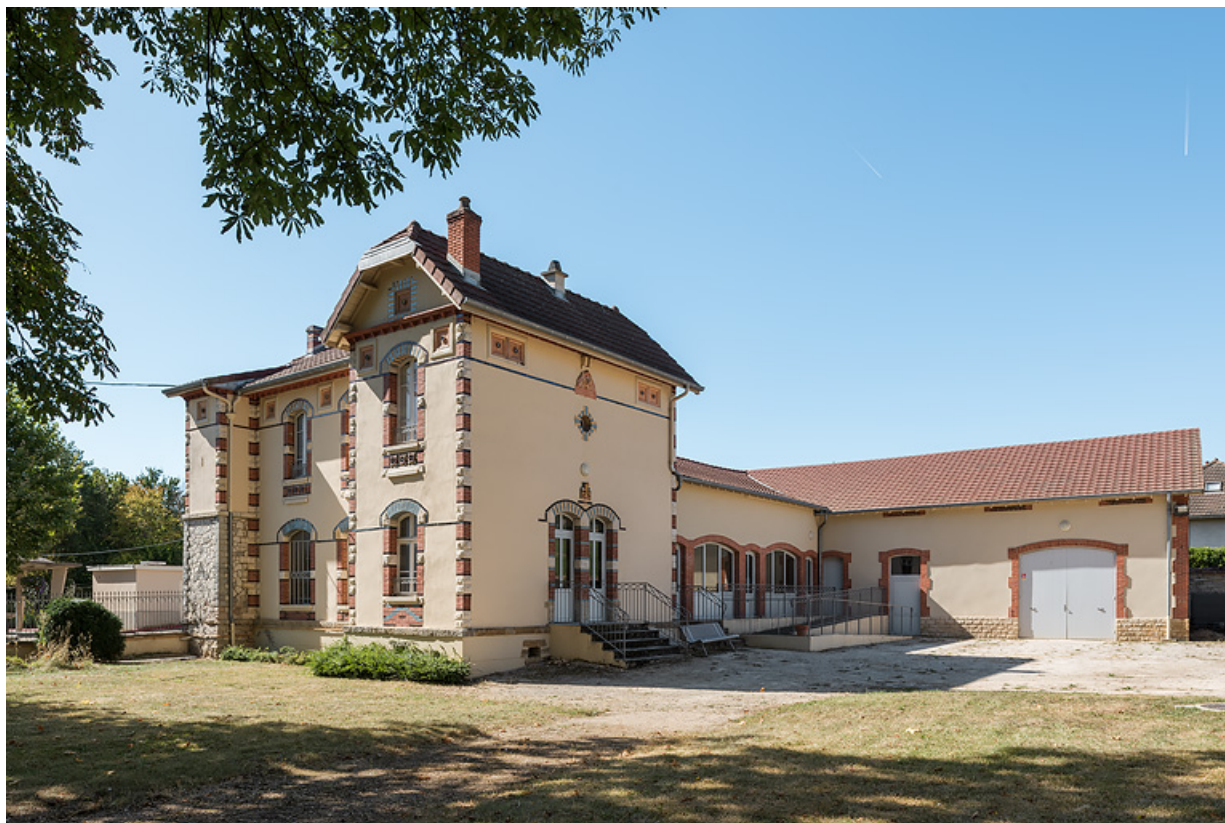
Bâtiment du forage (à gauche) avec hangar et usine d'embouteillage (à droite).