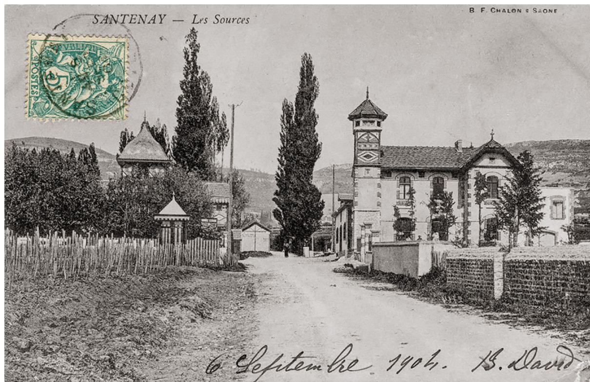
Vue depuis l'avenue des Sources (établissement à droite). 21, Santenay