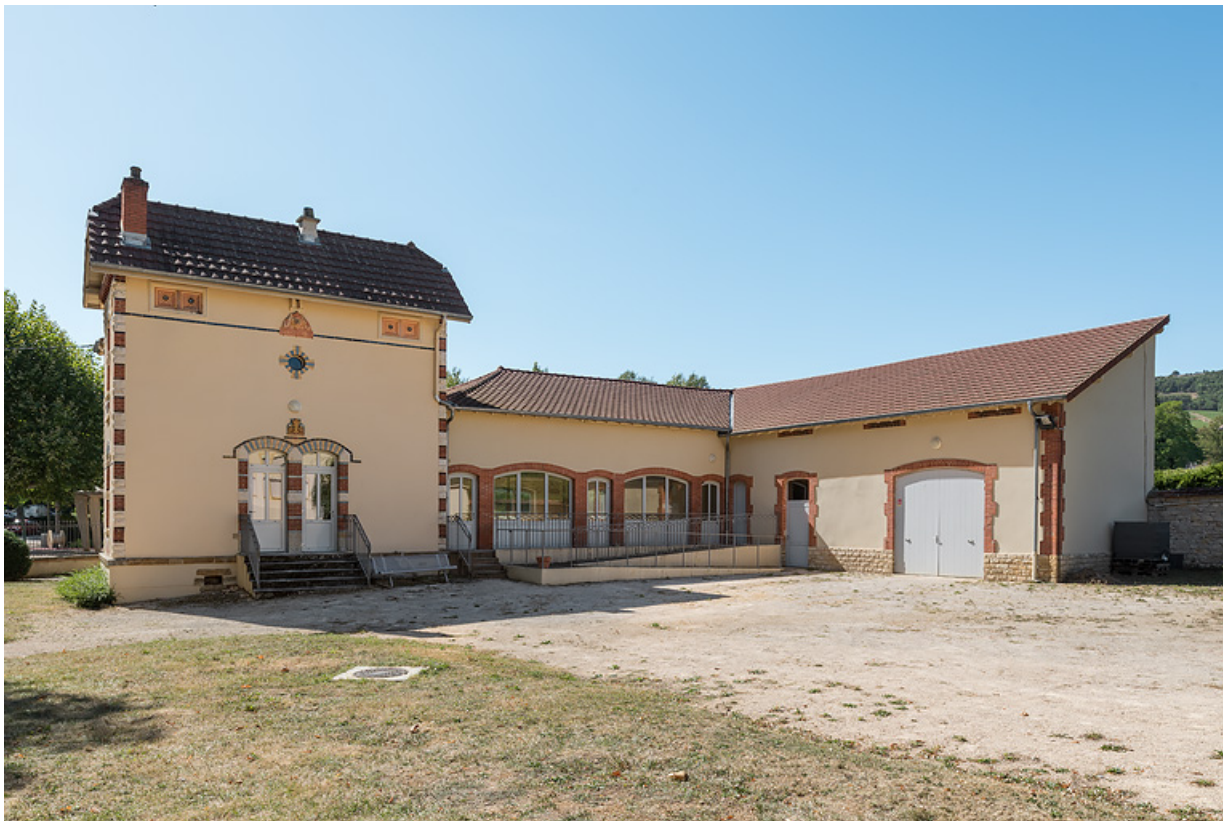
Bâtiment du forage (à gauche) avec hangar et usine d'embouteillage (à droite).