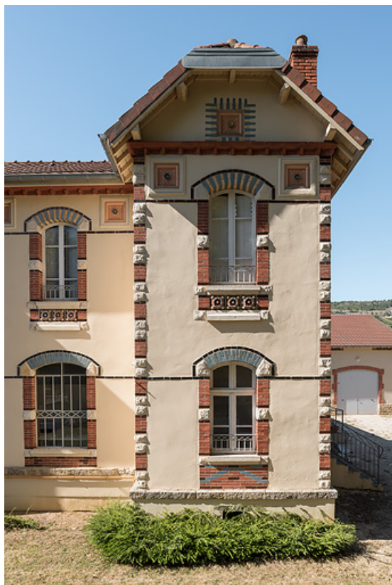
Bâtiment du forage avec logement du gardien à l'étage, façade principale, détail. 21, Santenay, 30 avenue des Sources