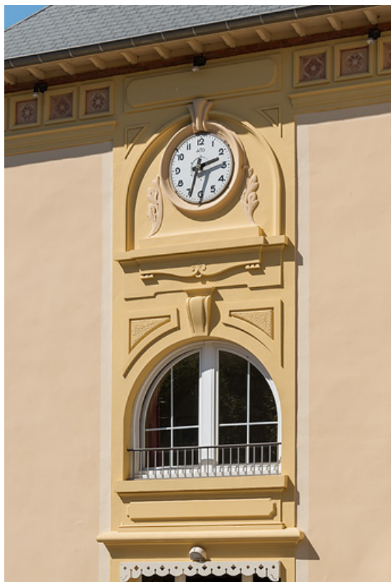
Bâtiment des bains, façade principale vue depuis le sud-est, baie et cadran du pavillon de droite. 21, Santenay, 30 avenue des Sources