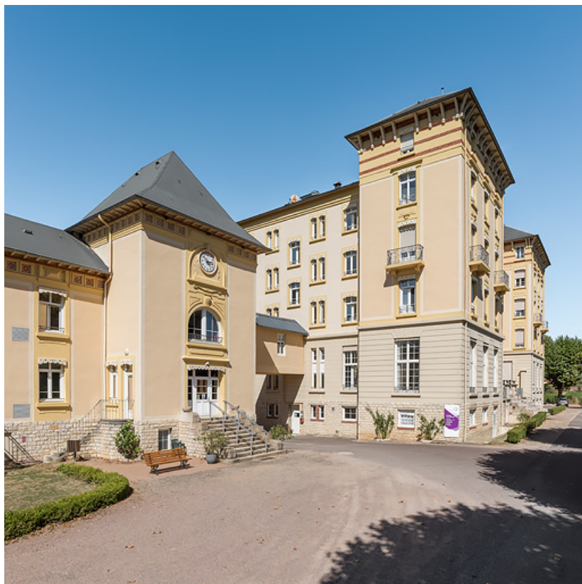
Situation du bâtiment des bains par rapport à l'hôtel, vue depuis le sud.