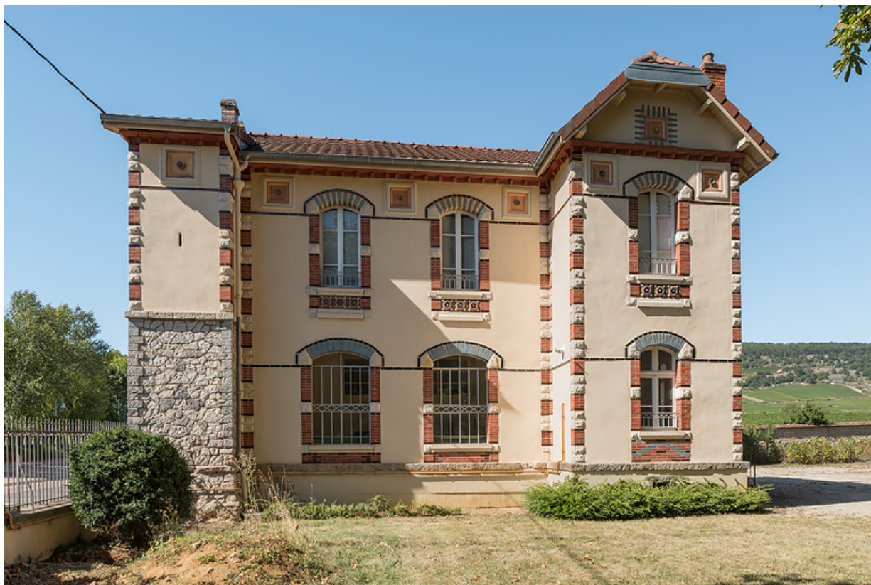
Bâtiment du forage avec logement du gardien à l'étage, façade principale.