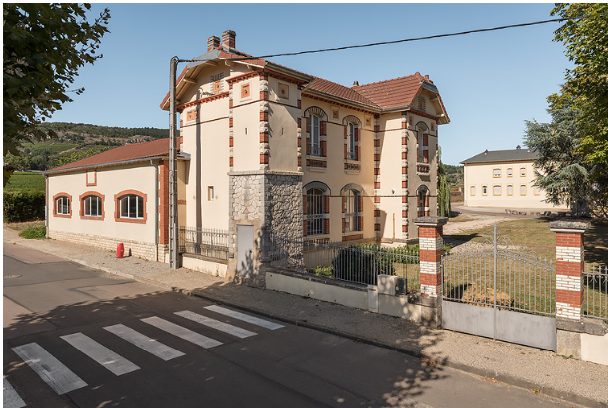
Bâtiment du forage et grille de clôture, vue depuis l'avenue des Sources, état actuel.