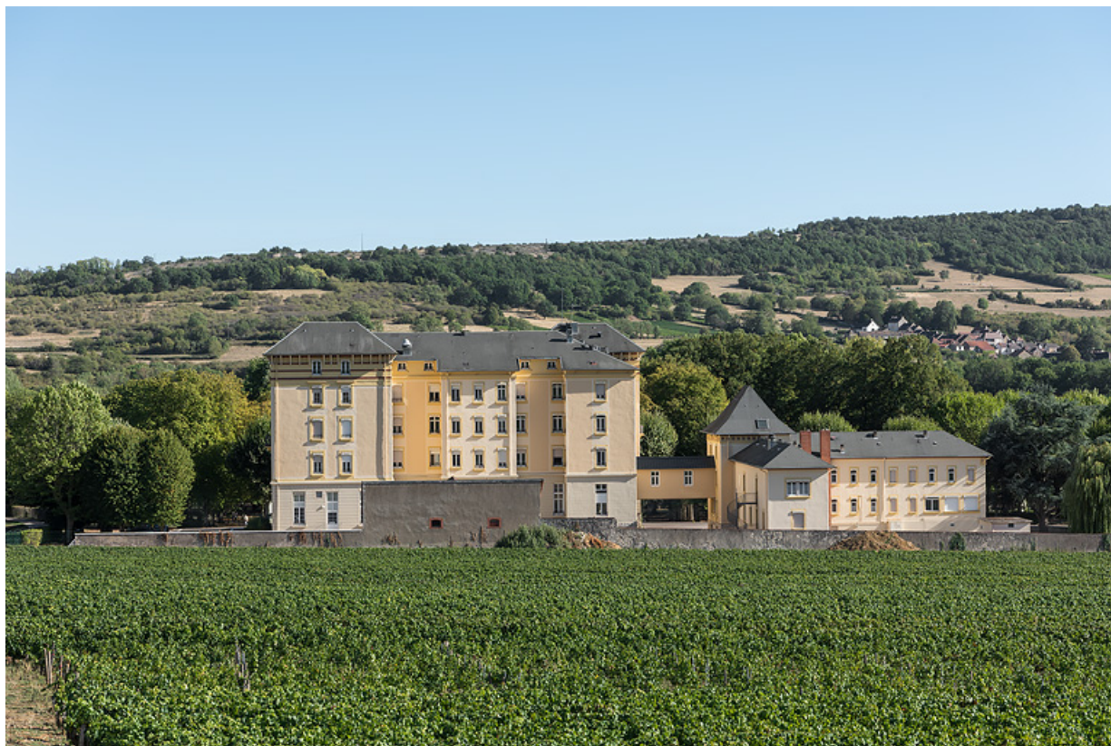
Situation du bâtiment des bains par rapport à l'hôtel, vue depuis le nord.