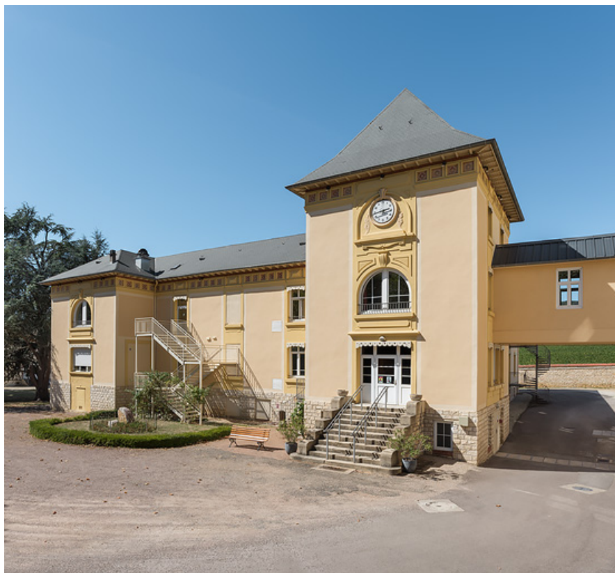
Bâtiment des bains, façade principale vue depuis le sud-est, et passerelle vers l'hôtel (à droite). 21, Santenay, 30 avenue des Sources

N° de l'illustration : 20192100306NUC4AQ