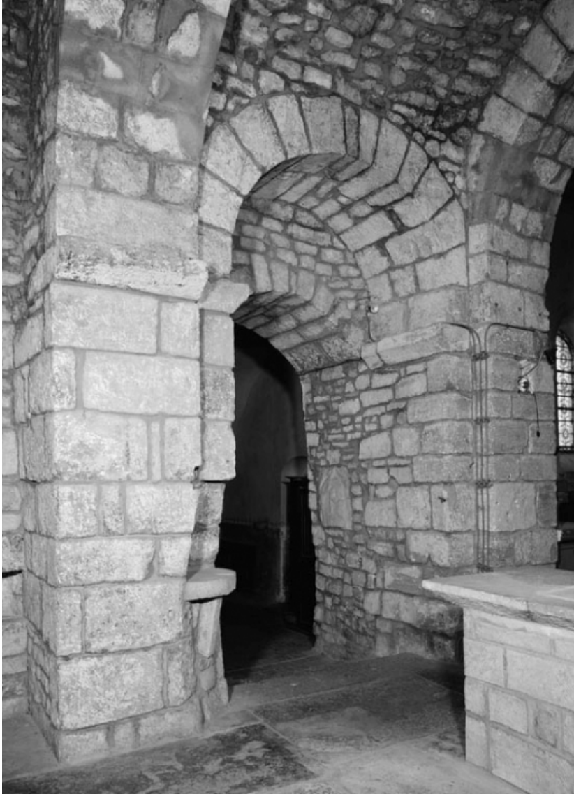
Entrée de la chapelle.