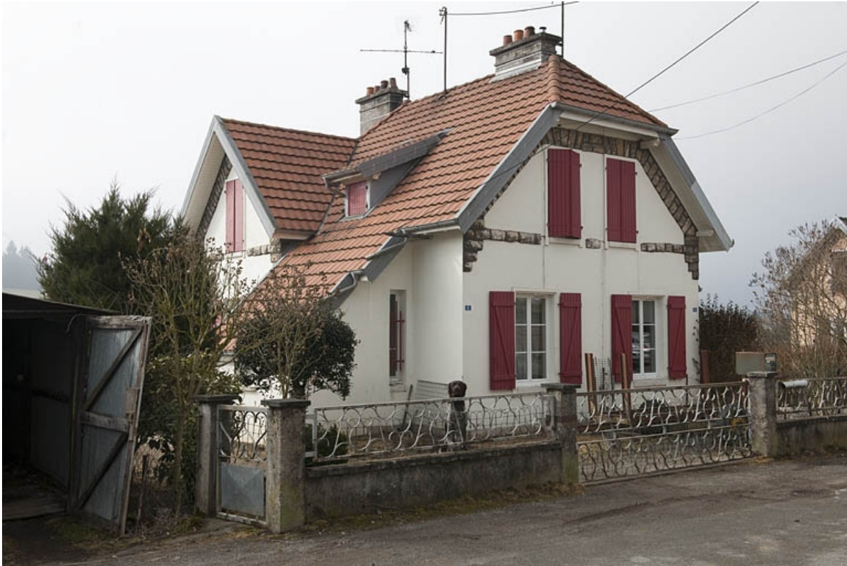
Maison jumelée impasse Bellevue. Vue de trois quarts.