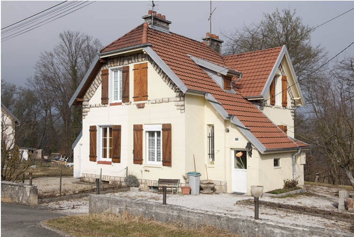
Maison jumelée route de Méziré. Vue de trois quarts.