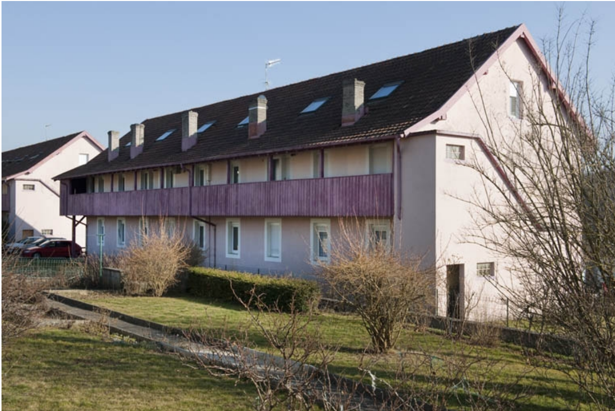
Immeuble d'habitation vu de trois quarts arrière..