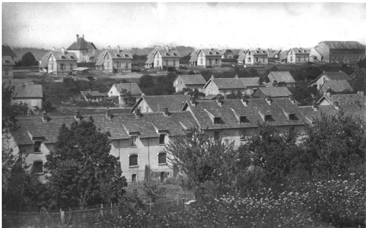
Vue d'ensemble depuis le sud-ouest.