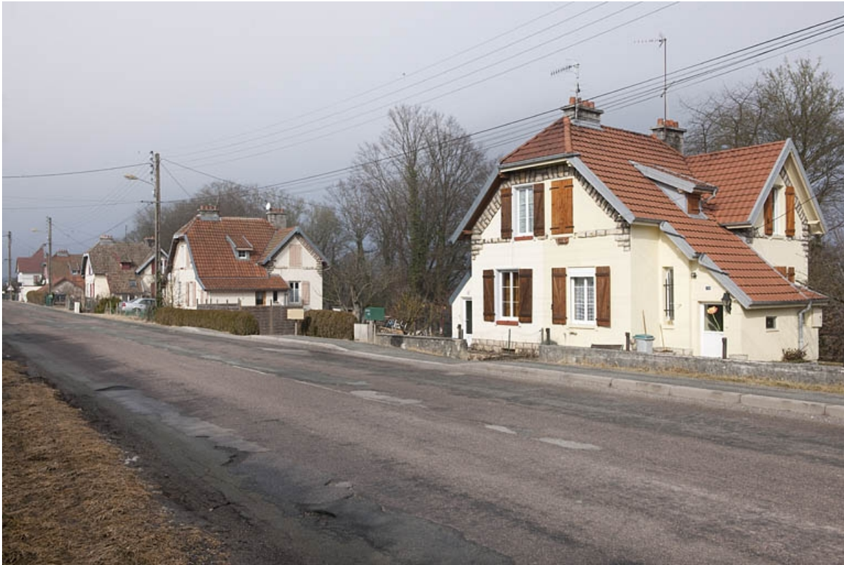
Maisons jumelées route de Méziré.