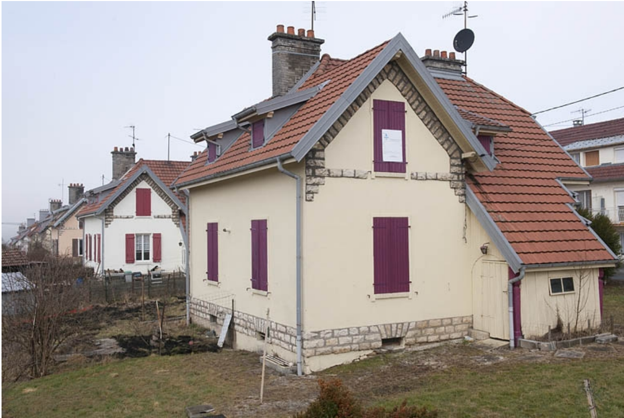
Façades sud des maisons jumelées impasse Bellevue.