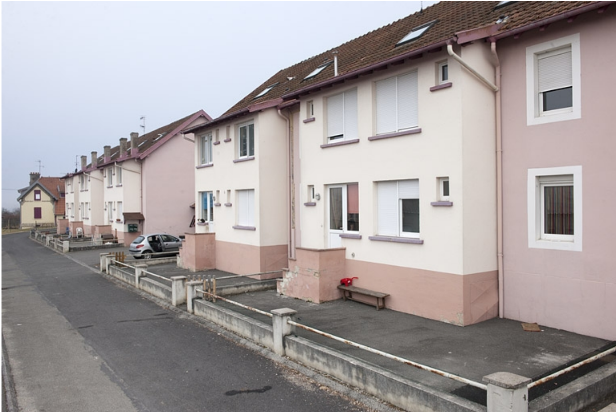
Immeubles d'habitation vus depuis l'est. 25, Fesches-le-Châtel route de Méziré