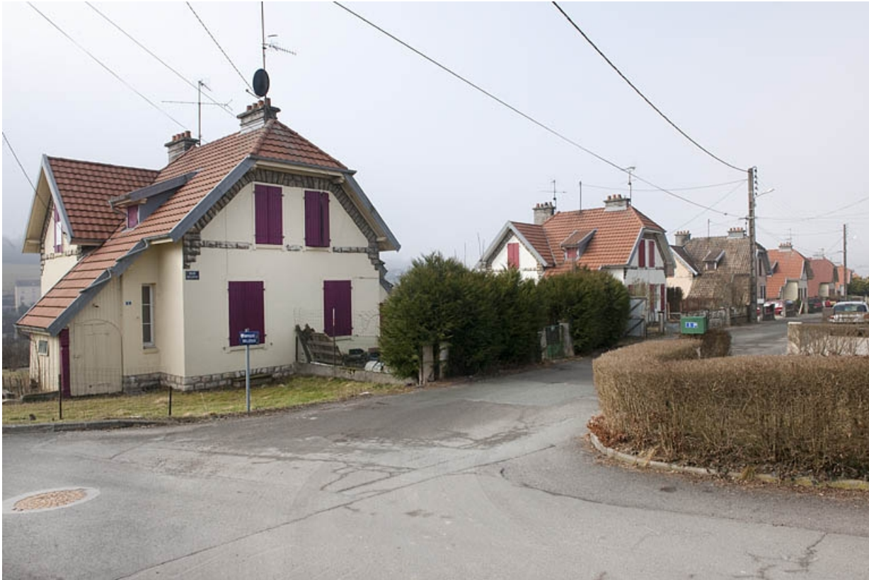
Maisons jumelées impasse Bellevue.