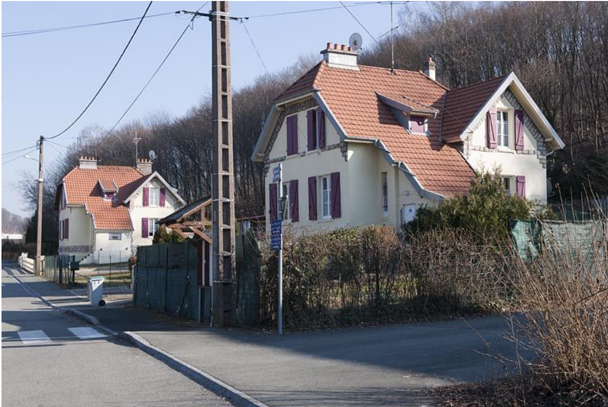
Groupe de 2 maisons jumelées situées à l'est.

25, Fesches-le-Châtel rue des Voironnes, lieudit : Champ de l'Oeil