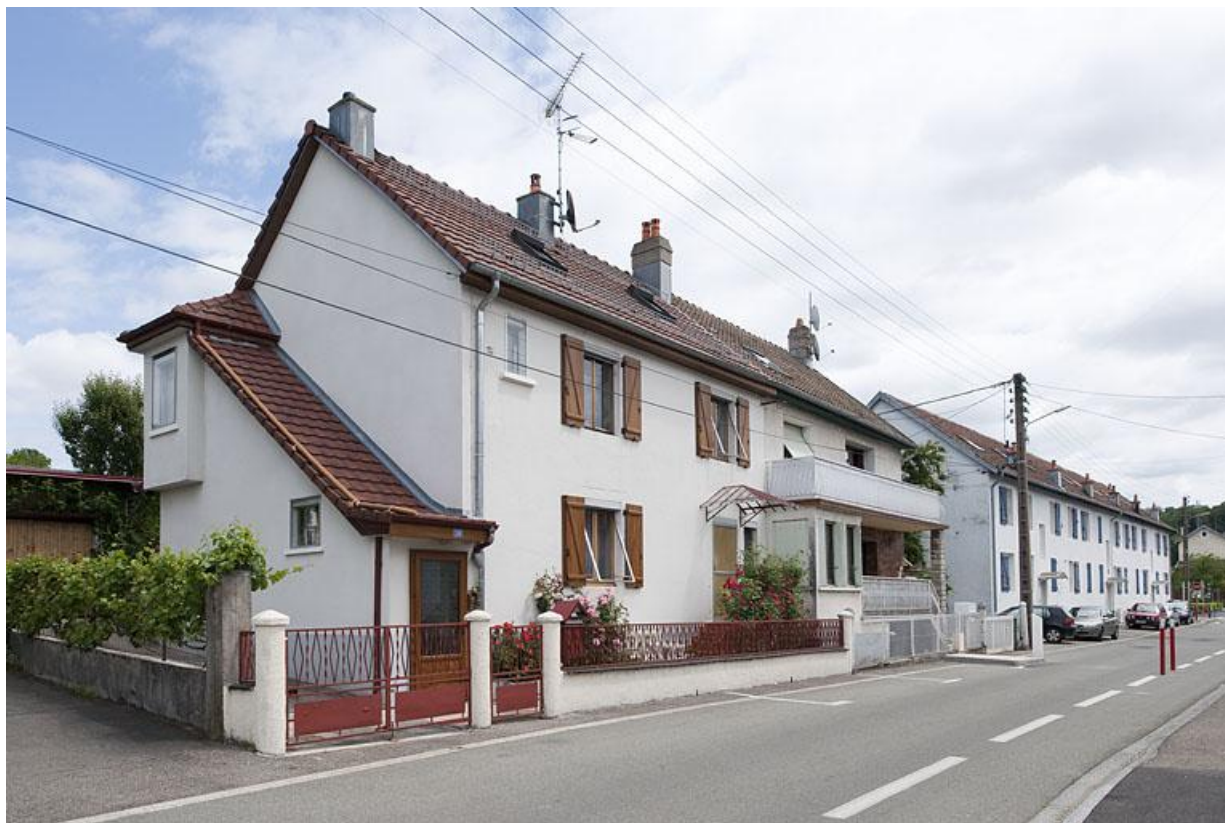
Vue d'ensemble depuis l'ouest.

25, Fesches-le-Châtel, 18 à 26 rue de Verdun