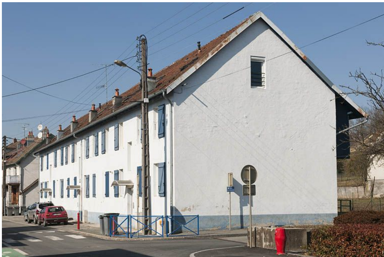
Immeuble de 12 logements vu depuis le sud-est.

25, Fesches-le-Châtel, 18 à 26 rue de Verdun