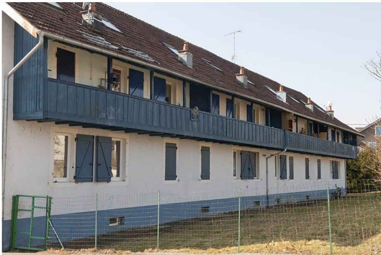
Immeuble de 12 logements. Façade postérieure.

25, Fesches-le-Châtel, 18 à 26 rue de Verdun