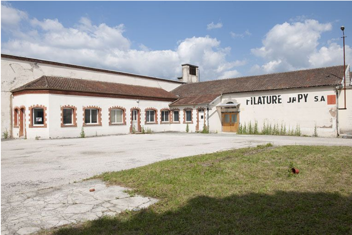
Bureaux vus depuis l'entrée.