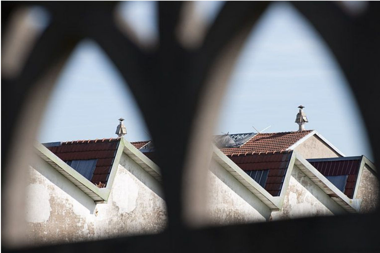
Sheds de l'atelier de filature vus à travers une clôture.