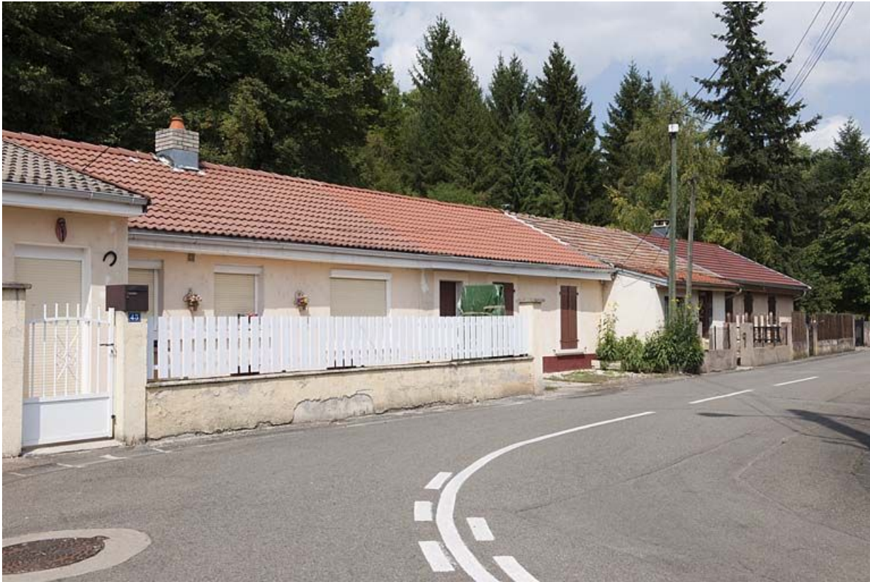
Habitation en rez-de-chaussée. Vue de trois quarts gauche.