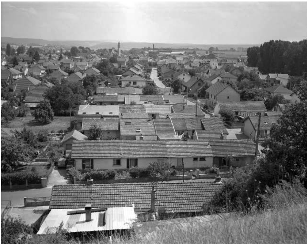
Vue panoramique sur les cités de Pologne.