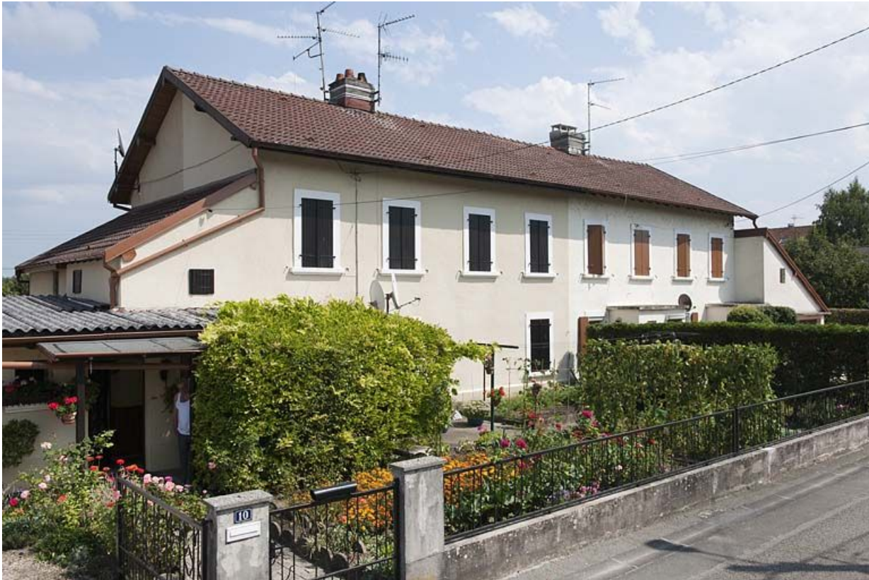
Habitation à étage. Vue de trois quarts gauche.