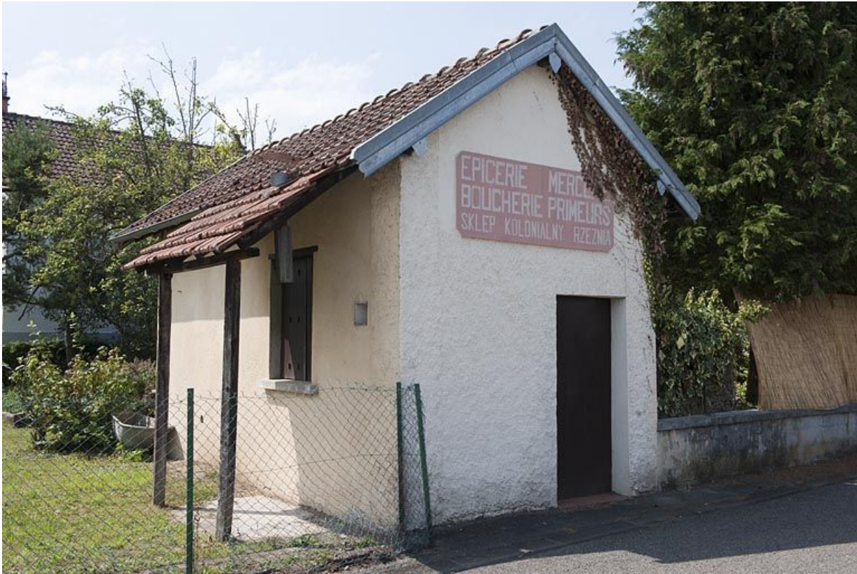
Epicerie (n°15 rue de Gravier).