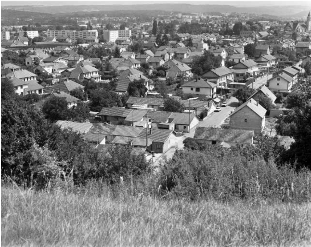
Vue panoramique sur les cités de Pologne.