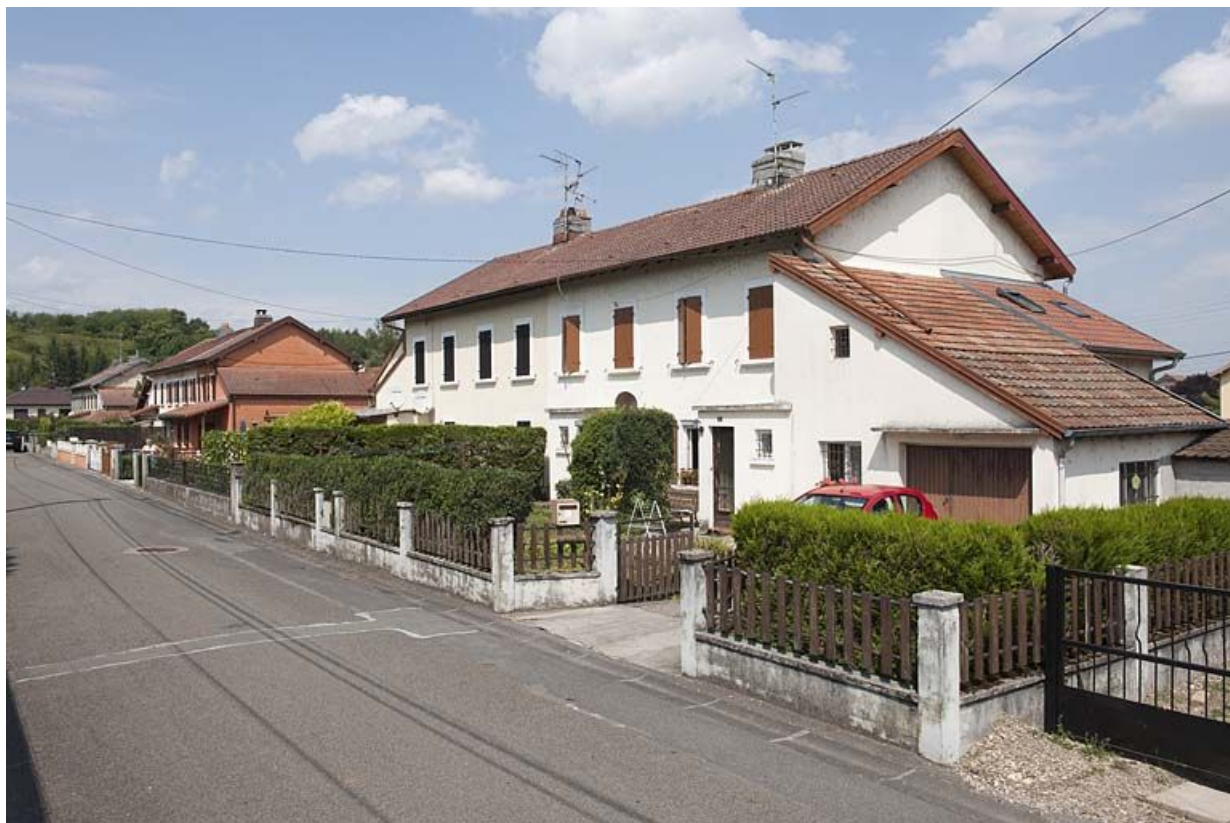
Habitation à étage. Vue de trois quarts droite.