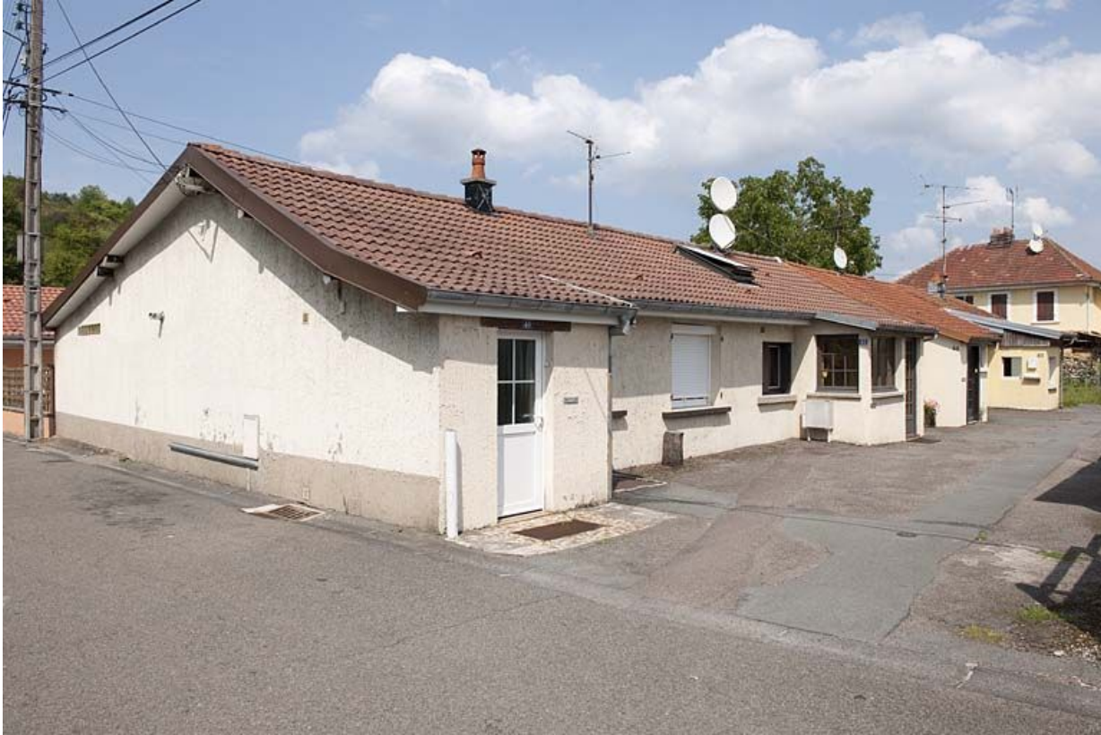
Habitation en rez-de-chaussée. Vue depuis la rue.