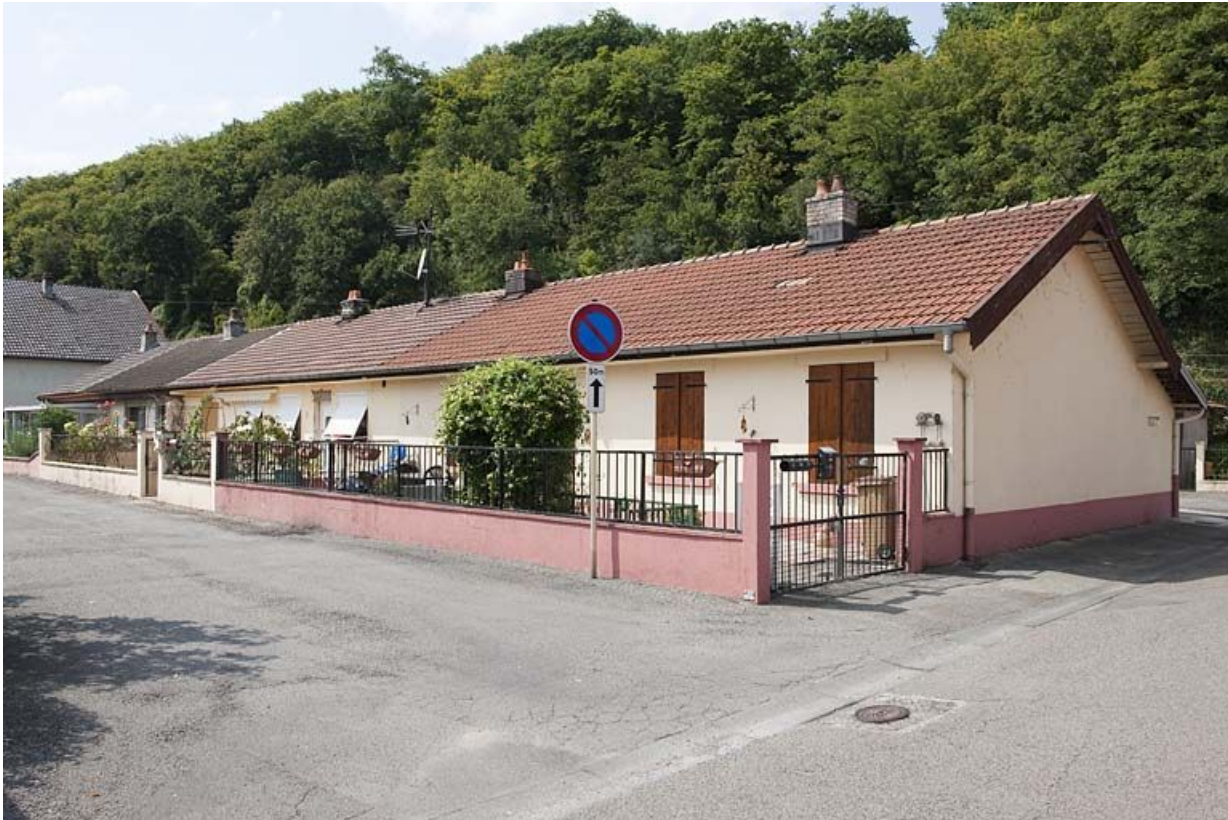
Habitation en rez-de-chaussée. Vue de trois quarts droite.