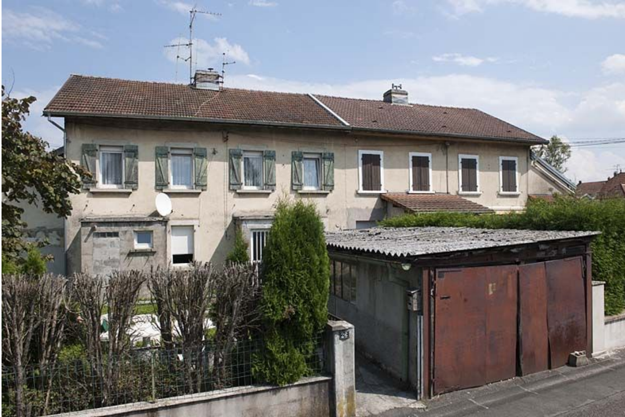
Habitation à étage. Façade ouest.