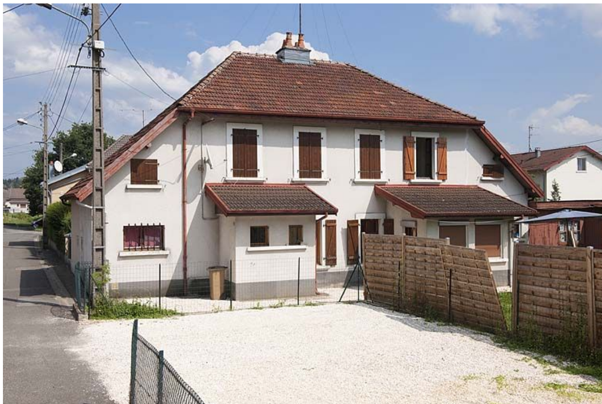
Façade ouest d'une maison.