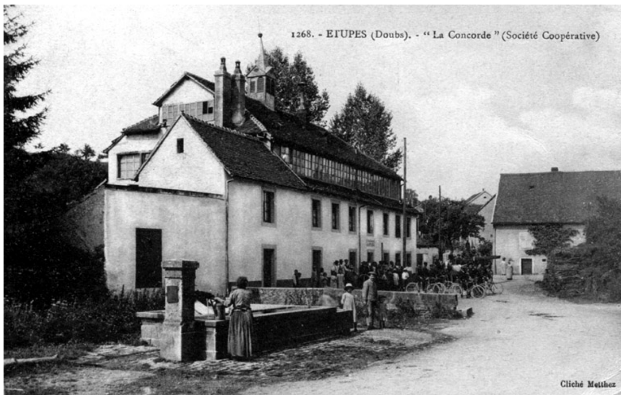
Étupes (Doubs). La " Concorde " (société coopérative). 25, Étupes place du Marché

Carte postale, cliché Mettetz, s.d. [début du 20e siècle], par Mettetz (photographe). Lieu de conservation : collection particulière : M. Wittig