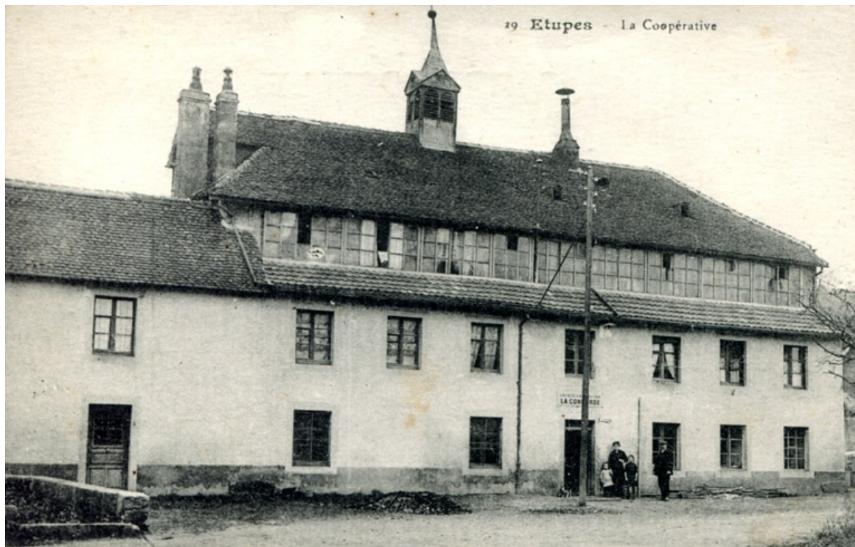
Étupes. La Coopérative.