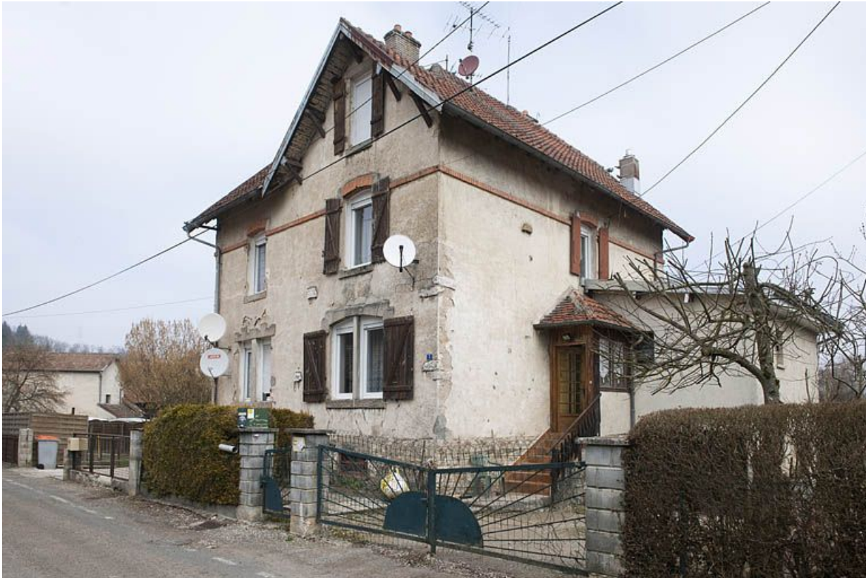
Maison à deux logements (de cadre ?).