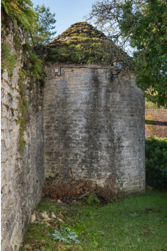
Vue de la première tour côté nord-est.

21, Aignay-le-Duc ruelle Derrière les Grands Murs