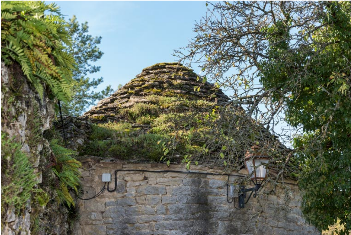
Détail de la toiture de la première tour.

21, Aignay-le-Duc ruelle Derrière les Grands Murs