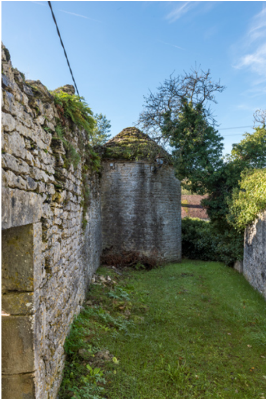
Vue d'ensemble de la première tour côté nord-est.

21, Aignay-le-Duc ruelle Derrière les Grands Murs