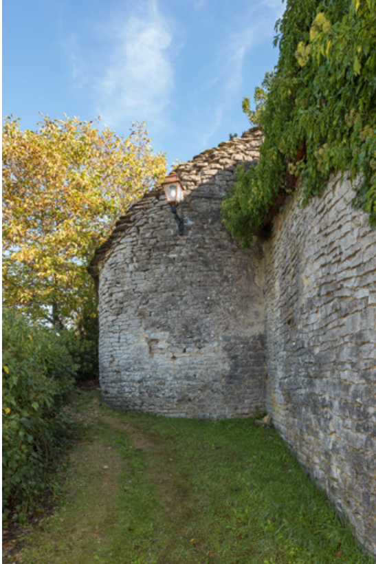
Vue d'ensemble de la deuxième tour côté sud-ouest. 21, Aignay-le-Duc ruelle Derrière les Grands Murs