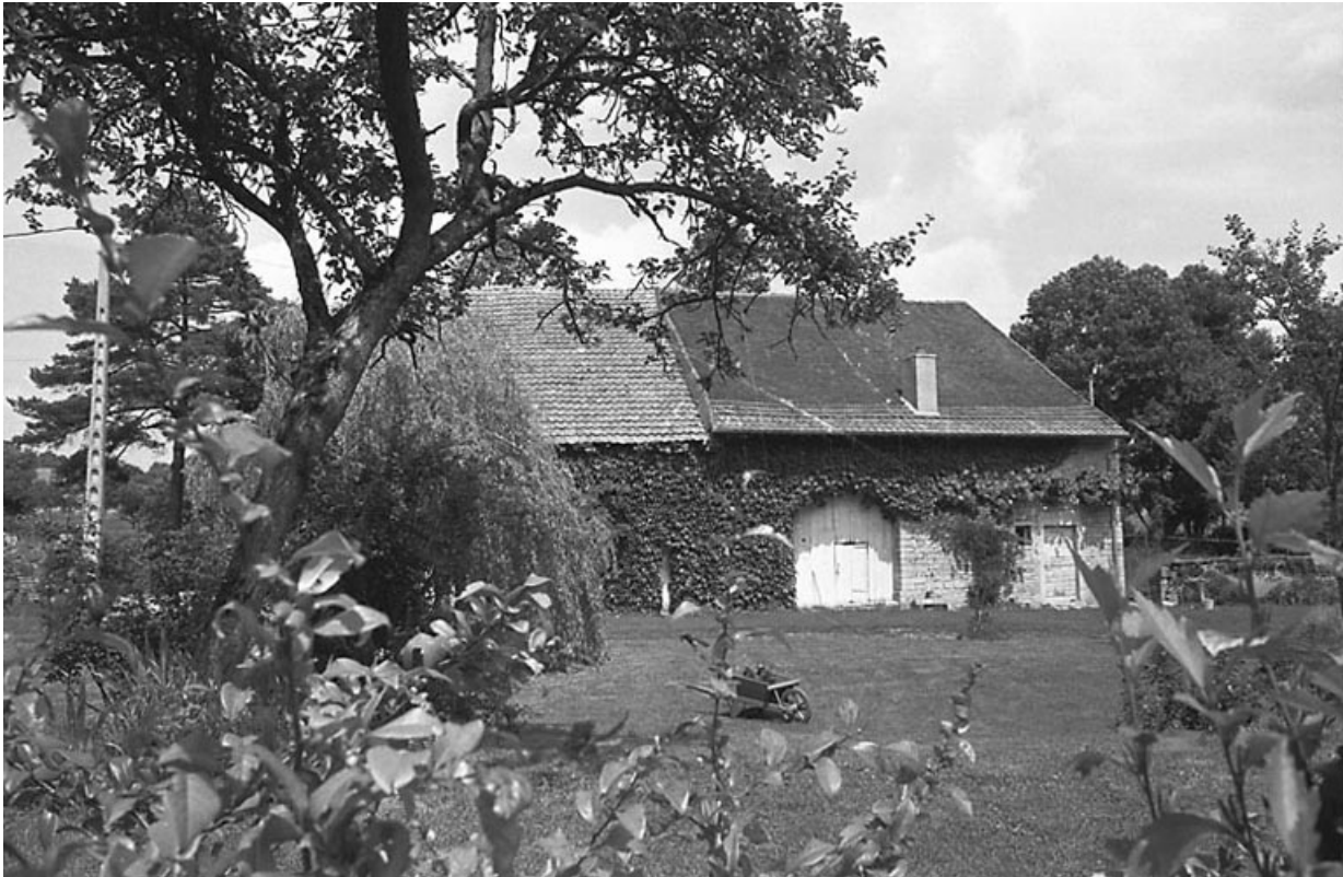
Vue du bâtiment agricole.