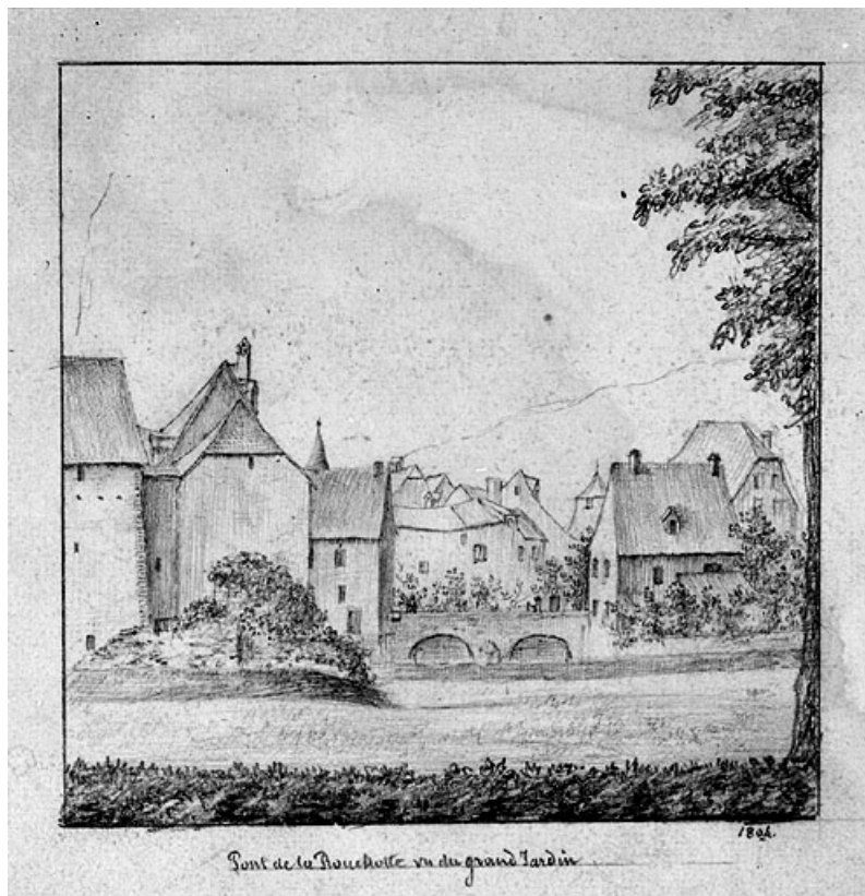
Pont de la Rouchotte vu du Grand Jardin, 1804. 25, Montbéliard rue du Général Leclerc