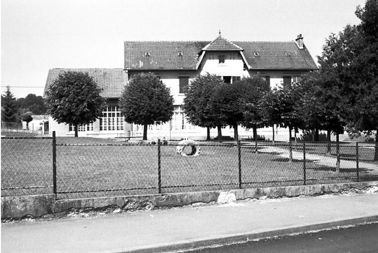
Groupe scolaire en 1989. SRI. Inventaire topographique du canton de Beaucourt (1981-1982).

90, Beaucourt, lieudit : cité Eugène Bornèque