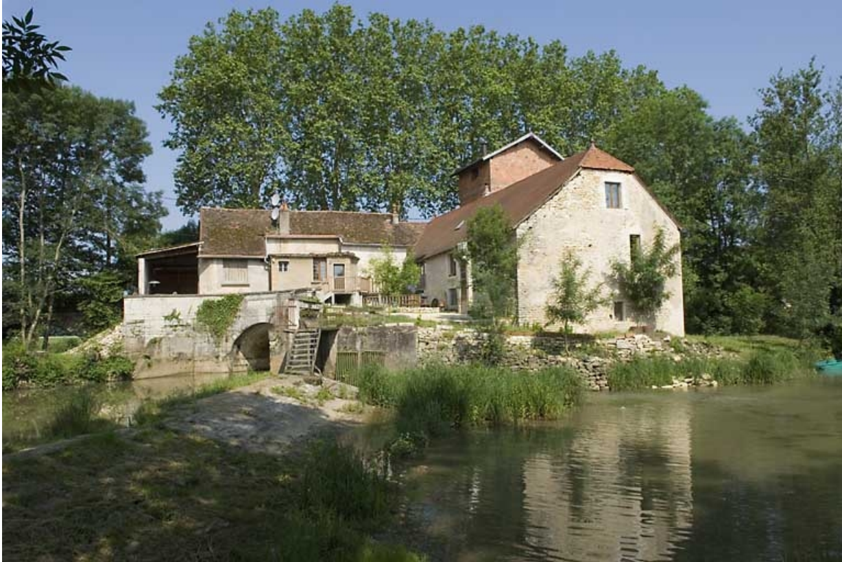
Vue d'ensemble depuis le barrage.