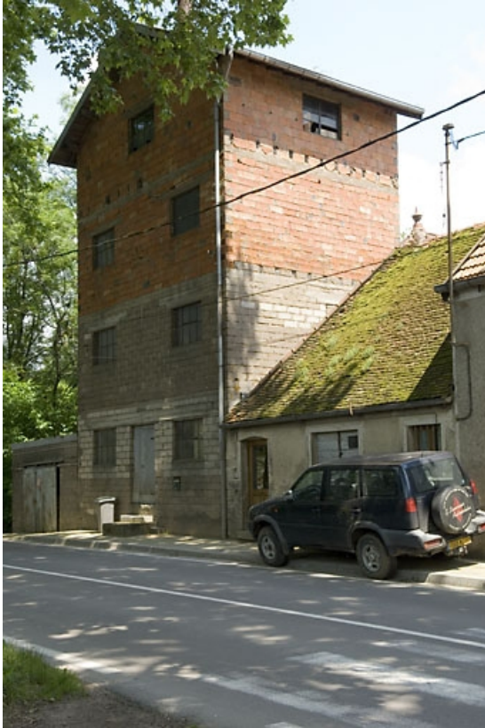
Atelier de fabrication (céréales secondaires). 70, Pesmes route de Dole