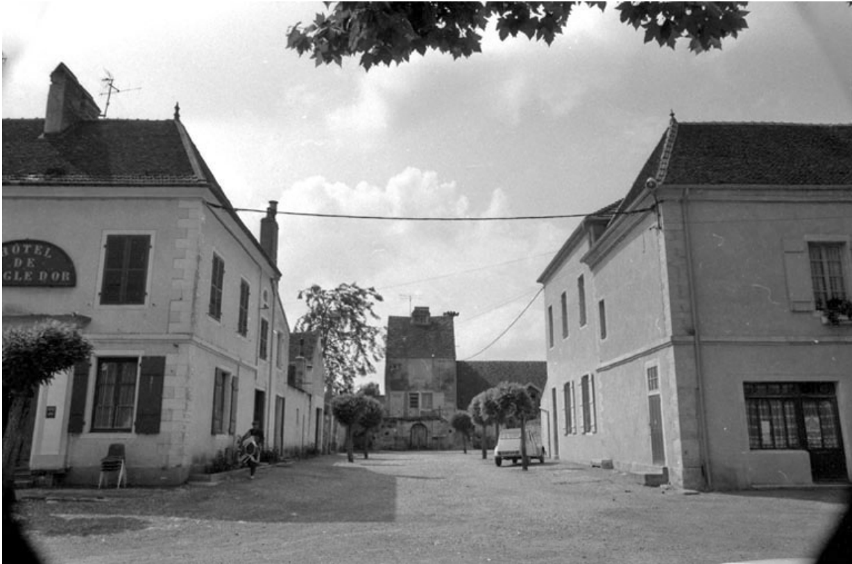
Bâtiments droit et gauche à l'entrée de l'ancienne cour d'honneur. 70, Pesmes place des Promenades