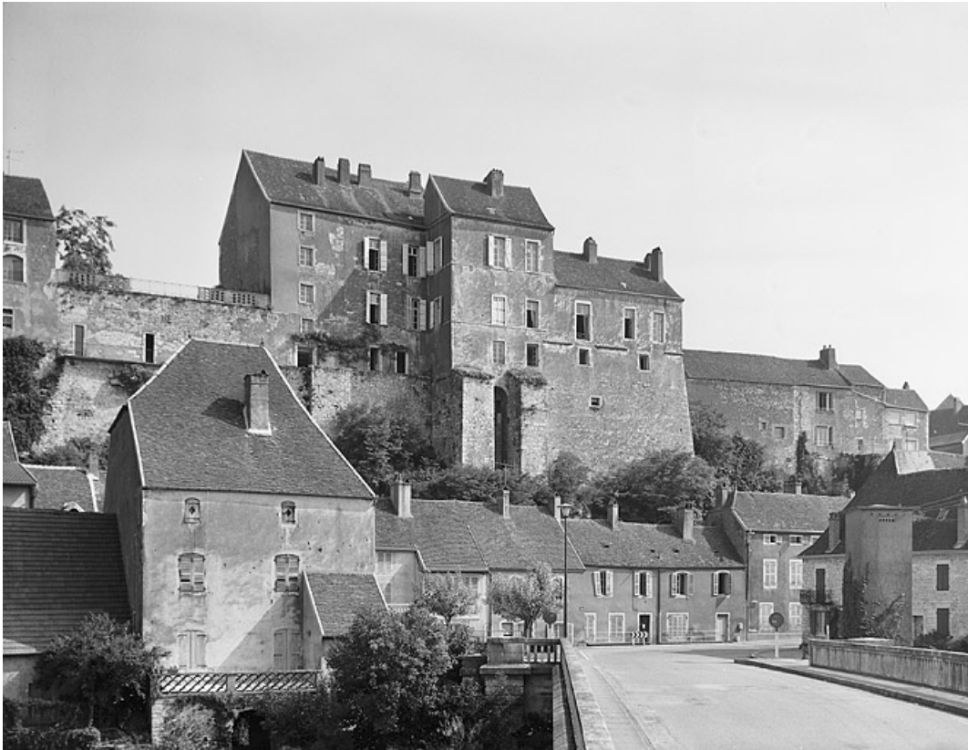
Partie gauche du château depuis l'Ognon.