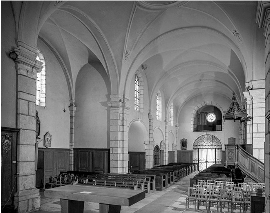
Intérieur : nef et bras du transept droit depuis le chœur.