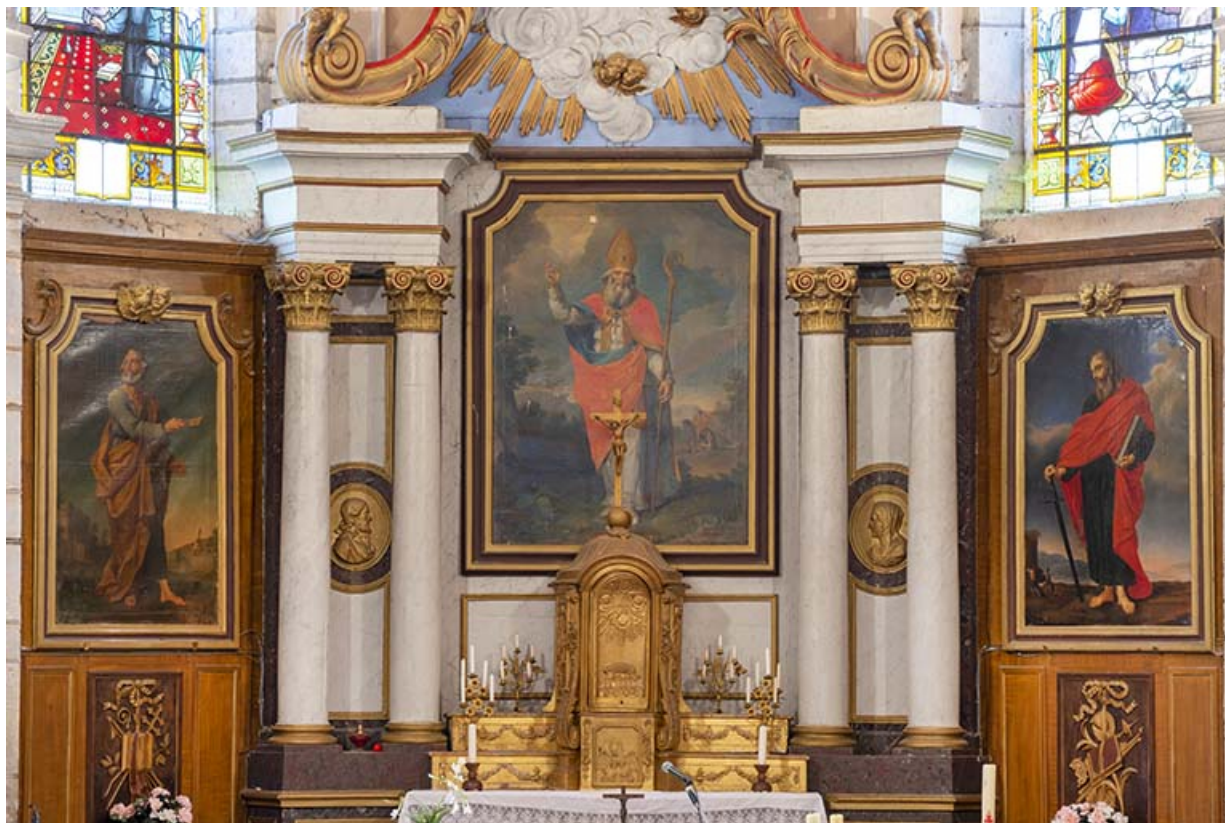
Retable et tabernacle du maître-autel en 2022.