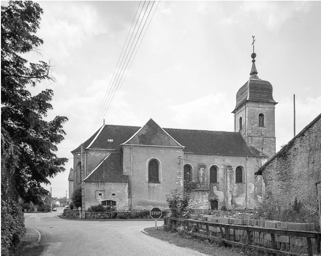
Extérieur : façade latérale gauche.