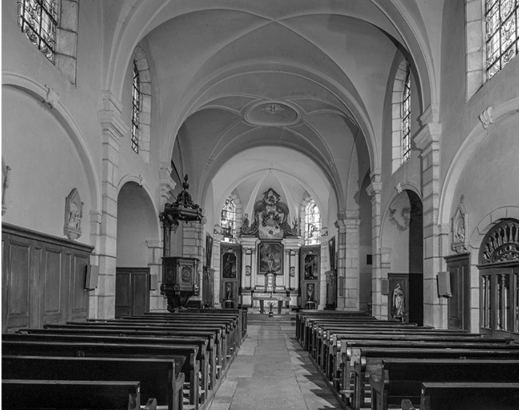
Intérieur : nef et chœur.