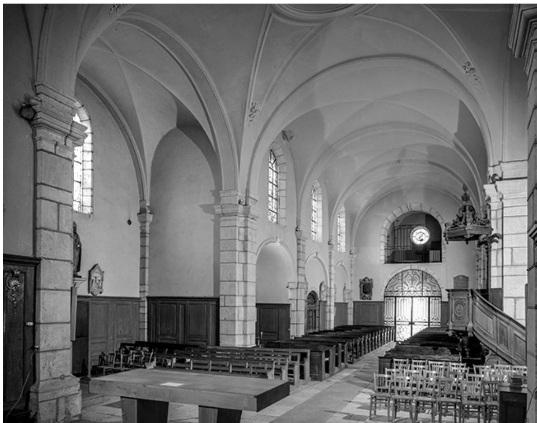
Intérieur : nef et bras du transept droit depuis le chœur.