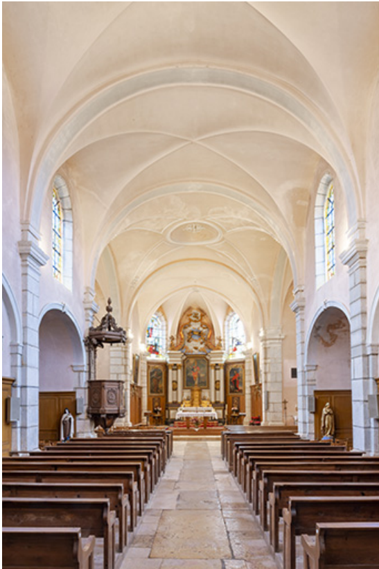
Nef et chœur vus depuis l'entrée en 2022.