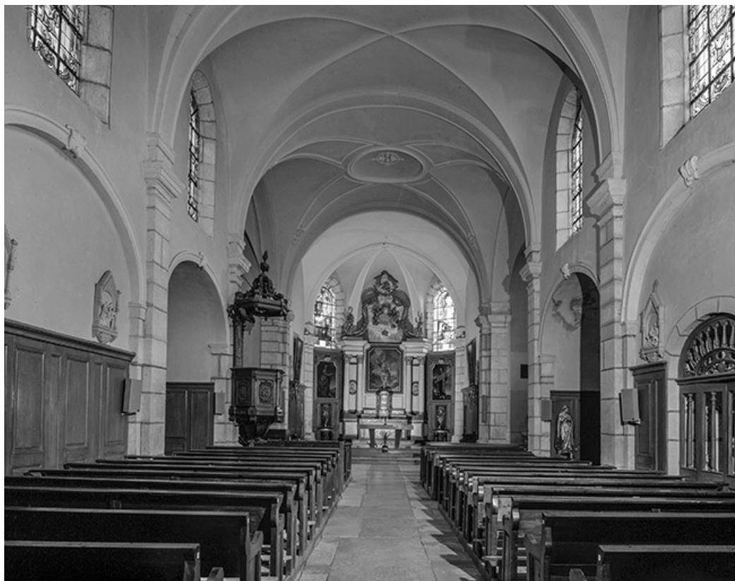
Intérieur : nef et chœur.