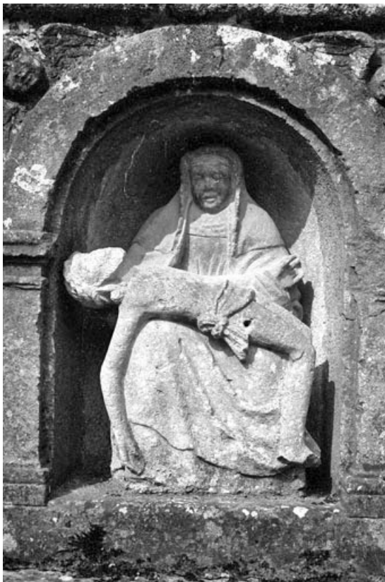
Vierge de pitié.