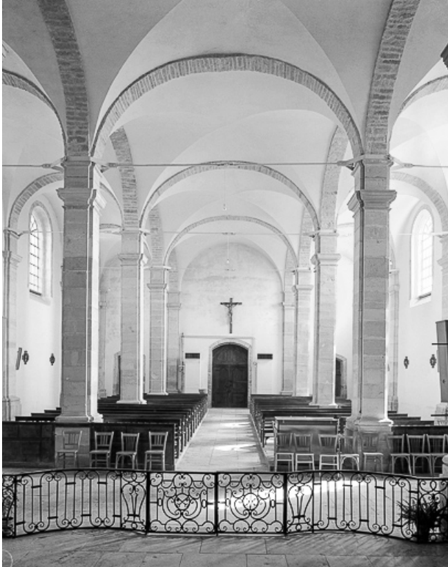
Nef vue depuis le chœur avec clôture de chœur

70, Broye-Aubigny-Montseugny, lieudit : Broye-les-Pesmes