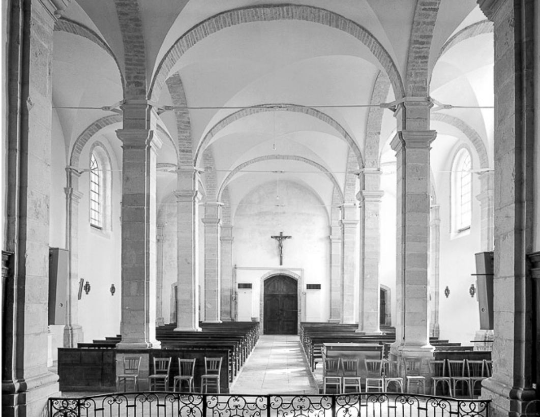
Nef vue depuis le chœur.

70, Broye-Aubigny-Montseugny, lieudit : Broye-les-Pesmes