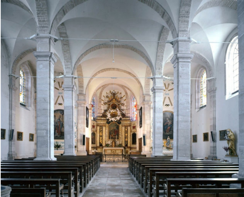
Vue de la nef et du chœur depuis l'entrée.

70, Broye-Aubigny-Montseugny, lieudit : Broye-les-Pesmes