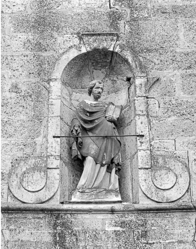
Détail : niche au-dessus du portail d'entrée avec statue en plâtre.

70, Broye-Aubigny-Montseugny, lieudit : Broye-les-Pesmes