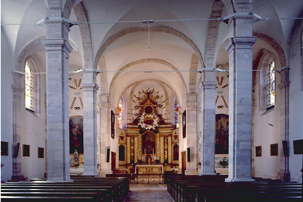
Vue de la nef et du chœur depuis l'entrée.

70, Broye-Aubigny-Montseugny, lieudit : Broye-les-Pesmes