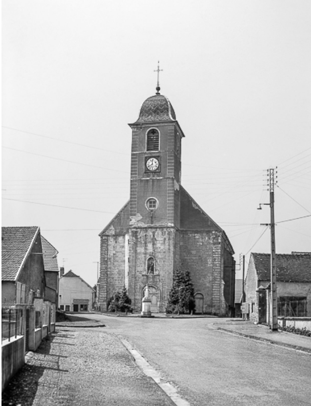
Façade antérieure avec tour-clocher.

70, Broye-Aubigny-Montseugny, lieudit : Broye-les-Pesmes