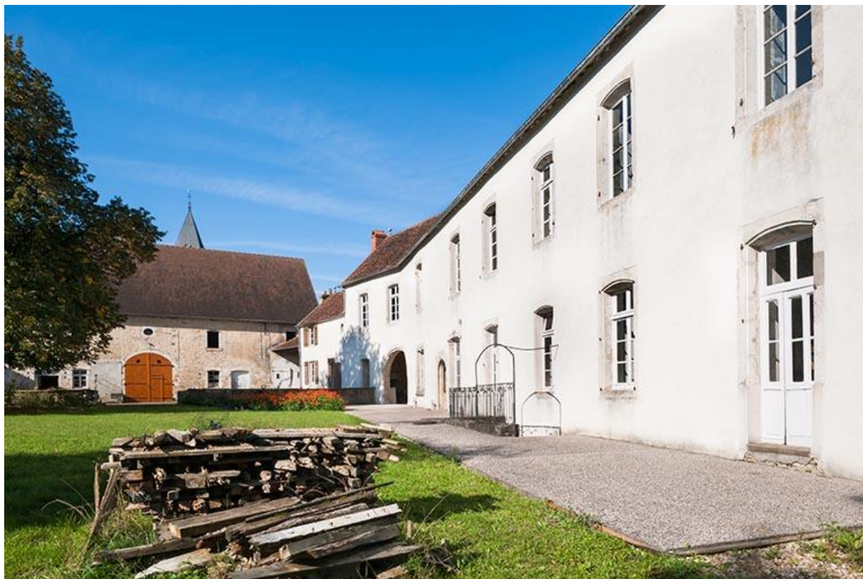
Vue d'ensemble sud-est