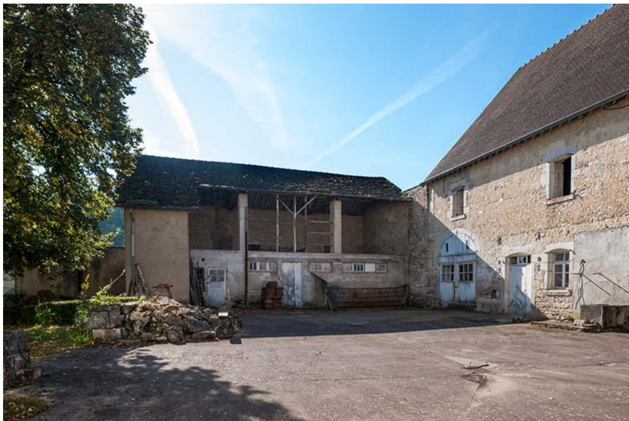
Dépendances situées au sud-ouest de la cour