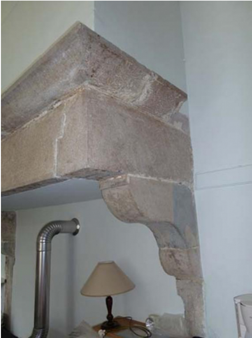
Détail du corbeau