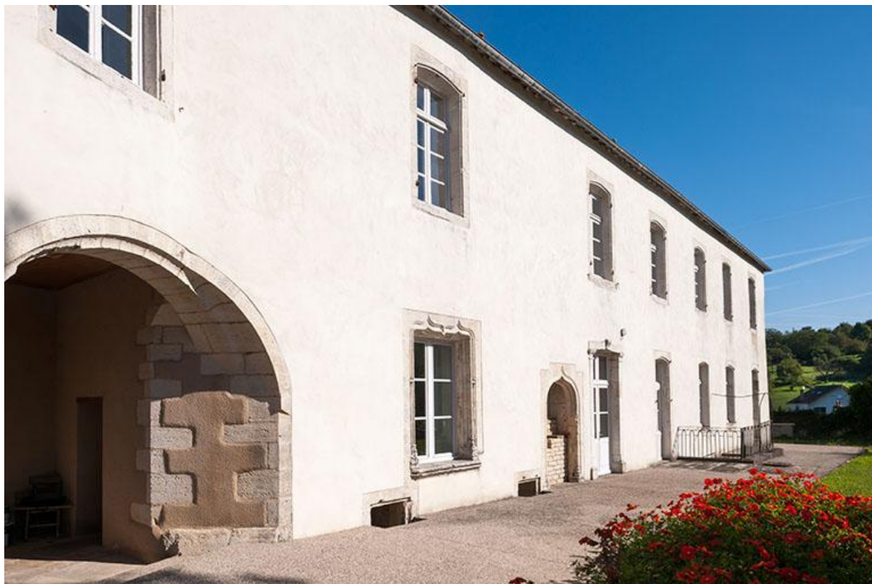
Vue sud-ouest du logis