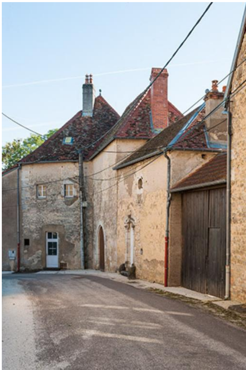
Les bâtiments, vue depuis la rue Ménans