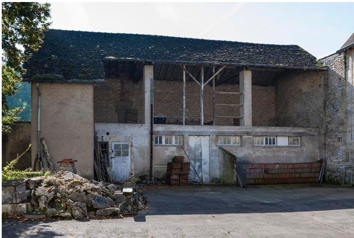
Dépendances situées au sud-ouest de la cour