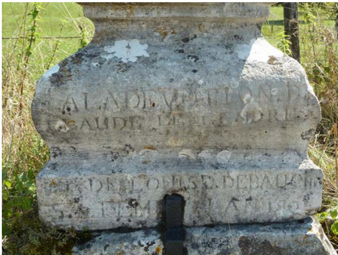
Détail du socle