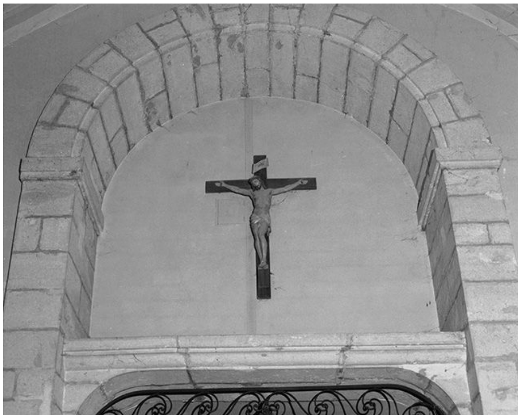
Statue d'applique : Christ en croix.