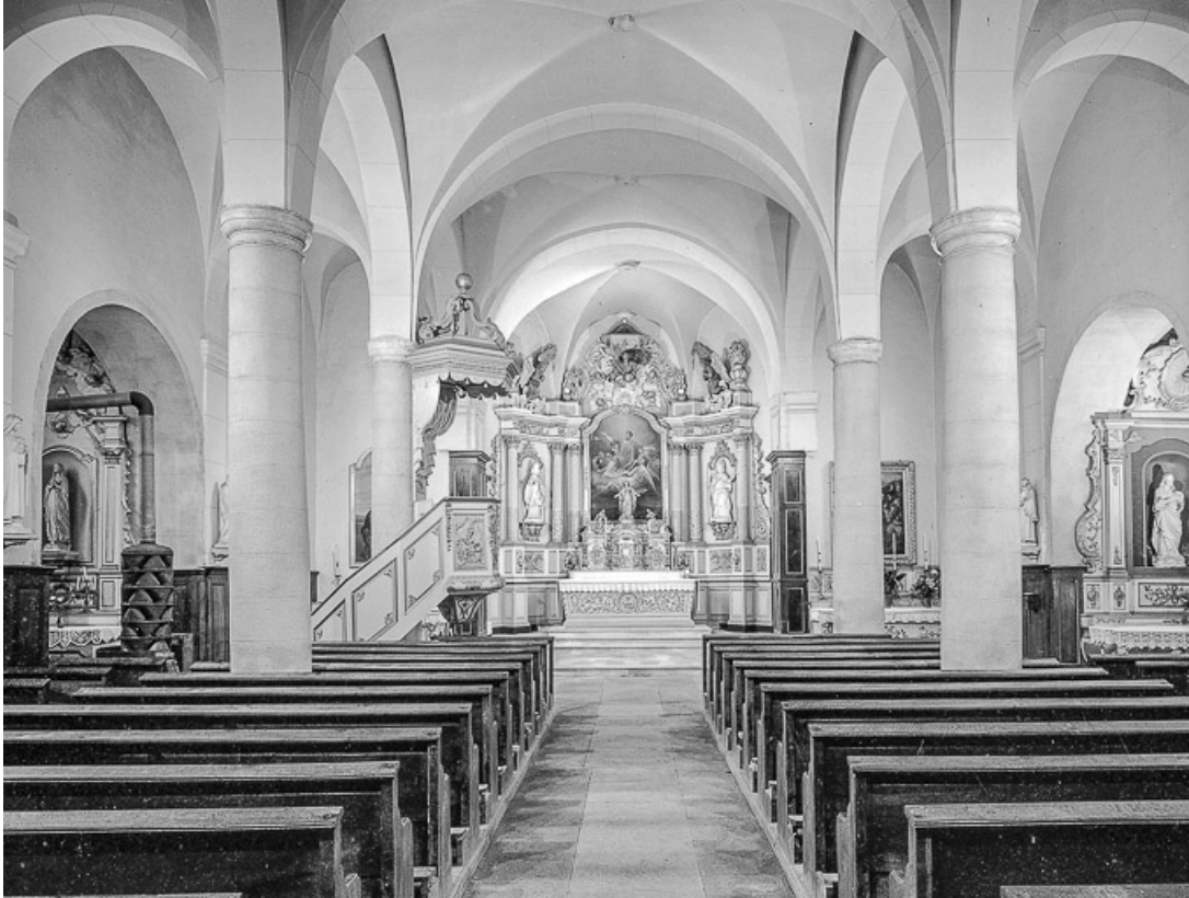
Vue de la nef et du chœur.