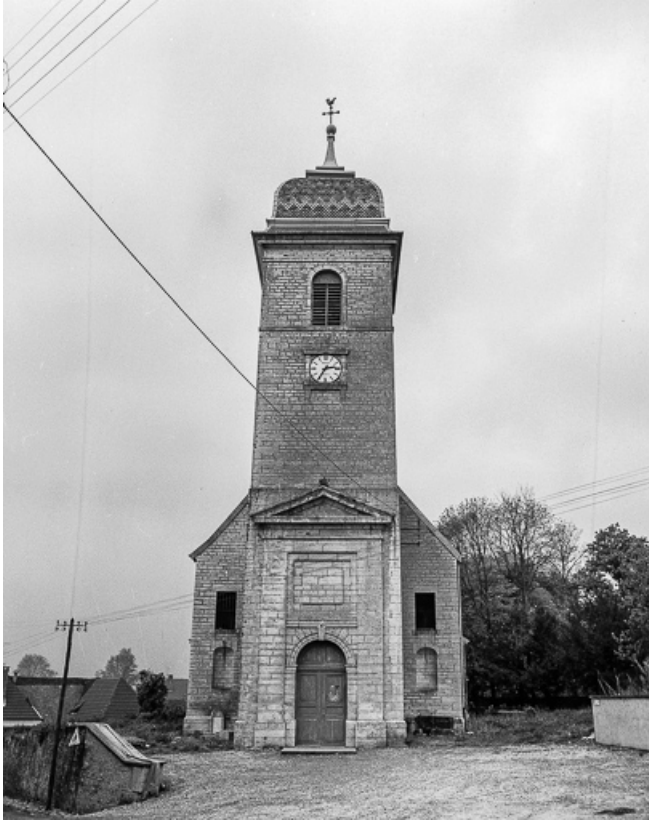
Vue du clocher-porche.