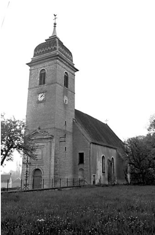
Vue d'ensemble : clocher-porche et façade latérale droite.