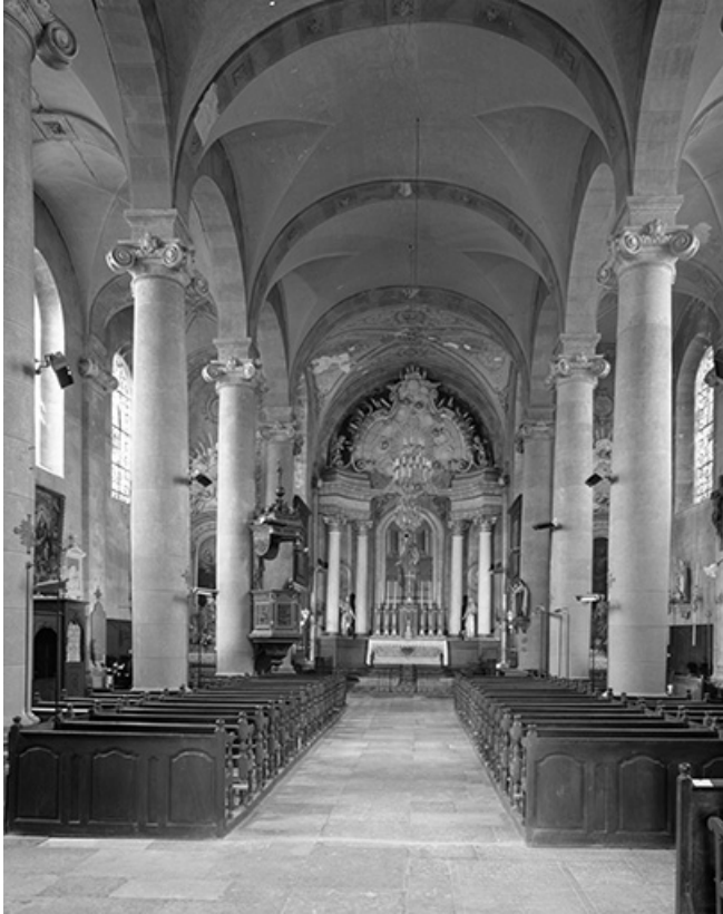
Vue de la nef et du chœur.

70, Avrigney-Virey rue de l' Eglise, lieudit : Avrigney