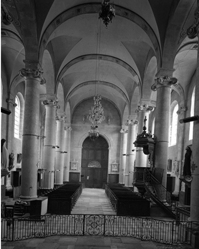
Vue de la nef depuis le chœur.

70, Avigney-Virey rue de l' Eglise, lieudit : Avigney