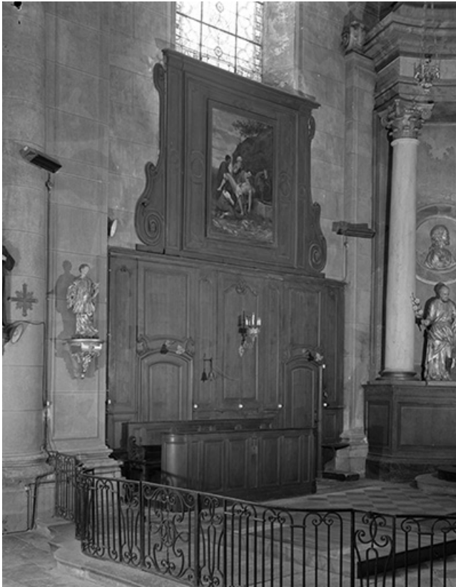
Lambris du chœur à gauche.

70, Avigney-Virey rue de l' Eglise, lieudit : Avigney