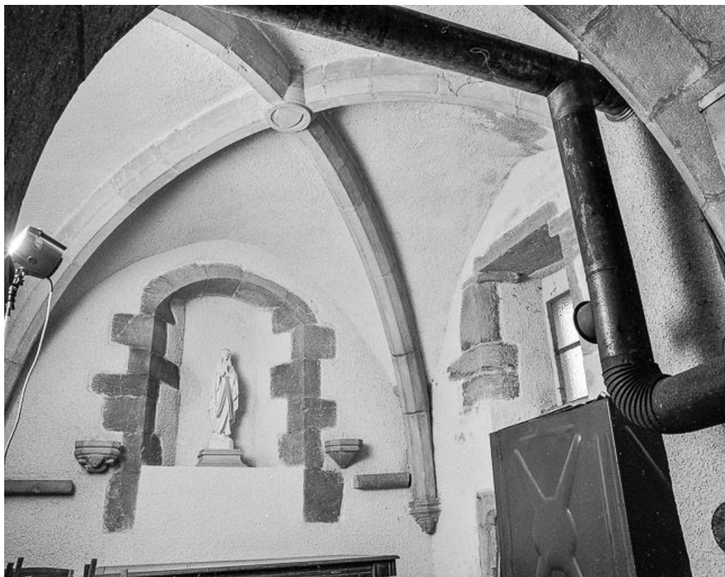
La chapelle. 39, Trenal