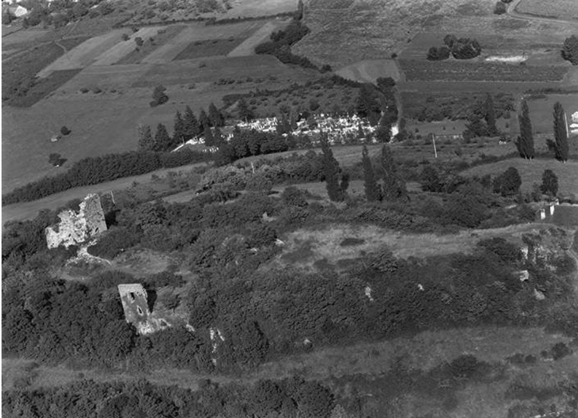
Vue aérienne en 1956