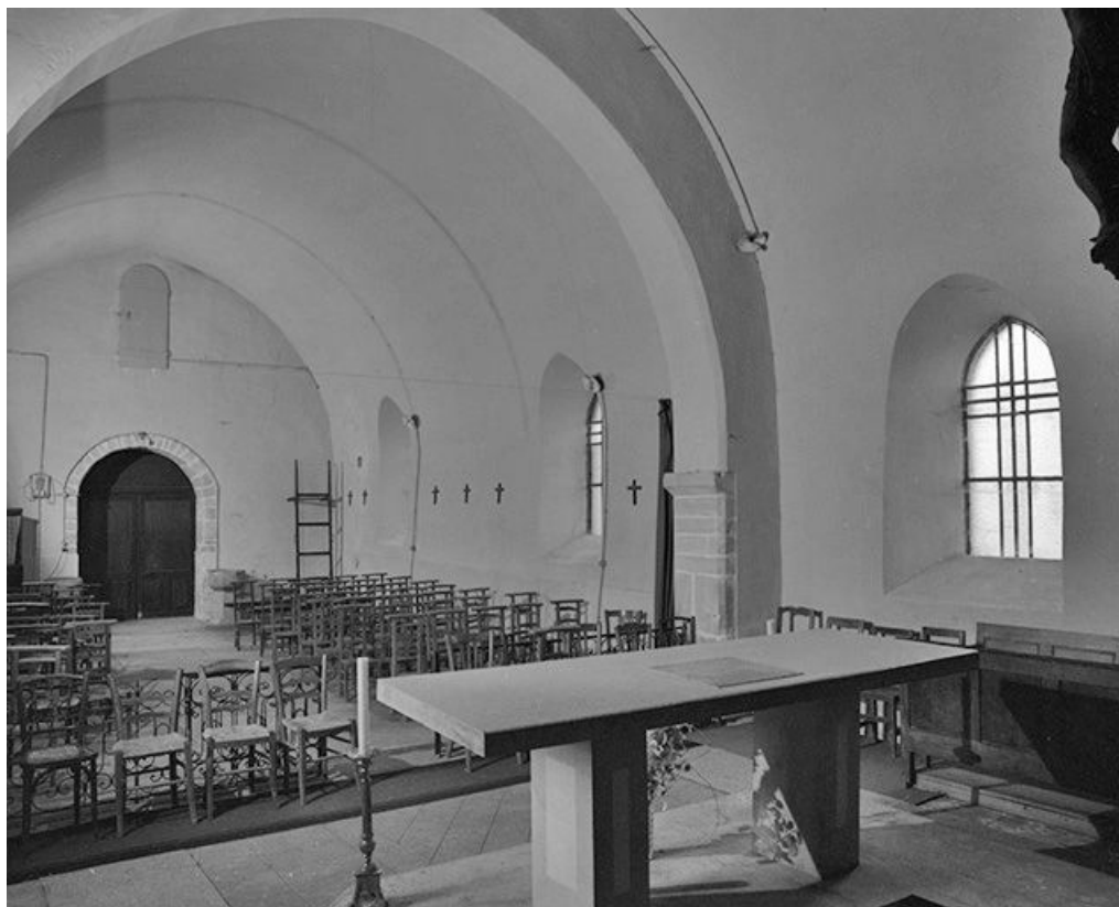
Intérieur : élévation gauche.

39, Courlans route de Chilly-le-Vignoble