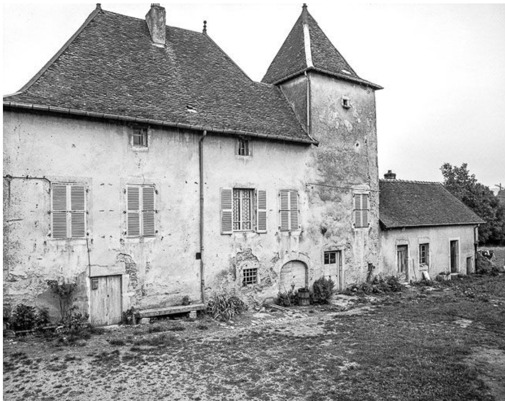
Le logis : façade sur cour.