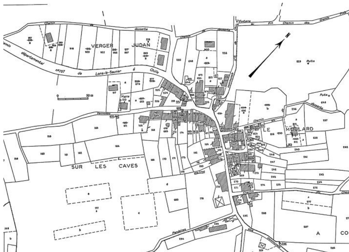
Cadastre : 1974 section unique (feuille n° 2). 39, Bornay