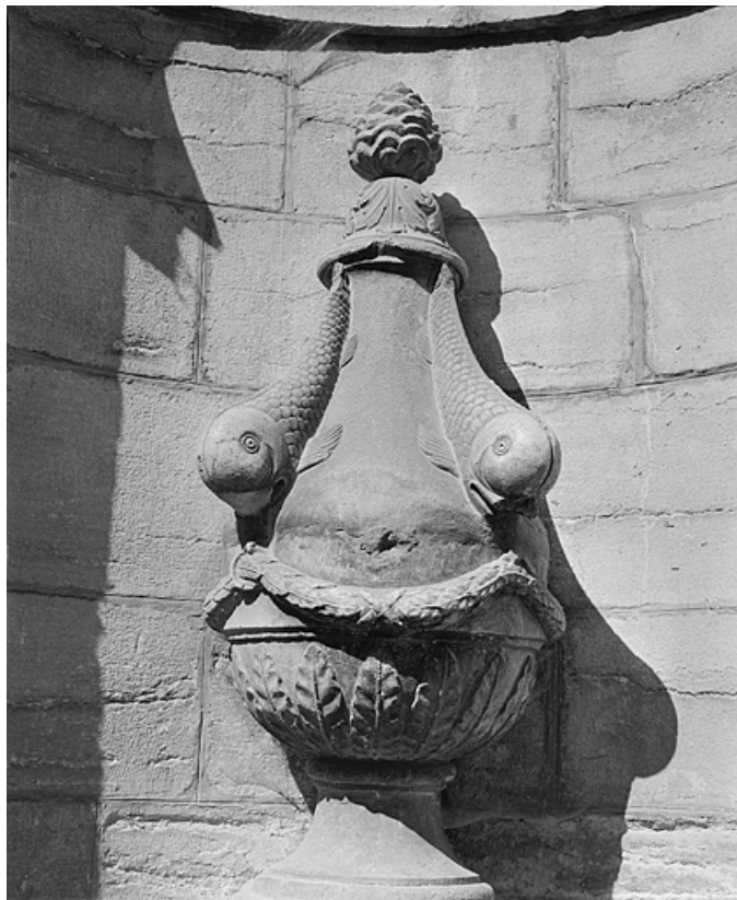
Détail de la borne.