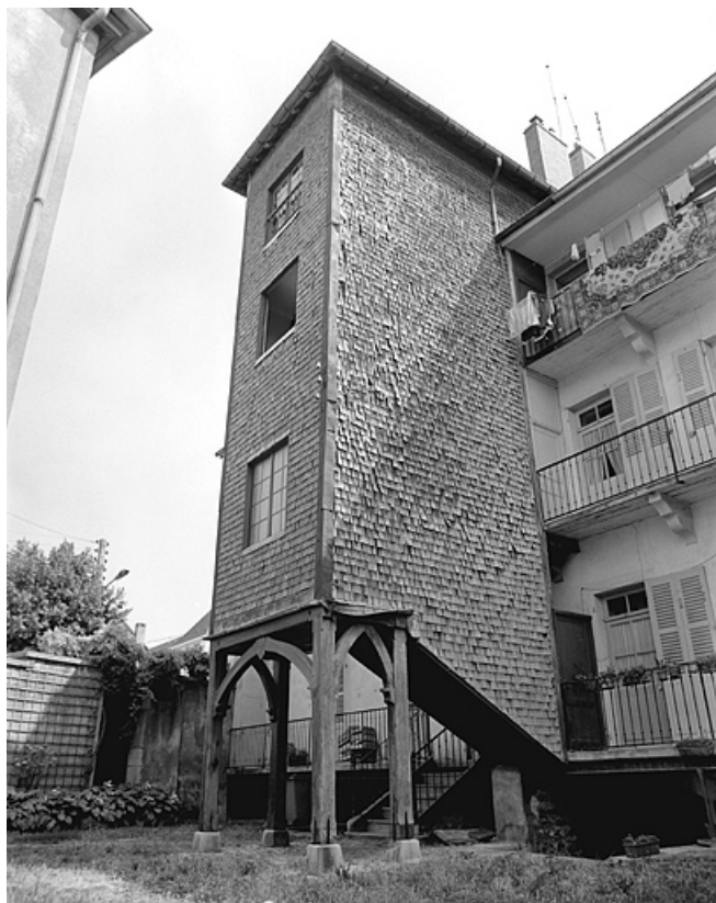
Escalier flquant la façade postérieure.