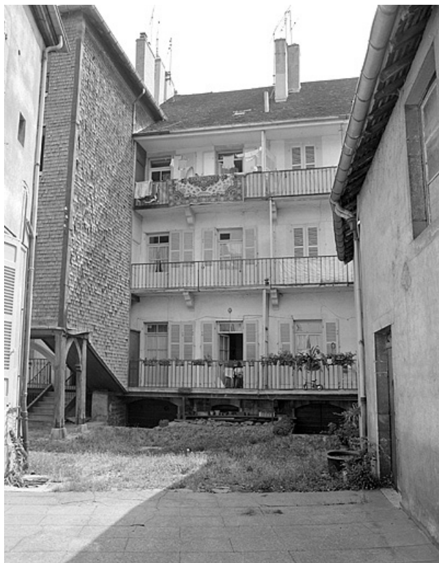
Façade postérieure montrant l'escalier à gauche.