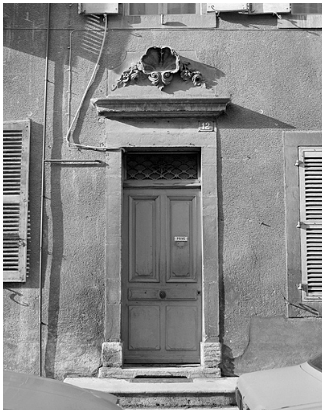
Façade antérieure, porte d'entrée.