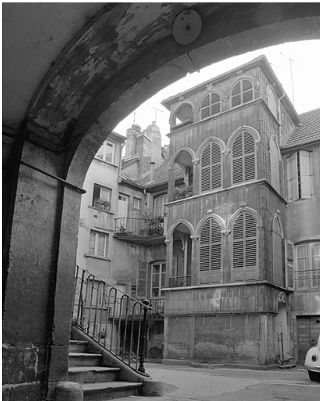
Escalier dans la cour.