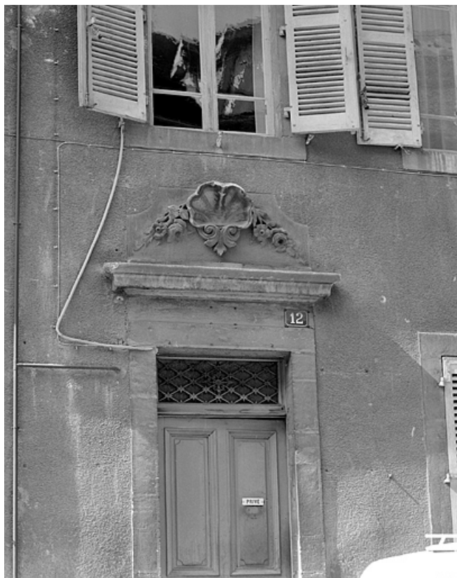
Façade antérieure, porte d'entrée, détail.