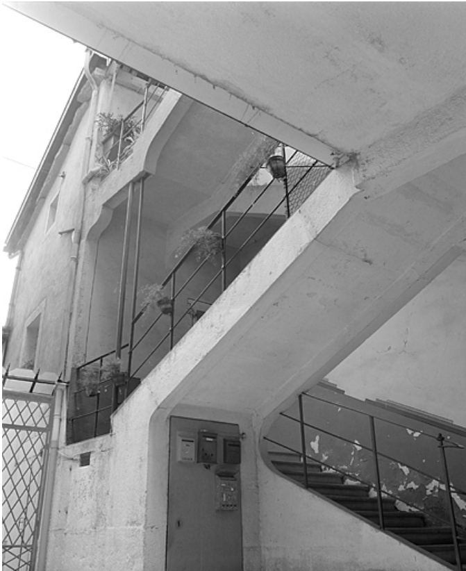
L'escalier ouvrant sur la cour.