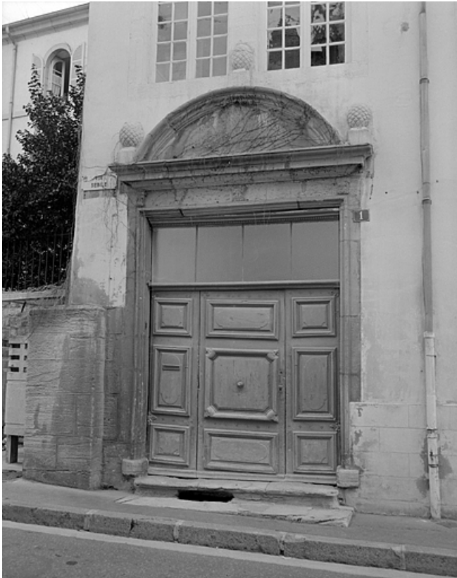
Façade sur la rue Sébile, portail gauche.